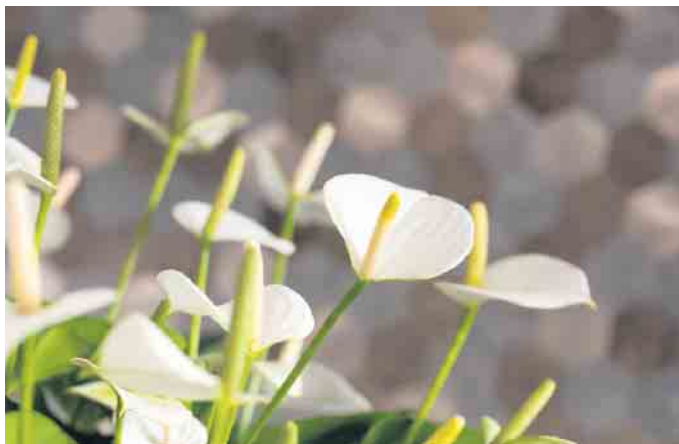
Die Hochblätter der Anthurien sorgen in der dunklen Jahreszeit für helle Reflexe in der Wohnung.

Menschen, die mit den schönen Gewächsen farbige Highlights in die Wohnung bringen möchten, rät die Stichting Promotie Anthurium, eine Stiftung niederländischer Züchter und Gärtner von Anthuriengärtnern, besonders auf diese beiden