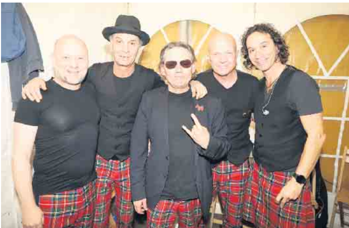
Die Band Brings sang mit dem Publikum zusammen ihren neuen Sessions-Hit, aber auch Klassiker und Evergreens hatten die Kölschrockers mit im Gepäck