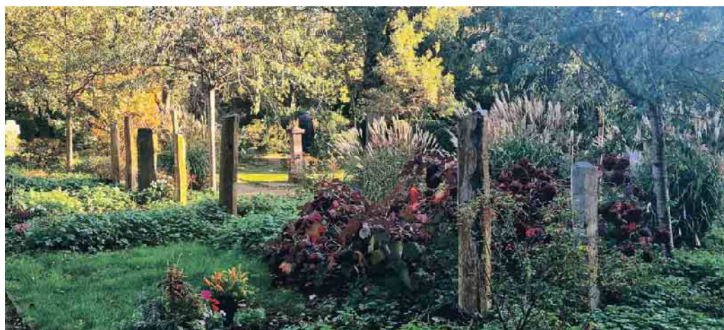
Friedhöfe als grüne Oasen in der Stadt - Gemeinschaftsgrabanlage Nordfriedhof Düsseldorf.

vollen Austausch mit einem Bestattungshaus. In einem persönlichen Beratungsgespräch können individuelle Lösungen gefunden werden, um eine Bestattung besonders nachhaltig zu gestalten und somit einem umweltbewussten Leben einen stimmigen Abschluss zu geben. Immer mehr Menschen suchen ihren Bestatter heute im Internet. Der Bundesverband Deutscher Bestatter bietet auf seinem Onlineportal www.bestatter.de eine einfache Suchfunktion an, mit der schnell und unkompliziert ein Bestatter in der Nähe gefunden und kontaktiert werden kann. Zudem gibt der kostenlose Bestattungsplaner einen Überblick über die Kosten.