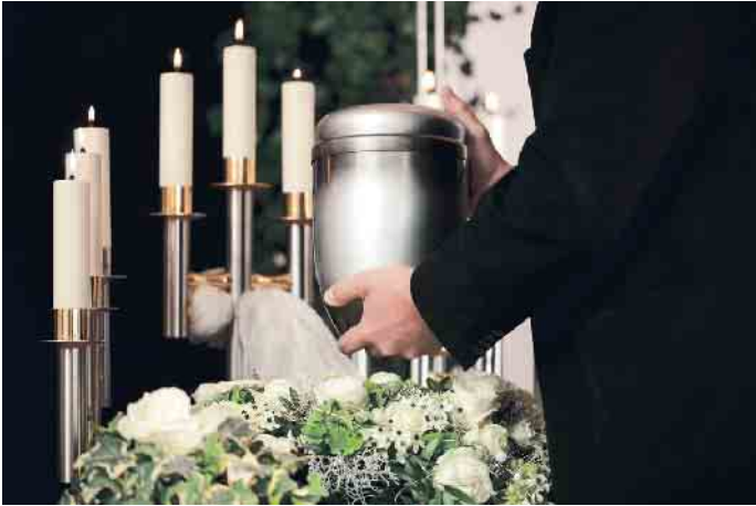
Das Markenzeichen der Bestatter ist eine eingetragene Kollektivmarke des Bundesverbandes Deutscher Bestatter e.V.

Wenn es um die Organisation einer Trauerfeier geht, ist es entscheidend, einen Bestatter zu finden, dem man vertrauen kann und der Qualität liefert. Doch wie findet man einen solchen Bestatter und woran erkennt man überhaupt einen guten Bestatter? Die Planung einer Bestattung ist ein komplexer Prozess, der viele Aspekte umfasst. Von der Organisation der Trauerfeier bis hin zur Einhaltung gesetzlicher Vorschriften gibt es viel zu bedenken. Genau dafür sind Bestatter da - sie kümmern sich um alles, damit Sie sich nicht darum sorgen müssen. Ein qualifizierter Bestatter mag auf den ersten Blick teurer erscheinen, aber Qualität hat ihren Wert. Gerade wenn es um den