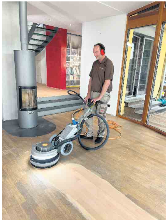
Nach einem Abschliff glänzt Parkett wieder wie neu. So kann es viele Jahrzehnte verwendet werden.

Um über Generationen in den Genuss vom warmen Holz unter den Füßen zu kommen, muss man sein Parkett entsprechend pflegen. Egal, ob lackiert, geseift oder geölt: Eine wöchentliche Reinigung