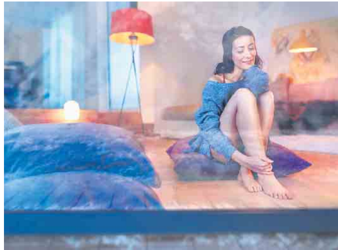
Wohlfühlen in den eigenen vier Wänden: Eine nachträgliche Dämmung von Dachboden und Kellerdecke senkt den Energieverbrauch und trägt zu einem angenehmen Raumklima bei.

Die anhaltende Energiekrise lässt Haushalte nach Wegen suchen, um den Verbrauch und damit die Kosten zu senken. Besonders im Fokus befindet sich dabei der Energiebedarf für die Wärmeversorgung der eigenen vier Wände. Einen wichtigen Schritt zu mehr energetischer Effizienz stellt im Altbau eine professionelle Wärmedämmung dar. Mögliche Befürchtungen, dass dies automatisch mit einer Großbaustelle und entsprechendem Aufwand verbunden ist, sind allerdings unbegründet. Denn mit gezielten Arbeiten vor allem an neuralgischen Bereichen wie dem Dachboden und der Kellerdecke lässt sich oft schon viel bewirken. Dass Hauseigentümer damit gleichzeitig etwas für die Umwelt tun, ist ein nicht unerheblicher positiver Zusatzeffekt. Wärmeverluste über Dachboden und Kellerdecke verhindern Dach und Keller des Eigenheims sind Kälte und wechselnden Witterungsverhältnissen direkt ausgesetzt und daher anfällig für Wärmeverluste. Das gilt insbesondere, wenn keine oder eine nicht ausreichende Dämmung vorhanden ist. Fachbe-