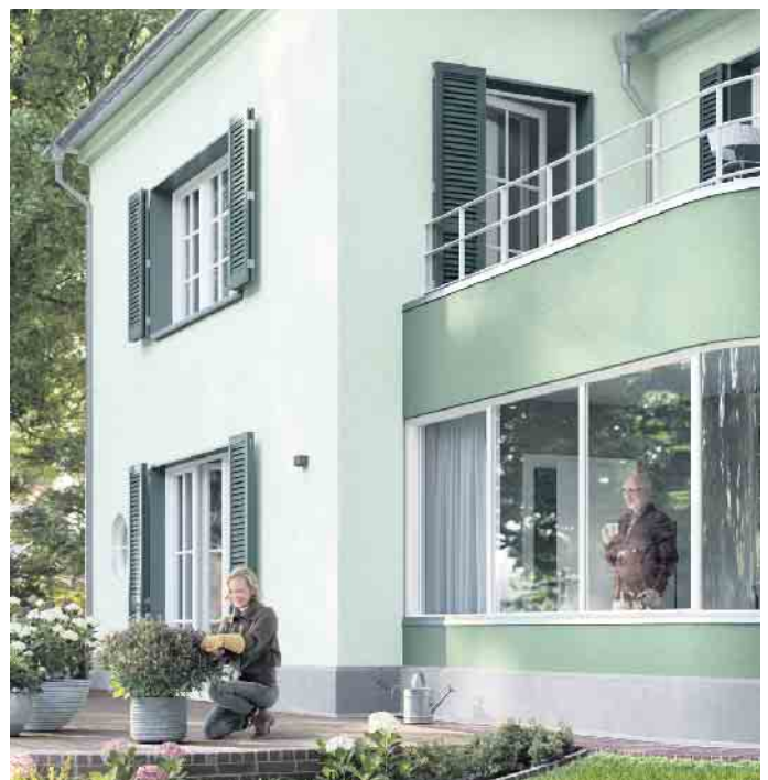
Neben der Fassade können Kellerdecke und Dachboden nachträglich gedämmt werden, um Energie einzusparen. Unter anderen kann ein Malerbetrieb fachgerecht Dämmplatten verlegen, um Kälteeindringen und Wärmeabwanderung vorzubeugen.

Dächer • Solaranlagen • Beratung • Planung • Notfall-Service