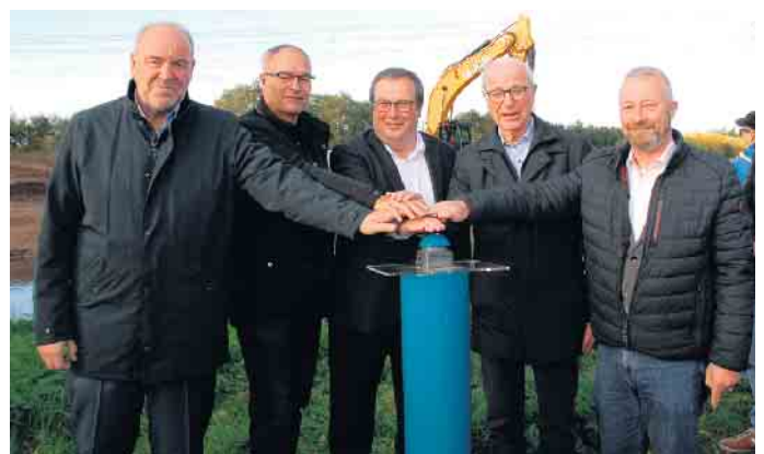
Erft fließt in ihrem neuen Bett