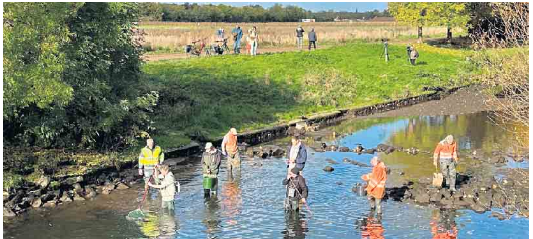
Fischereibiologen und Beschäftigte des Erftverbandes bei der Befischung des alten Erftverlaufs

Um den Baustellenbetrieb aufrechtzuerhalten und gefahrloses Zuschauen zu ermöglichen, hatte der Erftverband für interessierte Bürger*innen die Sperrung an der neuen Radwegbrücke (Verlängerung Erftstraße, Gymnich) geöffnet und am neuen Verlauf einen Bereich für die Öffentlichkeit abgesteckt. Auch am Naturparkzentrum Gymnicher Mühle war es möglich, das Ankommen des Wassers am Ende des neuen Flussverlaufs mitzuerleben, sei es vom Wasserturm im Wassererlebnispark aus oder auf dem angrenzenden Aussichtshügel, der durch den Park zugänglich war.