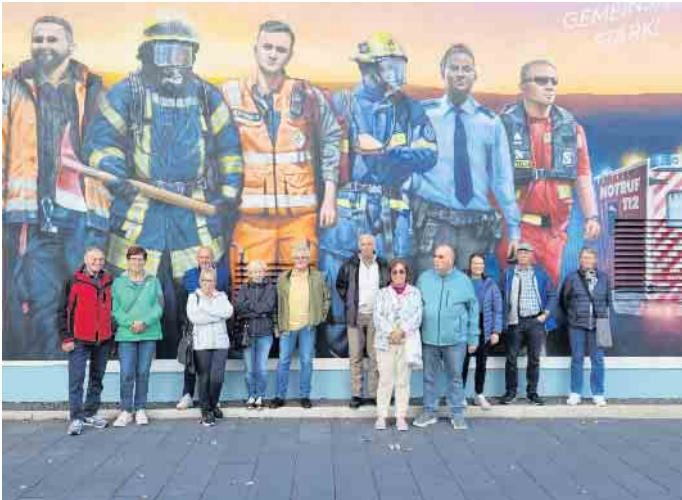
FTZ in Stockheim