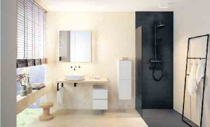
Mit den richtigen Möbeln werden Badezimmer dauerhaft sicher und komfortabel zum individuellen Wohlfühlort.

Das Badezimmer hat sich von der Nasszelle zum Wohlfühlort für Körper und Geist entwickelt. In immer mehr Haushalten wird es mit Bedacht auf ästhetische wie auch funktionale Merkmale eingerichtet. Die Deutsche Gütegemeinschaft Möbel (DGM) erklärt, worauf es bei der Auswahl und Pflege von Badmöbeln ankommt, damit sie den klimatischen Bedingungen gewachsen sind. Badezimmermöbel wie Schränke und Regale, Waschtische und Spiegel sollten nachweislich für Feuchträume geeignet und am besten mit dem RAL-Gütezeichen für Möbel, dem „Goldenen M“, ausgezeichnet sein. Denn Schwankungen der Luftfeuchtigkeit und Temperatur treten im Badezimmer häufiger und stärker auf als in anderen Räumen der Wohnung und können ungeeignete Möbel bereits nach kurzer Zeit unansehnlich oder gar mangelhaft in ihrer Sicherheit, Funktionalität und Gesundheitsverträglichkeit