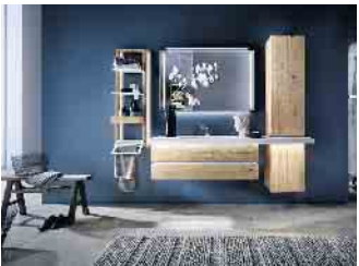
Beim Design und Material von geprüften Badezimmermöbeln bieten sich Endverbrauchern heute viele verschiedene Möglichkeiten.

Das Badezimmer hat sich von der Nasszelle zum Wohlfühlort für Körper und Geist entwickelt. In immer mehr Haushalten wird es mit Bedacht auf ästhetische wie auch funktionale Merkmale eingerichtet. Die Deutsche Gütegemeinschaft Möbel (DGM) erklärt, worauf es bei der Auswahl und Pflege von Badmöbeln ankommt, damit sie den klimatischen Bedingungen gewachsen sind. Badezimmermöbel wie Schränke und Regale, Waschtische und Spiegel sollten nachweislich für Feuchträume geeignet und am besten mit dem RAL-Gütezeichen für Möbel, dem „Goldenen M“, ausgezeichnet sein. Denn Schwankungen der Luftfeuchtigkeit und Temperatur treten im Badezimmer häufiger und stärker auf als in anderen Räumen der Wohnung und können ungeeignete Möbel bereits nach kurzer Zeit unansehnlich oder gar mangelhaft in ihrer Sicherheit, Funktionalität und Gesundheitsverträglichkeit