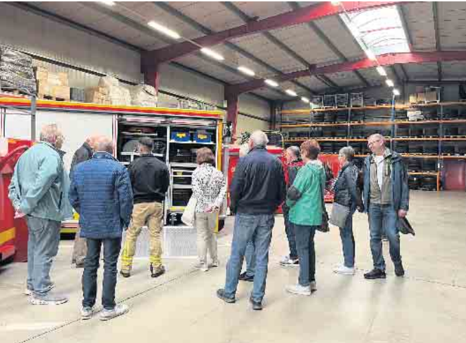
14. Oktober, Besichtigung Feuerschutztechnisches Zentrum (Wanderführer)

Sonntag, 6. November, 9 Uhr PKW, Vennwanderung im Platten Venn - Ternell mit Einkehr, 15 Kilometer nW, WF: Siggie Krämer Sonntag, 12. November, 10 Uhr