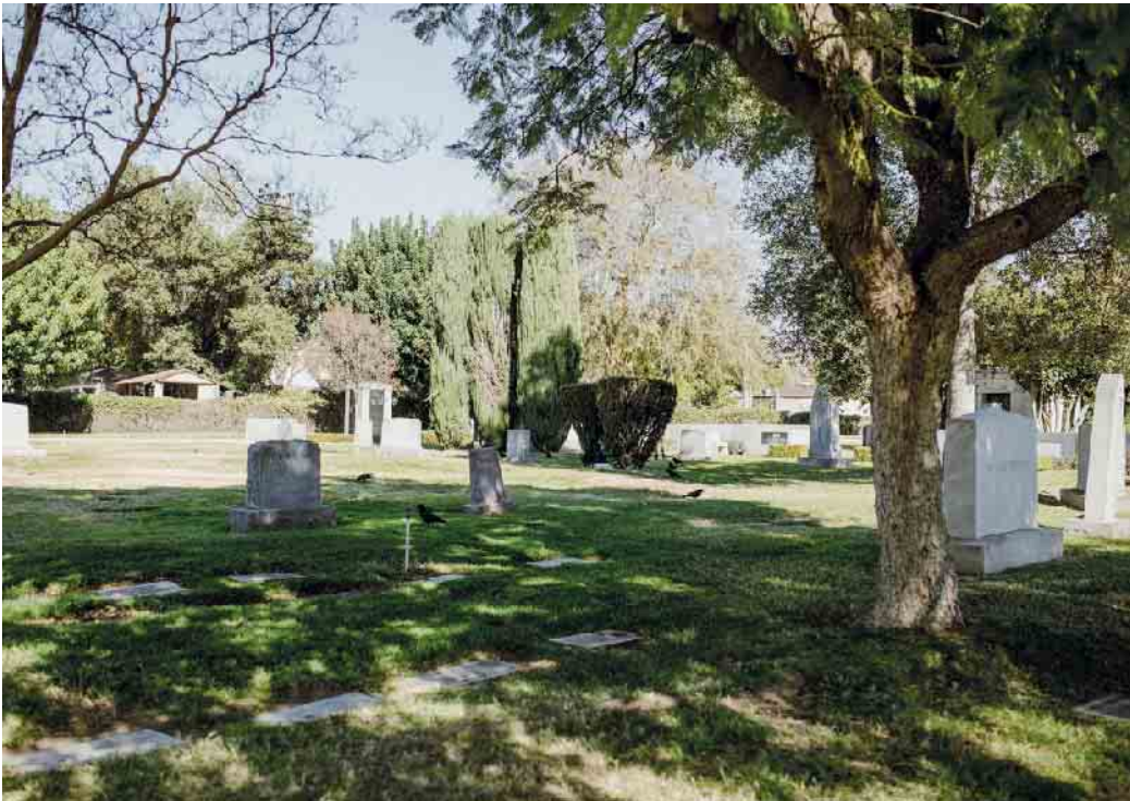
Ort der Stille, Erinnerung und Begegnung. Am Tag des Grabsteins informieren Fachbetriebe über Gestaltungsmöglichkeiten.

Auch das Thema Nachhaltigkeit gewinnt an Bedeutung. Viele Steinmetzbetriebe setzen auf heimische Natursteine statt auf importierte Materialien, deren Herkunft oft fragwürdig ist. Zertifizierte Steine aus Deutschland oder Europa stehen für faire Arbeitsbedingungen, kurze Transportwege und hohe Qualität.