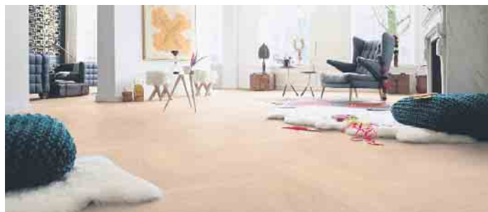
Parkett im Fischgrätmuster gibt weitläufigen Räumen Struktur.