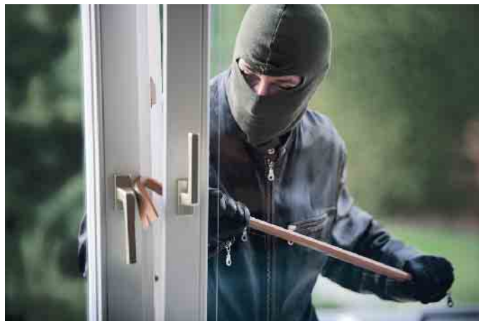
Gekippte Fenster bieten Einbrechern ideale Einstiegshilfen.