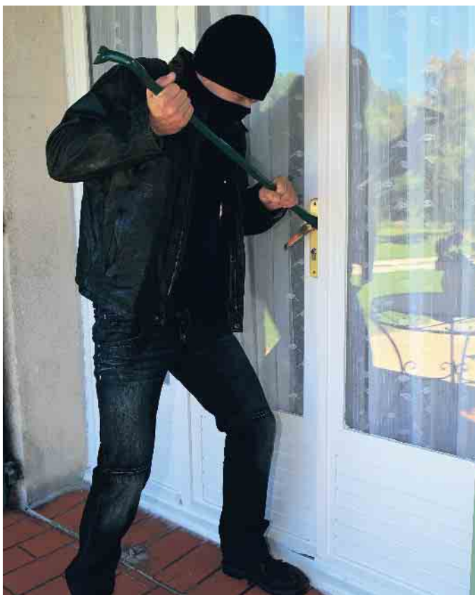
Auch Terrassen- oder Nebeneingangstüren sollten mit einbruchhemmenden Elementen ausgestattet sein.

Außenbereiche sollten beleuchtet sein, beispielsweise mit Bewegungsmeldern. Und nicht zuletzt sollte man weder auf dem eigenen Anrufbeantworter noch in den sozialen Netzwerken Hinweise auf die geplante Abwesenheit hinterlassen. (akz-o)