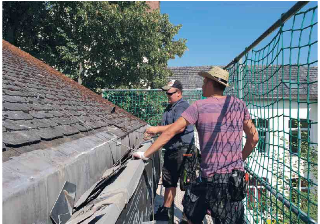
Verklammerung und Befestigung der Dachziegel bzw. -platten werden beim DachCheck geprüft.

Ist das Dach noch sicher und wetterfest? Eine wichtige Frage für alle Hausbesitzer, denn kein anderes Bauteil des Hauses wird so stark beansprucht: Zwischen hochsommerlicher Hitze und eisigen Frostnächten ist schon mal ein Temperaturunterschied von bis zu 60 Grad möglich. Dazu noch Stürme, die mit ungeheurer Kraft an den einzelnen Teilen der Dacheindeckung ziehen: Das alles kann zu Schäden an Dächern führen, die oft erst einmal unbemerkt bleiben. Im schlimmsten Fall lösen sich aber beim nächsten Sturm Ziegel, Schiefer oder Dachsteine vom Dach. Und was viele nicht wissen: Eigentümer von Gebäuden haften für Schäden, die Passanten oder parkenden Fahrzeugen durch herunterfallende Bauteile zugefügt werden. Und: Versicherungen übernehmen die Schäden nur, wenn eine regelmäßige Dachwartung durch einen Fachbetrieb belegt werden kann. „Die Rechtsprechung hat in mehreren Urteilen bestätigt, dass der Versicherungsschutz teilweise oder sogar ganz erlöschen kann. In Extremfällen, zum Beispiel, wenn Personen durch herabfallende Dachteile verletzt oder gar getötet werden, kann diese Rechtslage den wirtschaftlichen Ruin des Hausbesitzers bedeuten“,