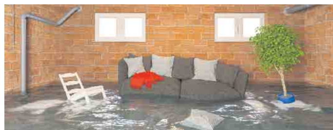
Zu Überschwemmungen im Keller soll es gar nicht erst kommen.