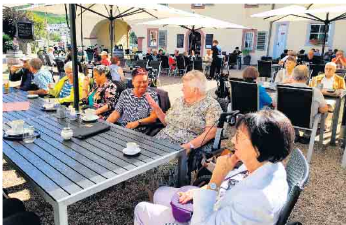
Biergarten Kloster Machern

Am 6. September ging, bei wunderbarem Reisewetter, die dies-jährige Tagesfahrt der Arbeiterwohlfahrt Merzenich nach Kloster Machern und Bernkastel-Kues. Gegen 8 Uhr fuhren wir vom Parkplatz in der Bahnstraße (Schützenplatz) in Merzenich los. In Girselsrath und Golzheim wurden noch weitere Teilnehmerinnen und Teilnehmer an dem Tagesausflug abgeholt. Nach einer reibungslosen Busfahrt kamen wir dann um 10 Uhr in Kloster Machern an. Um 10:30 Uhr war Gelegenheit sich in einem humorvollen Vortrag die Geschichte des Klosters anzuhören. Danach konnten wir das Ikonenmuseum und das Spielzeug-