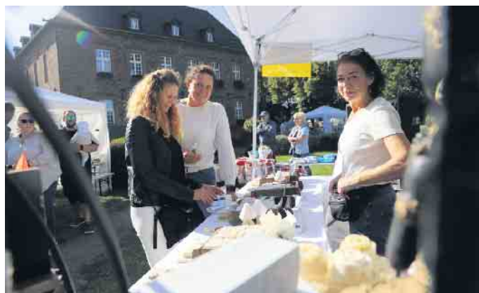
Mit handgemachten Arbeiten, wie hier liebevoll selbst hergestellte Seife, konnten die Händlerinnen die Besucherinnen und Besucher überzeugen.

darüber, dass gemeindliche Einrichtungen wie die Wohnanlage Sophienhof gGmbH, die AWO Huchem-Stammeln, der Förderverein der Kita Neue Mitte sowie die OGS Niederzier den Markt mit verschiedenen Angeboten unterstützt haben. Märkte wie dieser machen Appetit: So boten die Integrationsarbeit der Gemeinde, die KG Frohsinn Oberzier, die AWO Huchem-Stammeln und die Gesamtschule Niederzier Köstlichkeiten an. Cocktails, gemixt vom Jülicher Damen-Lions-Club und weitere Spezialitäten haben das kulinarische Angebot perfekt abgerundet. Der Erlös hieraus kommt wieder ausschließlich sozialen Zwecken zu Gute. FH