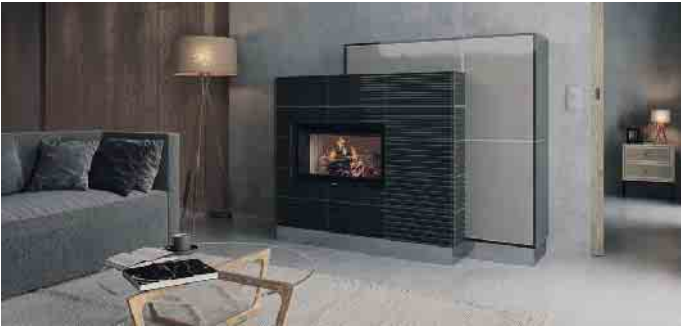
Speicher- und Grundöfen ermöglichen eine optimale Nutzung der erzeugten Wärmeenergie.

teilnehmender Betriebe finden sich unter www.kachelofentage.de . (akz-o)