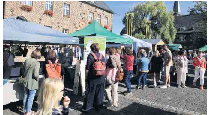
In der malerischen Kulisse des Rathauses drehte sich einen Tag lang wieder alles rund um die Handwerkskunst.