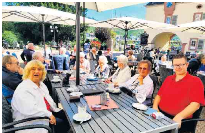
Brauhaus Kloster Machern

museum besichtigen. Ab 12:30 Uhr fand das gemeinsame Mittagessen im Brauhaus „Kloster Machern“ statt. Um 14 Uhr ging es dann weiter zum Weinfest nach Bernkastel-Kues. Hier konnte jeder bis 17 Uhr nach eigenem Geschmack seine Zeit verbringen. Gegen 17:30 Uhr begann dann unsere Heimreise und wir kamen um 19:30 Uhr wieder wohlbehalten in Merzenich an. Auch in diesem Jahr kann man festhalten, dass der Tagesausflug der Arbeiterwohlfahrt Merzenich für die Teilnehmerinnen und Teilnehmer wieder eine gelungene Abwechslung zum Alltag war, bei der man unter Freundinnen und Freunden, in