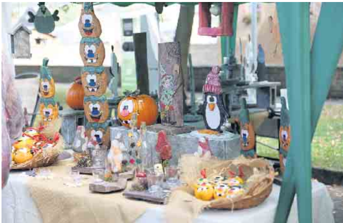
Das Angebot vor Ort kam bei Klein und Groß sehr gut an