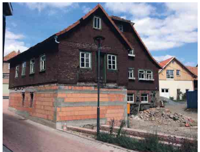
Bevor die Maler kamen, war die Mühle in einem traurigen Zustand.