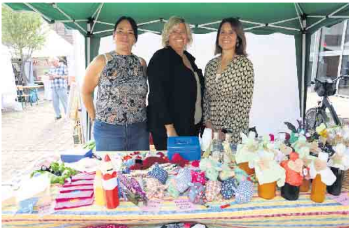
Die OGS Niederzier unterstützte auch den Markt wieder mit einem Stand