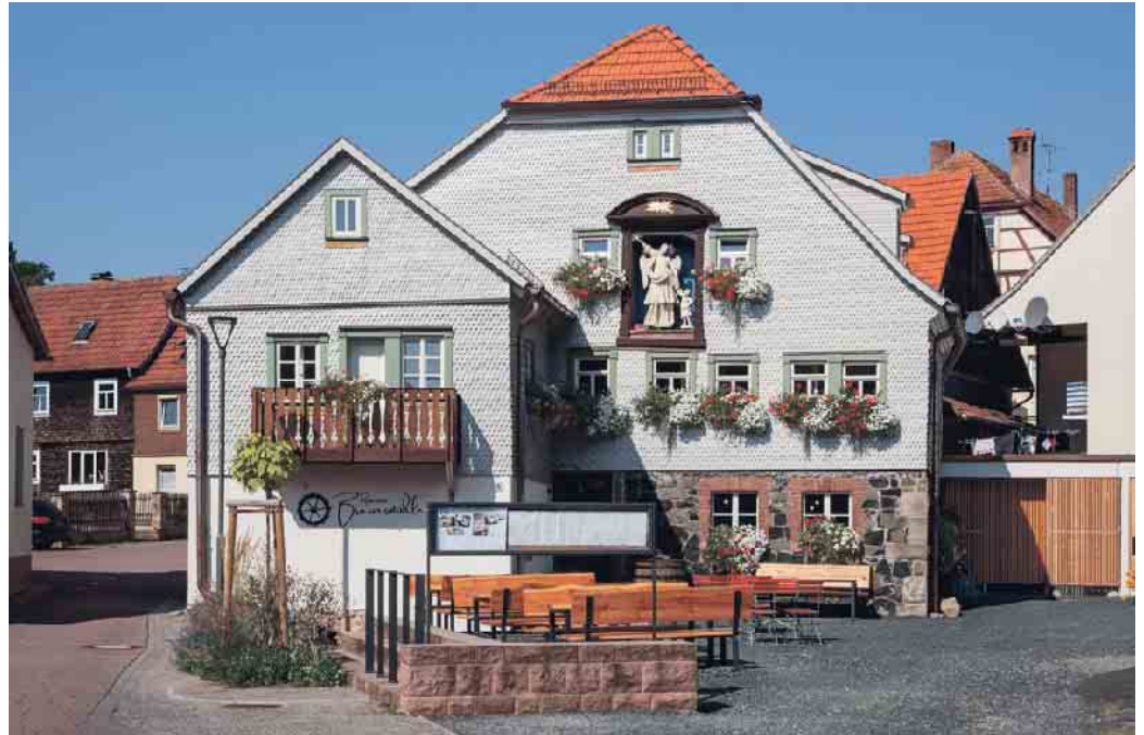
Wer die alte Mühle kannte, kommt aus dem Staunen nicht heraus.