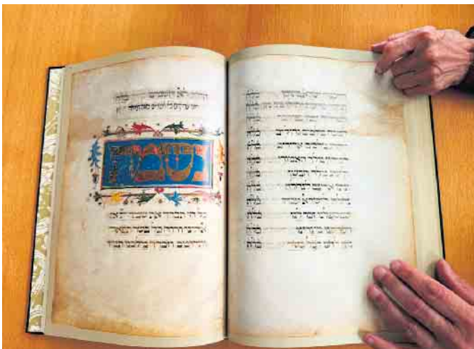
Ein Faksimile - also die Reproduktion eines Originals.

Adresse: LVR- Kulturhaus Landsynagoge Rödingen, Mühlenend 1, 52445 Titz-Rödingen.