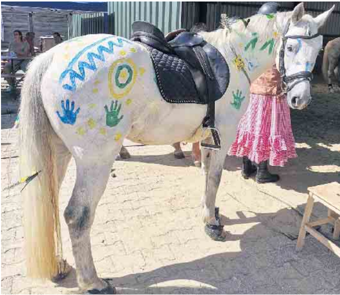
Ob Pferde und Reiter wieder so schön kostümiert sind?

cebookseite Reiterfreunde Tollhausen e.V. oder per E-Mail über rft1992@t-online.de. (B. Floß)