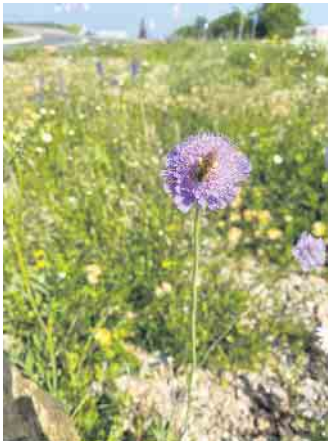
Am „Kreisel“ setzen sich widerstandsfähige Pflanzen durch.

Die aktuell sehr feuchte Wetterperiode sorgt für ein gutes und wildes Wachstum. Bis alle Pflanzen in voller Blüte stehen dauert es aber noch ein paar Tage bzw. Wochen. „Der Bewuchs mutet momentan etwas wild an, aber gerade jetzt ist es wichtig, die Pflanzen einfach wachsen zu lassen. Im Verlauf des Sommers wird es noch einmal einen Rückschnitt