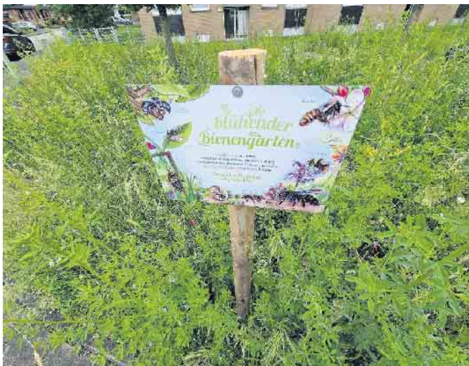
Ein kleines Schild weist am Beethovenring auf der Blühwiesenprojekt hin.