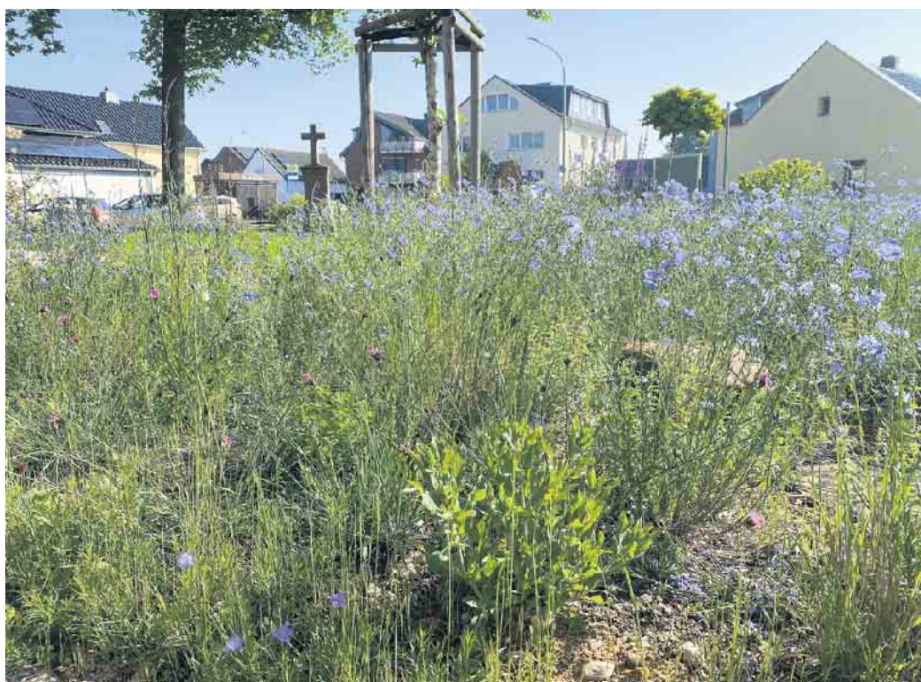
In Girkelsrath an der Dechant-Fabry-Straße blühen die Wildblumen schon ganz prächtig.