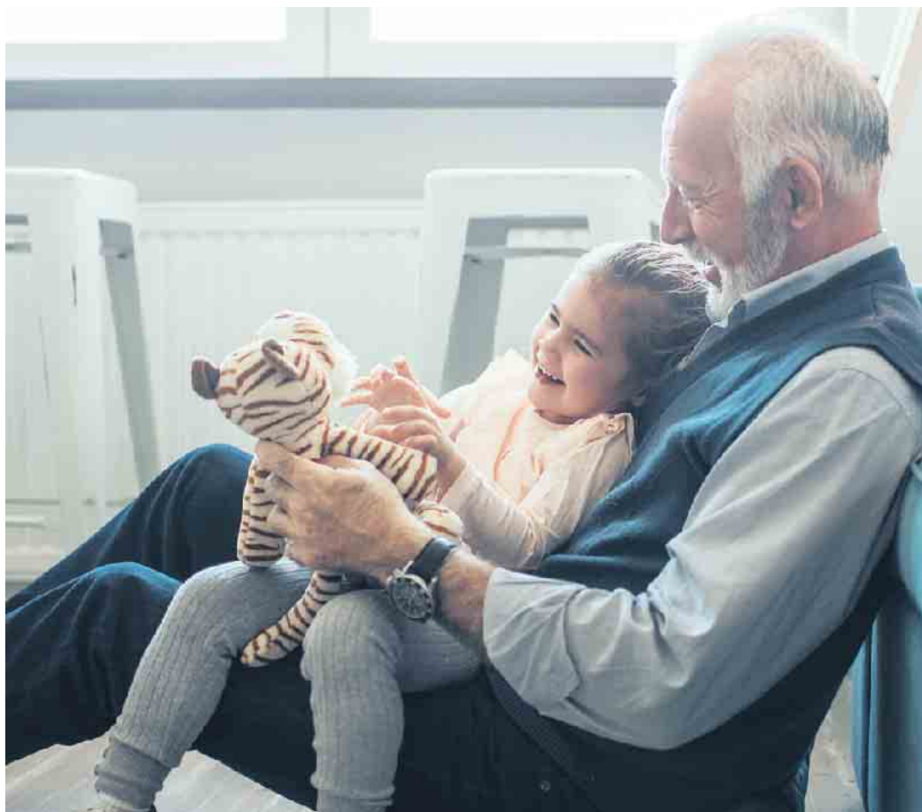
Die Gesellschaft wird immer individueller, das schlägt sich auch in den neuen Formen der Bestattungskultur nieder.

Inzwischen ist die Asche nicht mehr die einzige Kohlenstoffquelle, die für die Herstellung eines Erinnerungsdiamanten genutzt werden kann. Die Alternative sind Erinnerungsdiamanten aus Haaren. Auf sie kann man zurückgreifen, wenn Er-