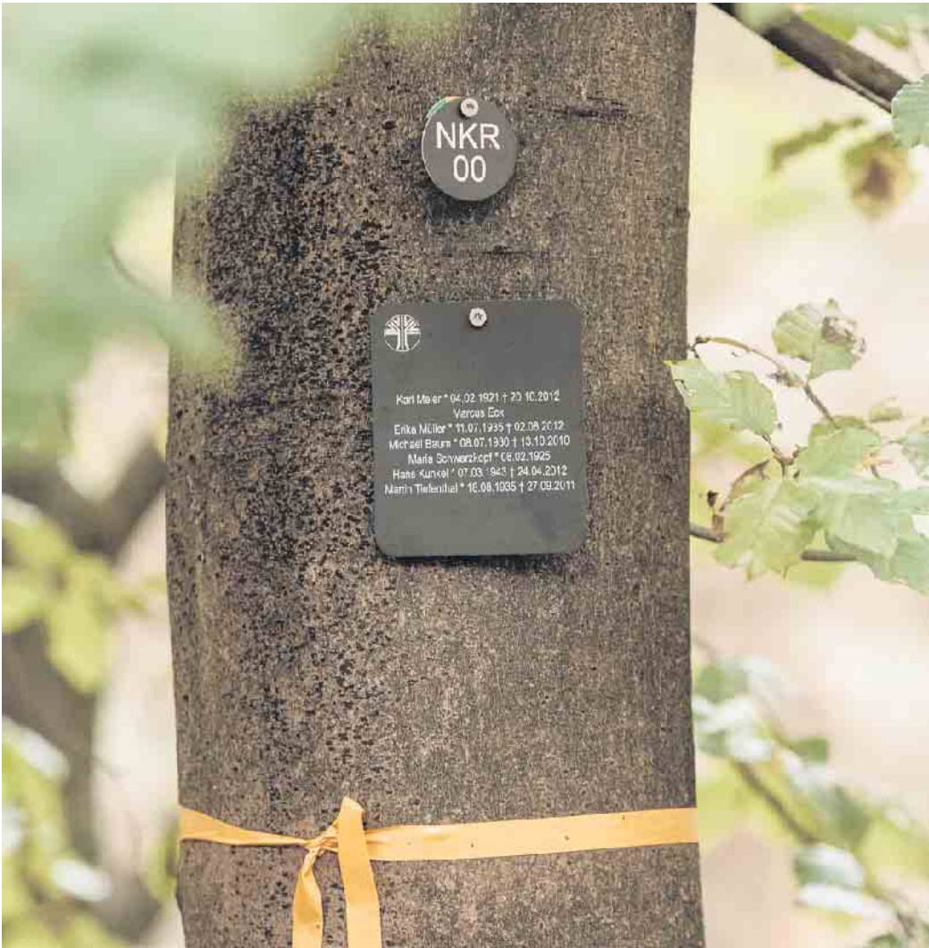
Jeder Baum, der ein Grab beherbergt, ist mit einer Nummer gekennzeichnet. Eine Namenstafel erinnert an die Verstorbenen.

Eine Übersicht über alle Termine der kostenlosen Waldspaziergänge ist unter www.friedwald.de/waldfuehrungen zu finden. Dort kann man sich auch direkt anmel-