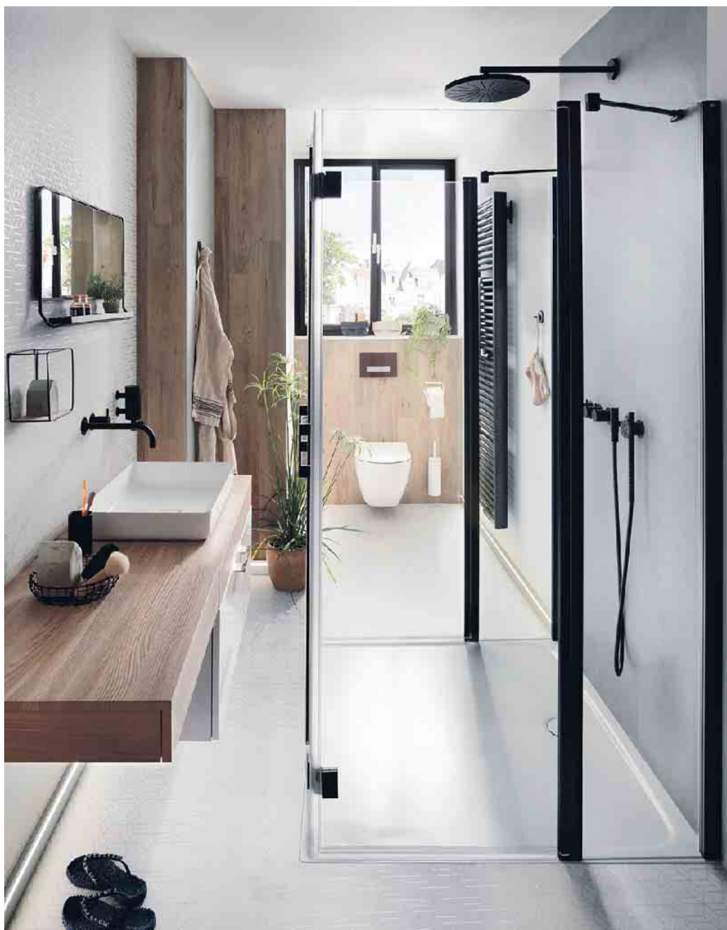
Prima geklappt: Wo wie im urbanen Raum wenig Platz herrscht, braucht man große Ideen. Oder einen Faltkünstler in Form der Duschabtrennung Liga von Kermi, die sich selbst im Schlauchbad schick schlank macht, wenn man sie nicht benötigt. Im Trendton Mattschwarz für die Beschläge gehört sie zweifelsohne zu den Lieblingen im schnuckligen Stadtbad.