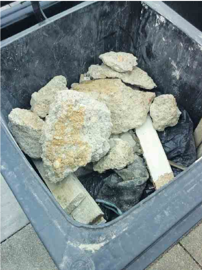
Bauschutt gehört nicht in die Mülltonne

Rennen. Sie können so schwer werden, dass sie bei der Leerung abrutschen und dadurch Beschäf-tigte gefährden. Außerdem kann Bauschutt die Mechanik der Müll-fahrzeuge erheblich in Mitleiden-schaft ziehen. Bauschutt kann kostenpflichtig an den Entsorgungszentren der AWA Entsorgung in Rurbenden, Süd, Horm und Warden entsorgt werden. Bei größeren Mengen können bei Entsorgungsbetrie-ben Container bestellt werden. Fragen zur Entsorgung von Bau-schutt und den Entsorgungszen-tren beantwortet die AWA-Ab-fallberatung unter 02403 / 8766353.