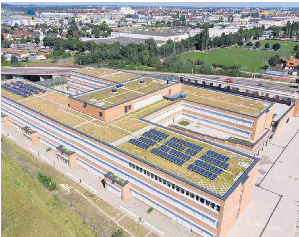
Große Flachdächer wie hier auf einer Realschule in Nürnberg eignen sich sowohl zur Begrünung als auch zur Stromgewinnung.

Besonders vielfältig sind die Möglichkeiten naturgemäß auf flachen Dächern, sie reichen von der Wildblumenwiese über den Dachgarten und das hauseigene Biotop bis hin zum solaren Kleinkraftwerk. Wer begrünt, schafft nicht nur eine optische Verschönerung, sondern trägt aktiv zum Klimaschutz bei. Vor allem in Ballungsräumen sind die Flächen in hohem Maße versiegelt, für Siedlungs- und Verkehrsflächen liegt die Quote aktuell bei 45 Prozent. Im Vergleich zum angenehmen Klima in Wäldern und naturbelassenen Räumen entsteht so ein aufgeheiztes Stadtklima, dem sich mit einer Begrünung entgegenwirken lässt. Für ein Stück Natur auf dem Dach bieten Hersteller wie Bauder komplette Systemaufbauten von der Abdichtung bis hin zur Energiegewinnung und Absturzsicherung. Fachleute aus dem regionalen Handwerk kön-