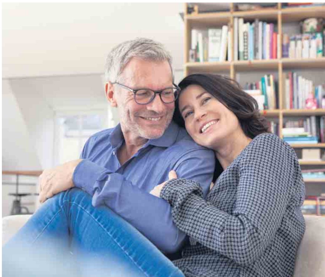
Gemütlichkeit muss nicht auf Kosten des Energieverbrauchs gehen. Eine hochwertige Dämmung der Wände hält die Wärme besser in Haus oder Wohnung.

Ein klammes Raumklima trotz aufgedrehter Heizungsthermostate ist ein deutliches Zeichen dafür, dass das Zuhause dringend modernisiert werden sollte. Bei schlecht oder gar nicht gedämmten Außenwänden geht permanent Wärme verloren, es