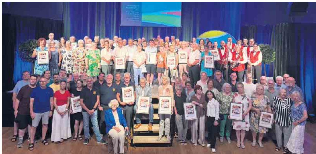
25 Einzelpersonen, Gruppen oder Vereine haben den Ehrenpreis für ehrenamtliches Engagement des Kreises Düren erhalten. Auch der indeland-Preis und der Sonderpreis wurden vergeben.

Es folgten 25 weitere Einzelpreisträgerinnen oder -Preisträger, Vereine und Organisationen, die nacheinander auf die Bühne kamen und die wertschätzenden Worte, die Urkunden und das Preisgeld in Höhe von jeweils 250 Euro entgegennahmen. Ein großer Dank ging auch an die Sparkasse Düren, ohne die diese Feierstunde nicht möglich wäre. Es zeigte sich einmal mehr, wie vielseitig die Bereiche sind, für die