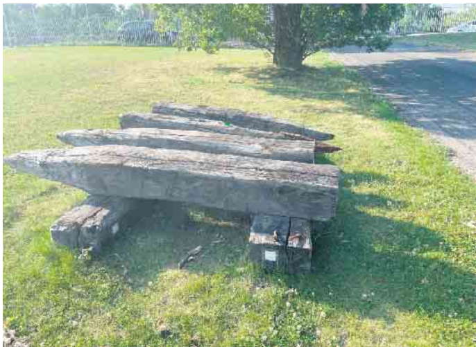
Historische Brückenpfeiler.

ge der Bäume konnten Holzart, Alter und Fälldatum bestimmt werden. Diese dendrochronologische Untersuchung ergab eine Zeitspanne, die von 1727 bis 1943 reicht, in der die Bäume gefällt wurden. Der älteste Baum wurde 1664 gepflanzt. Das höchste Alter wies ein Eichenpfahl aus einem Baum auf, der im Jahr des Fällens stolze 188 Jahre alt war. Obwohl die meisten der beprobten Hölzer aus dem 19. Jahrhundert stammen, gehören einige vermutlich zu der 1792 zerstörten Rurbrücke und zur napoleonischen Schleusenbrücke von 1806. Das Anfang 2023 am stadtseitigen Ufer freigelegte massive Auflager der Schleusenbrücke konnte unter der Neukonstruktion der Rurbrücke belassen und konserviert werden. Die jetzt im Brück-