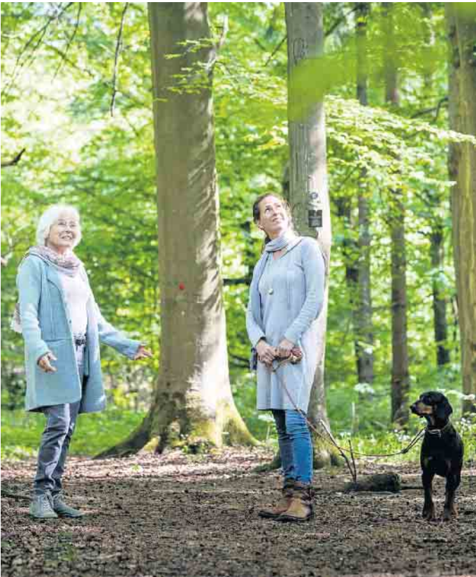
Viele Hinterbliebene lassen ihren Erinnerungen gern bei einem Spaziergang durch den Bestattungswald freien Lauf.