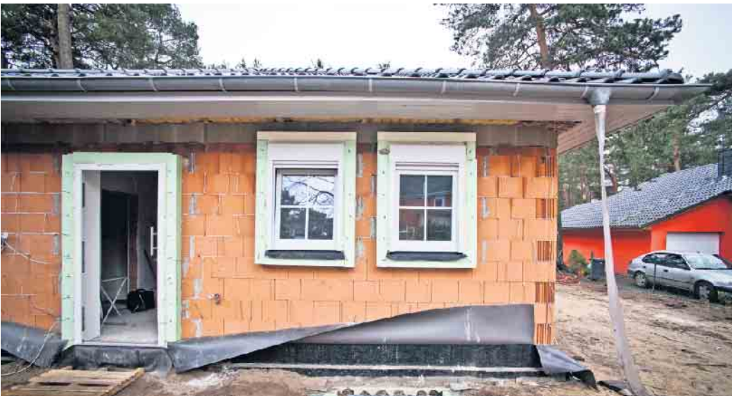
Ideal für ein selbstbestimmtes Leben in den eigenen vier Wänden bis ins hohe Alter: Wohnen auf einer Ebene.

So plant man das Eigenheim für ein selbstbestimmtes Leben in jeder Lage