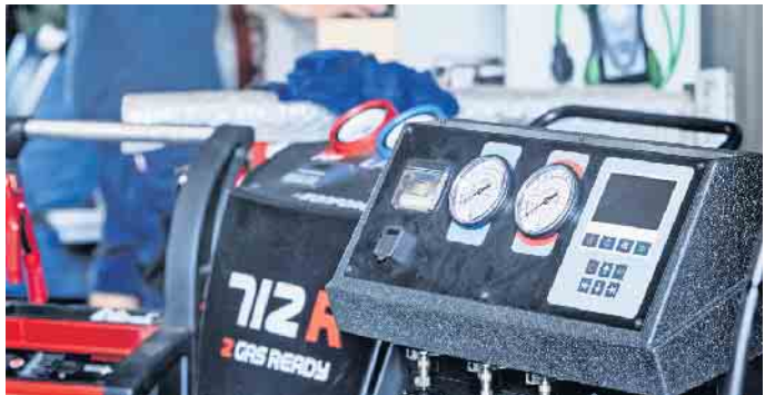
Mechaniker mit Sachkundenachweis für die Klimaanlagenwartung und professionelle Klimatestgeräte stellen sicher, dass bei der Überprüfung der Fahrzeugklimatisierung nichts übersehen wird.

zu lassen, statt sofort loszufahren. Um zu Fahrtbeginn eine schnelle Abkühlung zu erzielen, ist die Umluft-einstellung gut geeignet. So wird nicht stetig warme Luft von außen zugeführt. Nach spätestens fünf Minuten sollte man jedoch auf Normalbetrieb umstellen, da sonst der Sauerstoffgehalt im Fahrzeuginnenraum sinkt. Die Fenster zu öffnen, mag angenehm sein, doch dabei sorgt die warme Außenluftzufuhr ebenfalls dafür, dass die Klimaanlage mehr als nötig arbeiten muss. Auch eine zu starke Abkühlung ist zu vermeiden. Experten empfehlen Außentemperatur minus sechs Grad sowie nicht unter 21 oder 22 Grad, da zu niedrige Temperaturen den Kreislauf belasten und Erkältungen nach sich ziehen können. Als Vorbeugung gegen Gerüche sollte die Klimatisierung zudem ein paar Minuten vor Fahrtende ausgeschaltet werden. So kann Kondenswasser verdunsten und der Gefahr der Ansiedlung von geruchsbildenden oder allergenen Keimen wird vorgebeugt. (DJD)