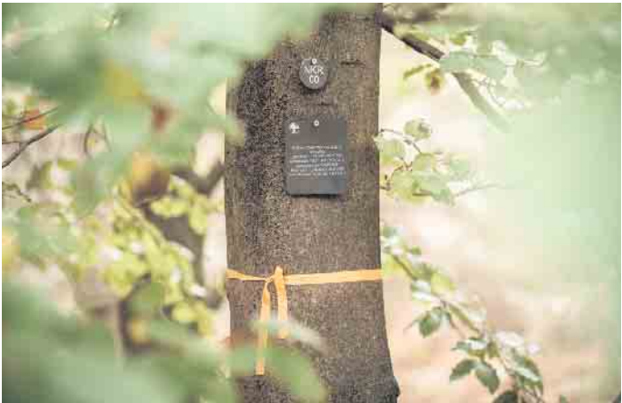
Ein Grab in einem Bestattungswald kann über die Baumnummer und eine Namenstafel gefunden werden.

nen selbst verfassten Brief an den Verstorbenen vor. Kinder finden die Idee, diesem Menschen eine Umarmung durch den Baum zu schicken, oft sehr nachvollziehbar. (djd)