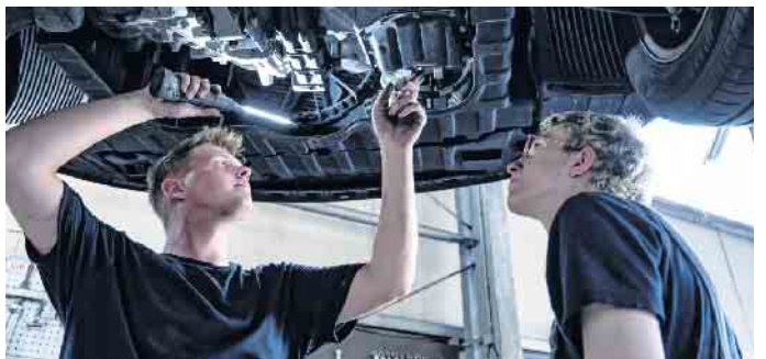
Beim Klimaanlagen-Check prüft der Kfz-Mechaniker alle Teile der Anlage und ihre Funktionen.

Der Zentralverband Deutsches Kfz-Gewerbe weist auf Probleme hin, die durch eine mangelhafte Wartung entstehen können. Ein niedriger Stand des Kältemittels etwa kann die Leistung beeinträchtigen und zu Schäden am Kompressor der Klima-