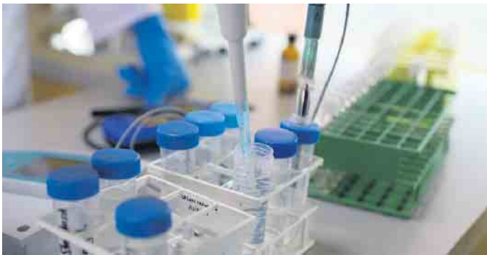
In dem mobilen kleinen Labor waren unterschiedliche Messgeräte zu finden

Mitarbeiter die richtige Analyse zu finden. In den meisten Fällen möchte die Kundin oder der Kunde erfahren, ob das Brunnenwasser problemlos für das Gemüse oder den Pool im eigenen Garten genutzt werden kann. Ist einmal die Voranalyse getroffen und eine entsprechende Stufe der Prüfung gefunden, geht es weiter. Oft wird die Garten- und Brauchwasseranalyse (B) an diesem Tag in Anspruch genommen. Dann sieht der Werdegang für die Kundin an diesem Tag so aus. Die Probe bekommt zunächst eine Probennummer. Die Probe geht später ins Labor. Wichtig zu wissen ist, dass keine Kontaktdaten, Namen usw. gespeichert werden. Die Mitarbeiter arbeiten mit dem eingesendeten Wasser nur über die Probennummer. Die aufgenommenen Kontaktdaten werden nur zur Zusendung