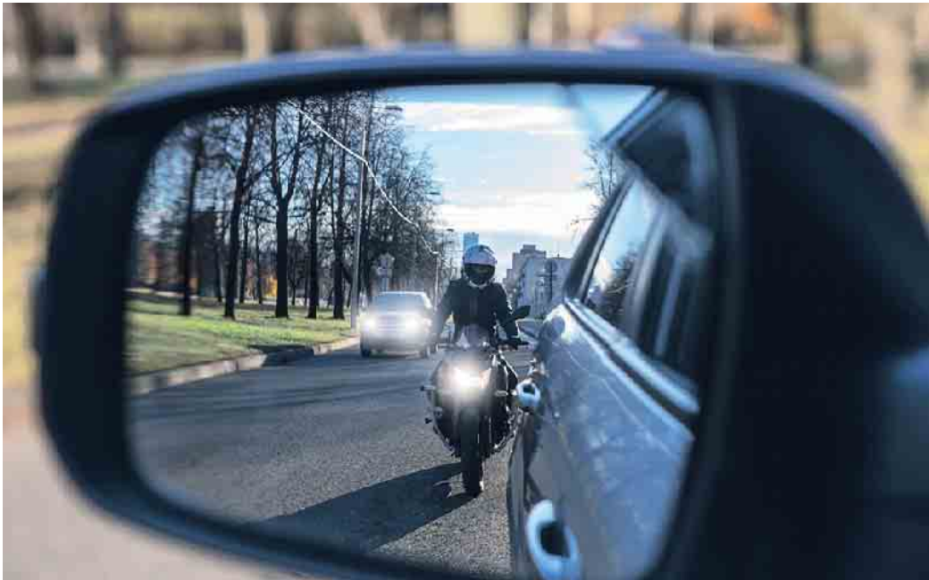
An Motorrädern muss tagsüber stets das Licht eingeschaltet sein, um es im Straßenverkehr besser sichtbar zu machen.

Gut gesehen zu werden, hilft bei der sicheren Teilnahme am Straßenverkehr. Das gilt auch im Sommer, selbst wenn dieser viel Sonnenschein und lange Tageslichtphasen bietet. Denn zum Beispiel ungünstiger Sonnenstand (Gegenlicht), Regen, Nebel und andere Phänomene können die Wahrnehmung von Autofahrern und anderen Verkehrsteilnehmern auch im Hellen beeinträchtigen. Besonders in solchen Situationen hilft es, wenn Fußgänger und andere Fahrzeuge durch starke Farben, hohe Kontraste oder Licht besser wahrzunehmen sind. Seit Februar 2011 müssen alle neuen Personenwagen, die in Deutschland zugelassen werden, mit Tagfahrlicht ausgestattet sein. Für Lastwagen gilt diese Regelung seit August 2012. Weit ver-