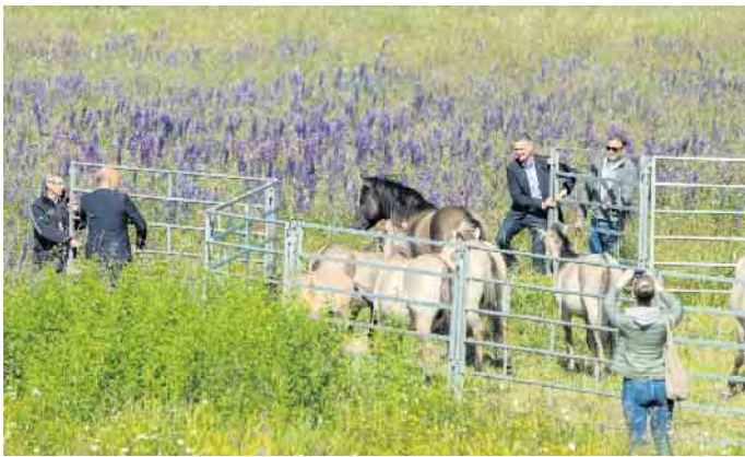
Sieben Konikpferde erweitern nun die Artenvielfalt auf der Sophienhöhe.

der Stiftung FREE Nature, des Verbands Neuland Hambach und der Forschungsstelle Rekultivierung. Zur Herde gehören aktuell ein Hengst, drei Stuten, zwei Jährlinge und ein Fohlen. Die robuste Rasse ist fast mit dem bekannten Dülmener Wildpferd identisch. Die Tiere sind bis zur Schulter maximal 1,45 Meter hoch, haben ein mausgraues Fell, einen dunklen Rückenstrich und an Zebras erinnernde Streifen an den Beinen. FREE Nature hat europaweit bereits rund 50 solcher Beweidungsprojekte verwirklicht. Die niederländische Stiftung setzt dazu auch auf Hochlandrinder, Wasserbüffel, Galloway-Rinder, Wisente und Exmoor-Ponys. Ihr Projektleiter Patrick van den Burg: „Unsere Konikpferde werden auf der offenen Fläche sicher das ganze Jahr über genug