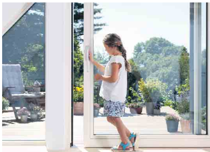
Barrierefreiheit in all seinen Facetten.