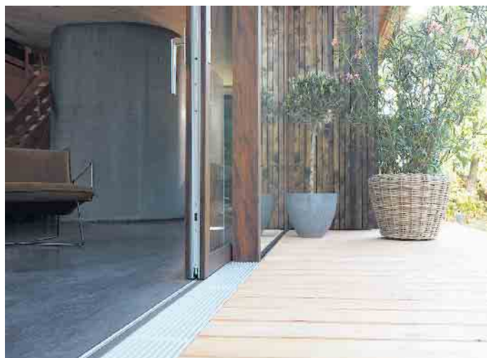
Barrierefreiheit in all seinen Facetten.

Bei Fenstertüren kommt es besonders auf eine gute Passierbarkeit an. Hier sollten extra breite Ausführungen eingeplant werden, bei denen die Tür- oder Bodenschwelle barrierefrei konstruiert ist. Auf diese Weise ist ein problemloses Durchkommen immer garantiert. In der Planung beispielsweise der Terrassentür sollten zusätzliche Maßnahmen