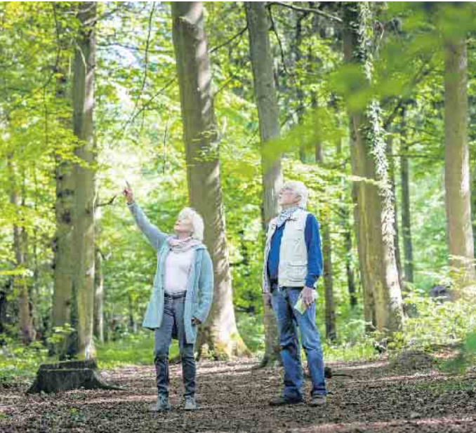
Einen Bestattungsbaum kann man sich bei einem Waldspaziergang selbst aussuchen. Die Alternative ist ein virtueller Rundgang.

Bei realen oder virtuellen Waldrundgängen den passenden Bestattungsbaum finden