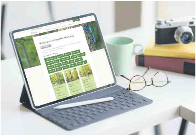
Ein Urnenbegräbnis im Wald lässt sich auch online organisieren.

virtuelle Panoramatauren der näheren Umgebung angeschaut werden können. Dadurch lernt man deren Schönheiten und Besonderheiten als Ort der letzten Ruhe kennen. Für eine Urnenbestattung im Wald gibt es unterschiedliche Gräber an verschiedenen Baumarten. Je nach Wunsch sucht man einen oder mehrere Einzelplätze an einem gemeinschaftlich genutzten Baum oder einen ganzen Baum exklusiv für die Familie oder den Freundeskreis aus. Die konkreten Kosten können transparent online oder im Wald direkt nachgelesen werden. (djd)