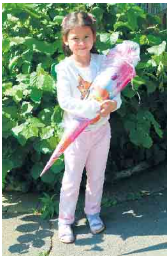
Schultüte mit Fantasie gefüllt

Anregung des Arbeitskreises Zahngesundheit im Kreis Düren