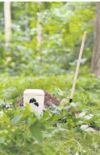
Bei einer Waldbestattung kommen ausschließlich biologisch abbaubare Urnen in die Erde.

Mit zunehmendem Alter machen sich viele Menschen Gedanken um eine würdevolle Bestattung. Bei der Entscheidung zwischen klassischem Sarg- und Urnenbegräbnis liegt die Urne mittlerweile deutlich vorn: 2020 fanden laut Statista 76 Prozent der Verstorbenen in Deutschland so ihre letzte Ruhe und nur noch 24 Prozent bei einem Sargbegräbnis.