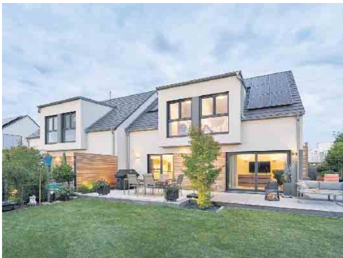
Doppelhaus in Fertigbauweise - das geht achsensymmetrisch oder auch grundverschieden.