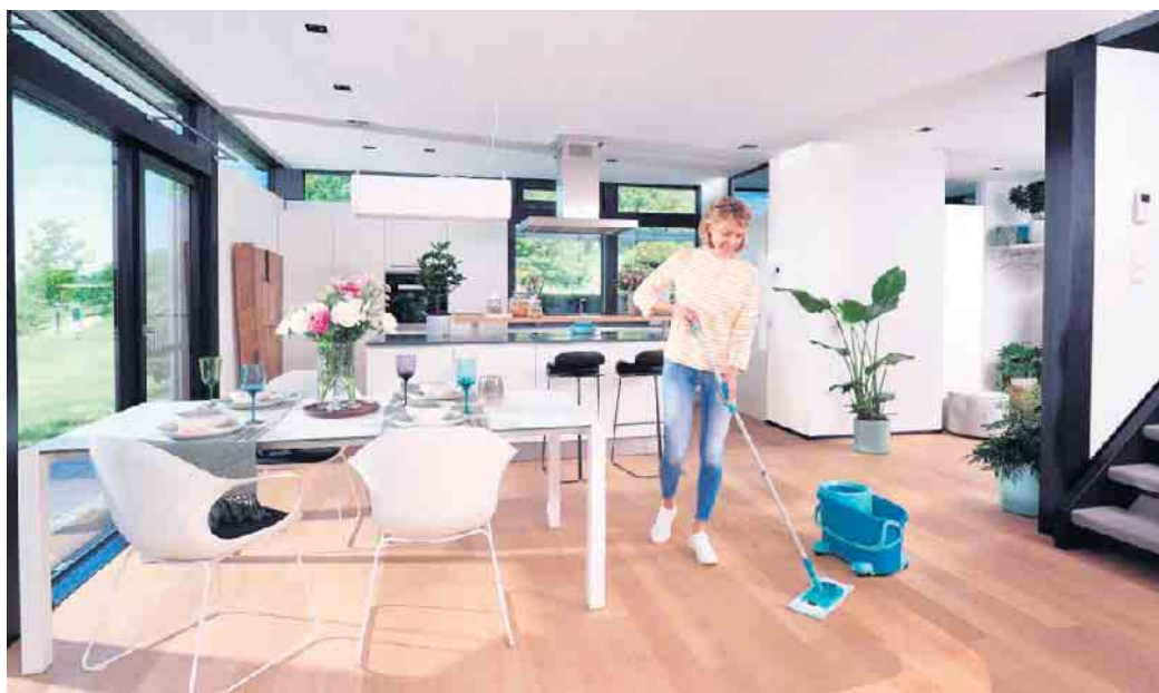
Verschmutzungen finden keinen Halt auf der glatten Holzoberfläche.