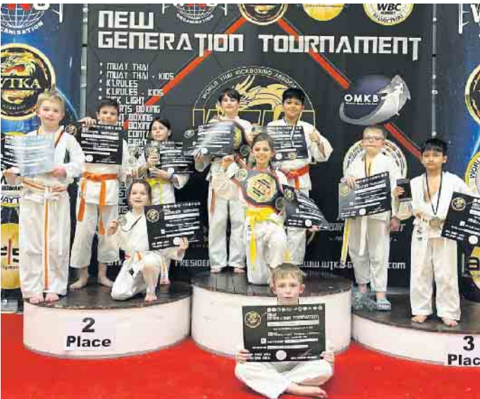
Strahlende Gewinner und Platzierte der Karate Akademie Düren e.V.

Am vorletzten Wochenende im Mai fand in Arnsberg der internationale Newcomer Cup für Kinder, Schüler und Jugendliche statt. Über 70 Vereine aus neun Nationen schickten ihre Nach-