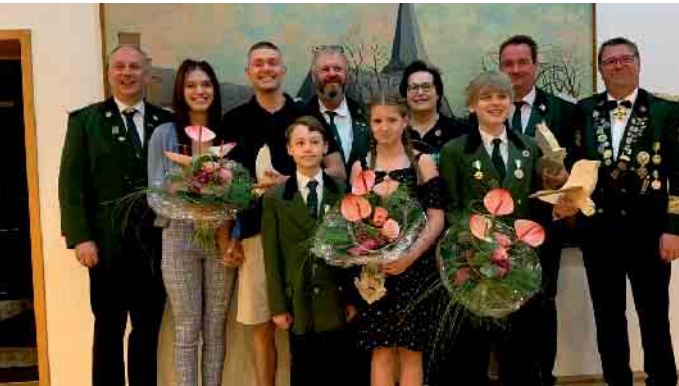
Gruppenbild aller neuen Heppendorfer Majestäten

Zu einem Liederabend mit Elvira Bill (Mezzosopran) und Christoph Schnackertz (Klavier) lädt die Evangelische Kirchengemeinde Horrem am Sonntag, 2. Juni, 18 Uhr, ein. In der Kreuzkirche Horrem, Mühlengraben 10-14, möchten die beiden Musizierenden das irdische Dasein mit allem Leid und Leidenschaft, Sehnsucht und Gottvertrauen musikalisch abbilden. Unter dem Motto „Zwischen Himmel und Erde“ erklingen Werke von Komponisten und Dichtern der Romantik, deren Namen auch im Evangelischen Gesangbuch zu finden sind. In diesem Jahr findet das Jubiläum „500 Jahre Evangelisches Gesangbuch“ statt. Der Eintritt ist frei, Spenden sind erbeten. www.kirche-horrem.de