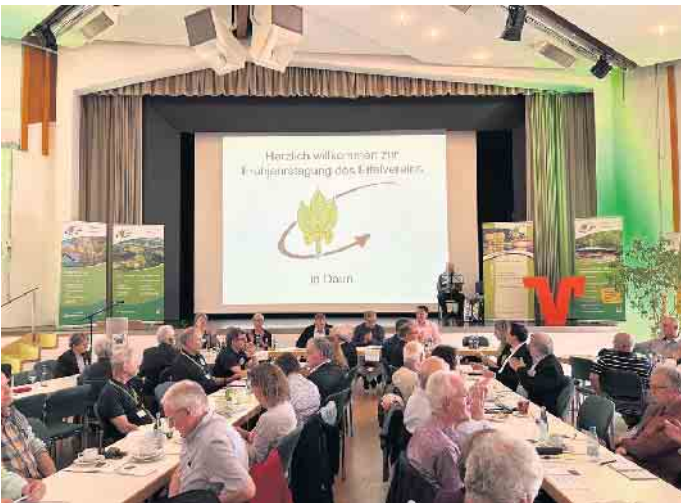
Das Forum Daun war gut gefüllt