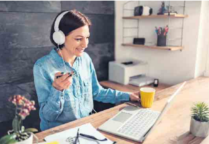
Online-Coaching ist spätestens seit der Pandemie zu einer beliebten Form des Austauschs geworden.

gibt. Das Ziel ist, dass man sich diese Antworten im Verlauf des Coachings selbst erarbeitet.“ Gruppencoaching: Austausch mit Gleichgesinnten kann hilfreich sein