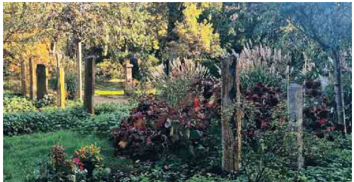
Friedhöfe als grüne Oasen in der Stadt - Gemeinschaftsgrabanlage Nordfriedhof Düsseldorf.

Friedhof der Zukunft Auch Friedhöfe leisten einen Beitrag zum Klimaschutz und zum Erhalt der Artenvielfalt. Sie sind grüne Oasen und Rückzugsorte in unseren Städten und werden zunehmend als ökologische Nischen anerkannt, in denen eine Vielzahl von Tier- und Pflanzenarten beheimatet ist. Der Wandel in der Friedhofskultur führt dazu, dass Friedhofsträger bewusst Aspekte des Klima- und Umweltschutzes in ihre landschaftlichen und gestalterischen Planungen einbeziehen. So entstehen auf Friedhöfen beispielsweise Insektenweiden, Areale mit Bienenstöcken oder naturbelassene Flächen, die den parkähnlichen Charakter mancher Friedhöfe noch stärker betonen. (akz-o)