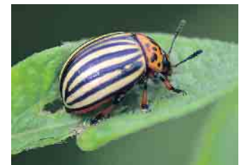
Nicht nur an Kartoffelpflanzen richtet der nach ihnen benannte Käfer Schaden an.

Wiesenschnake: Die wie übergroße Mücken wirkenden Insekten sind harmlos. Schaden richten ihre Larven an, die unter der Grasnarbe leben und durch ihren Fraß braune Stellen im Rasen verursachen. Wer die Fläche vertikutiert,