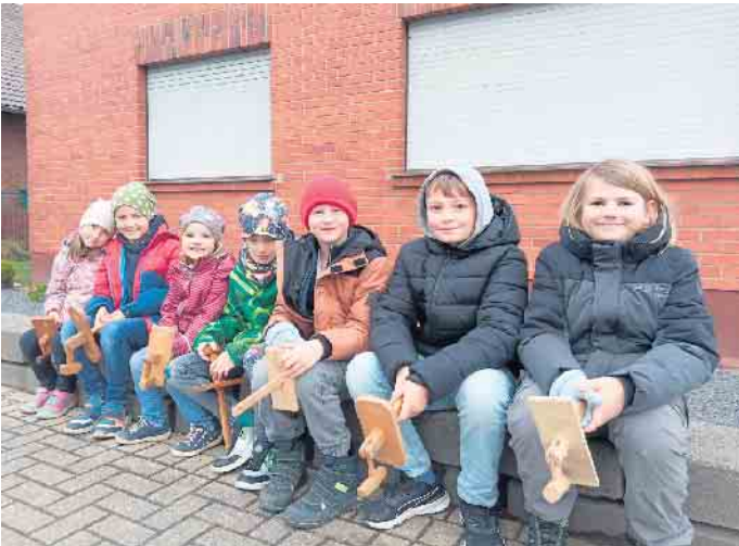
Die Irresheimer Klapper-Kinder 2025

Irresheimer Kinder ziehen beim Karfreitag-Klappern durch den Ort