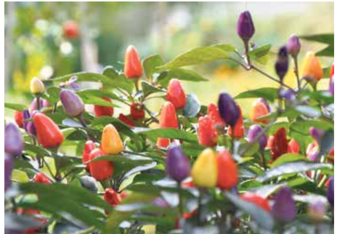
Wer einen so reichen Fruchtansatz möchte, sollte wärmebedürftige Arten wie Chili, Tomaten und Paprika nicht vor den Eiseiligen auspflanzen.

Ab dem 16. Mai können empfindliche Pflanzen in vielen Gärten dauerhaft ins Freie im Beet ebenso wie auf Balkon und Terrasse.