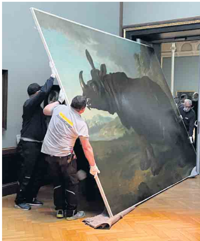
Das Gemälde von Nashorn Clara hängt üblicherweise im Staatlichen Museum Schwerin. Da das Haus wegen Renovierungsarbeiten für drei Jahre geschlossen ist, ging Clara mit großem Aufwand auf Reisen - unter anderem ins berühmte Rijksmuseum nach Amsterdam.