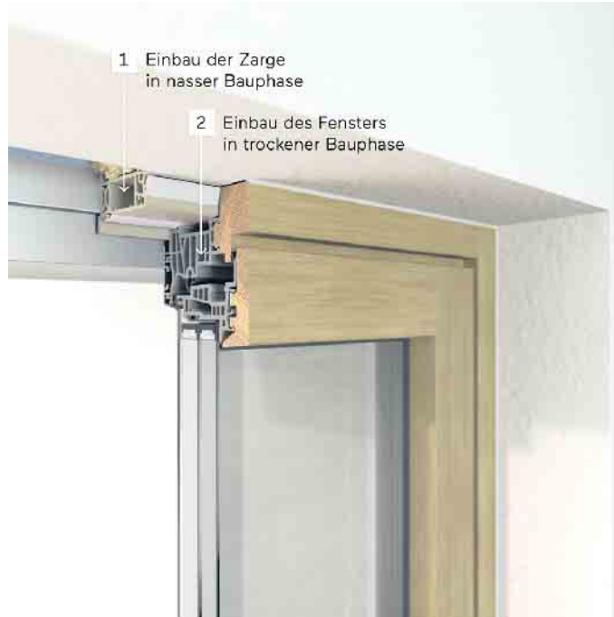
Ein zweistufiger Fenstereinstbau mit Einbaurahmen bietet viele Vorteile.