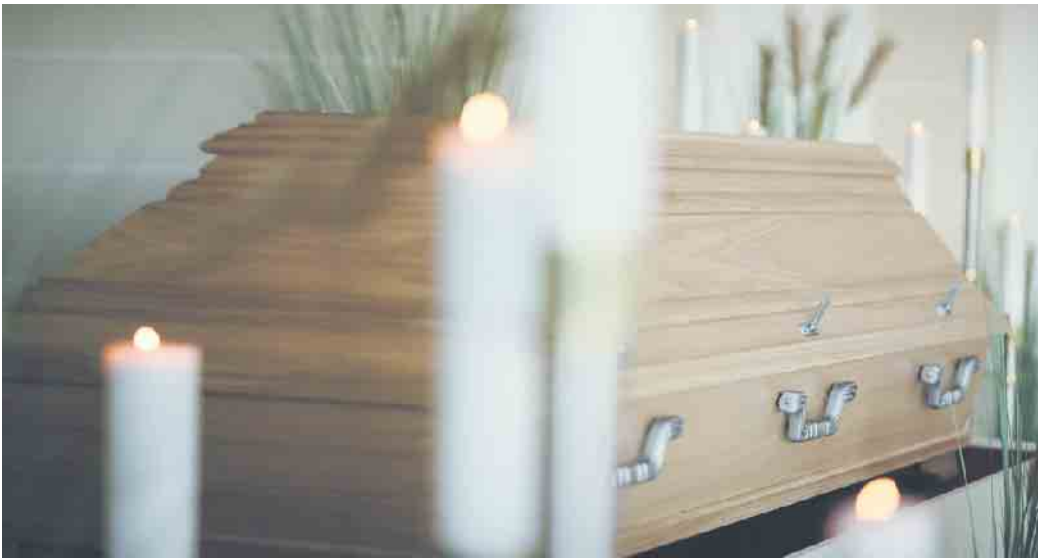
Für sehr große und sehr schwere Menschen gibt es maßangefertigte Särge.

Es empfiehlt sich, sich frühzeitig beraten zu lassen, entweder bei einem Bestatter im Institut oder bei einem Hausbesuch ( www.bestatter.de ). Was viele Vorsorgenden nicht wissen, für eine wirklich sichere Bestattungsvorsorge - auch im zukünftigen