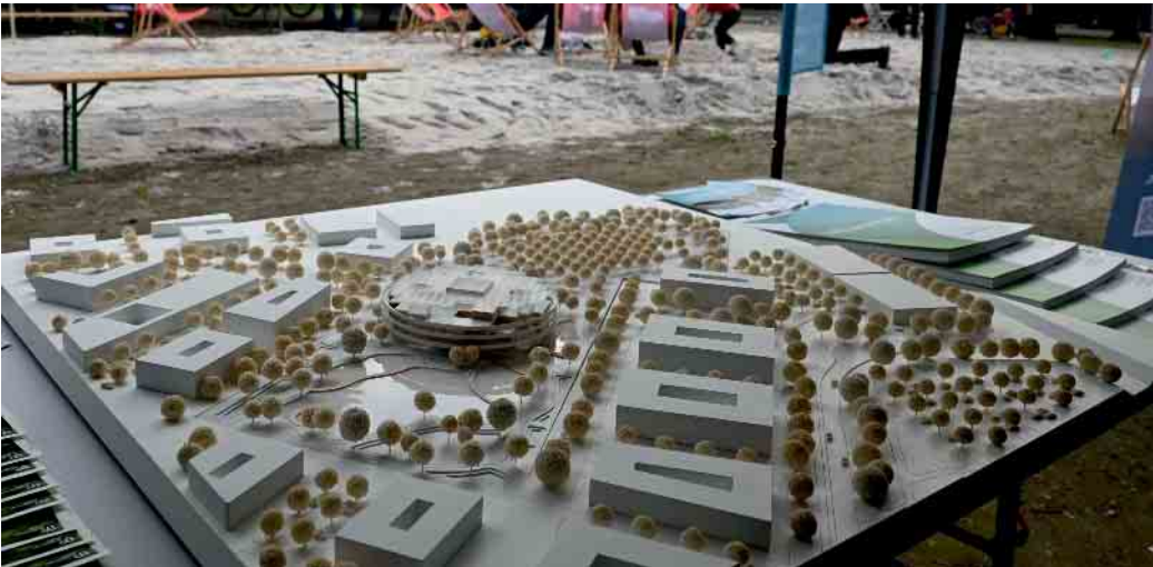
Neben der Stadt sind auch viele andere Akteure vor Ort und präsentieren ihre Planungen.

Der Städtebau, Bildung und Wissenschaft, Forschung und Entwicklung sowie Tagebaumfeld-Initiativen informieren über die Zukunft Jülichs und der Region. Die Stadt Jülich lädt am Samstag, 4. Mai, von 10 bis 16 Uhr auf dem Schlossplatz zu einem Event der besonderen Art ein. Mit Aktionen für die ganze Familie gibt es die Chance, die Pläne zur zukünftigen Entwicklung der Stadt, dem Umland und darüber hinaus greifbar aufbereitet zu erleben. Für alle Interessierten wurde ein attraktives Rahmenprogramm vorbereitet. Auch in diesem Jahr wird wieder ein Sandkasten für die Kleinsten zur Verfügung stehen. Wer hoch hinaus will, für den steht ein Fesselballon an einem Kran bereit, der bis über die Baumwipfel gezogen wird. Alle Altersgruppen sind dazu eingeladen, sich an den ringsherum aufgebauten Ständen über die geplanten Projekte zu informieren. Integriert in den Zukunftstag ist der Tag der Städtebauförderung. Hier erwarten die Besucherinnen und Besucher Informationen zum Integrierten Handlungskonzept (InHK) und den Maßnahmen rund um Marktplatz, Schlossplatz und Kölnstraße. Zudem stellt das Citymanagement seine Arbeit und dessen Förderprogramme vor. Die Jahrgangsstufe 5 des Mädchen-gymnasium Zitadelle widmet sich dem Thema Ladenleerstand und präsentieren ihre Ideen. Das Jugendparlament Jülich (JuPaJü) beteiligt sich mit einer Wand der Zukunft bei dem vor allem junge Menschen ihre Wünsche für Jülich einbringen können. Im ganzen Jülicher Stadtgebiet