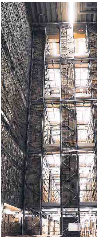
Erinnert an eine Kathedrale: Das riesige Archivdepot des Kunstlogistikers in Frechen bei Köln.

Im 18. Jahrhundert war sie auf Jahrmärkten, an Fürstenhöfen und auf Volksfesten in ganz Europa eine Sensation. Mit elf Jahren war sie dreieinhalb Meter lang, 1,70 Meter hoch und 2.500 Kilogramm schwer. Die Rede ist vom Nashorn Clara, dessen lebensgroßes Abbild von Jean-Baptiste Oudry üblicherweise im Staatlichen Museum Schwerin hängt. Wegen Renovierungsarbeiten ist das Museum seit 2021 für drei Jahre geschlossen - und Clara ging auf Reisen. Zunächst in ein Depot nach Hamburg und im Sommer 2022 als Mittelpunkt einer Ausstellung ins weltberühmte Rijksmuseum nach Amsterdam, in dem derzeit die große Vermeer-Ausstellung zu sehen ist. Für Transporte wie von dem Gemälde von Clara sind Logistiker zuständig, die sich auf das Bewegen kostbarer und sensibler Objekte spezialisiert haben. Aber selbst für sie war der Transport von Clara eine Herausforderung.