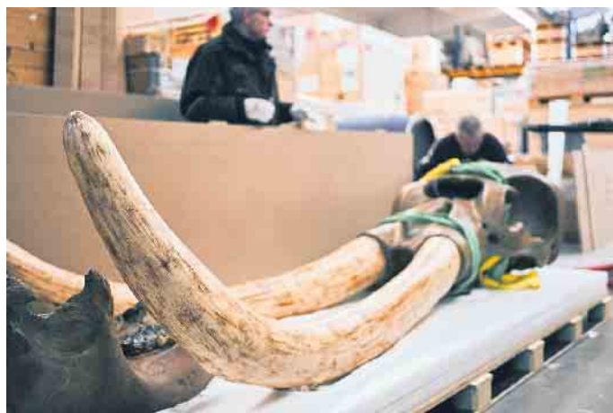
Das Amerikanische Mastodon war eine Art der Rüsseltiere aus der ausgestorbenen Gattung Mammut. Der Transport der kostbaren Zähne stellt auch für spezialisierte Kunstlogistiker eine Herausforderung dar.

Mitarbeiter m/w/d auf Minijob-Basis gesucht, gerne Frührentner. Gartengestaltung Schmitz Kreuzau, Tel.: 0176 - 96006954