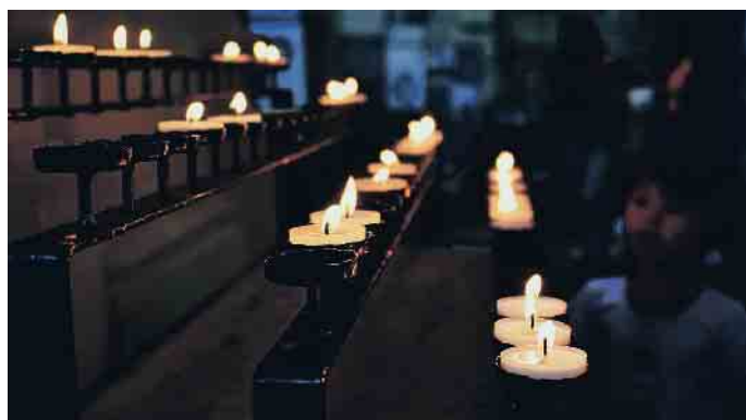
Sterben und Abschiednehmen gehören zum Leben dazu und jeder hat ein Recht auf seine persönlichen Trauerrituale.