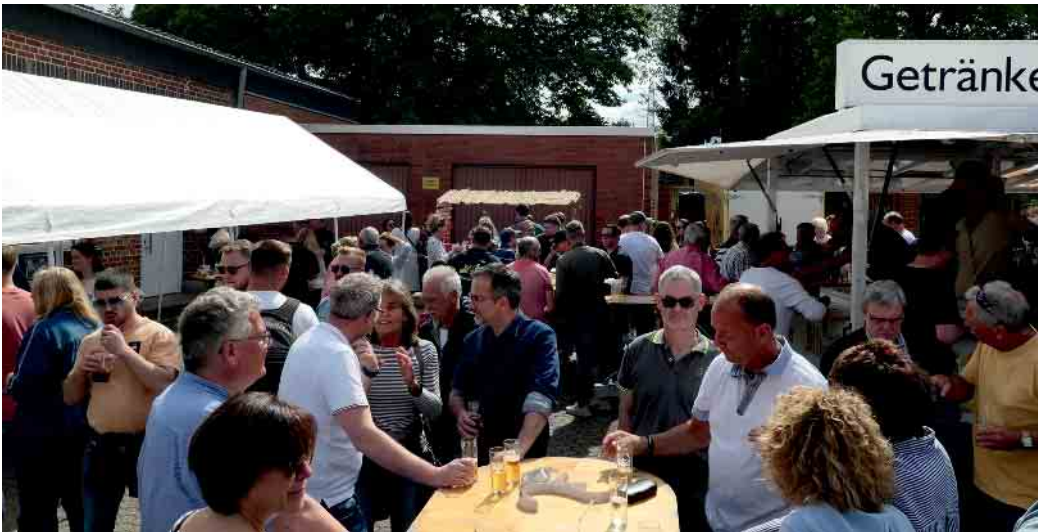
GKG Familienfest 2022

Jülich. Nach einem sensationell gut besuchten Re-Start im vergangenen Jahr lädt die GKG Fidele Brüder aus Koslar am Vatertag wieder alle Vatertagstourer nach Koslar ein. Bei freiem Eintritt feiert die GKG am 18. Mai ab 11 Uhr am gemütlich vor Sonne und Regen geschützten und mit Zelten, Pavillons und großen Schirmen ausgestatteten Kirchplatz in der Friedhofsstraße ihr bewährtes und immer sehr gut besuchtes Familienfest. Ein Besuch entweder direkt mit der ganzen Familie und Freunden, als Zwischenstopp der Fahrradtour oder auch mit dem Traktor und Anhänger lohnt sich, um bei musikalischer Begleitung mit kühlem Bier vom Fass, Cocktails, Softdrinks, Grillstand und Cafeteria gemeinsam zu feiern. Die Kinder erleben beim Kinderschminken, Minigolf und Hüpfburg einen erlebnis- und