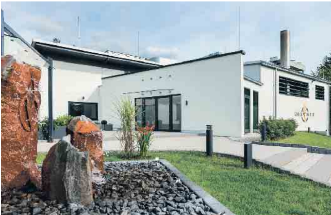
Feuerbestattung im Rhein-Taunus-Krematorium.