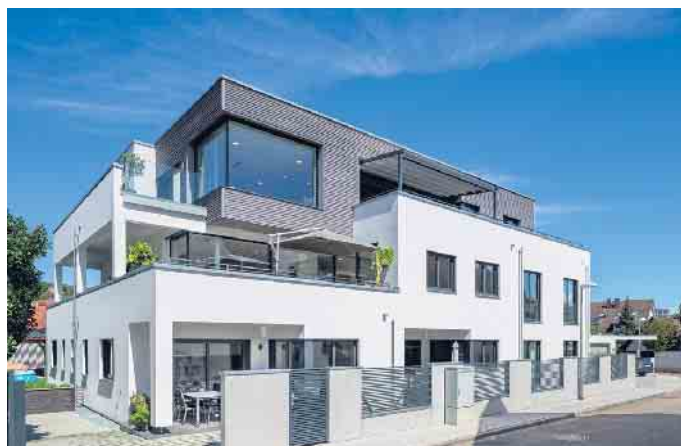
Mehrgenerationenhäuser in Holz-Fertigbauweise sind im Kommen.

Ein Mehrgenerationenhaus sei so eine Lösung für ein zukunftsicheres Eigenheim, dessen Bau- und Grundstückskosten auf mehreren Schultern verteilt werden können. Mitunter braucht es hierfür nicht einmal ein neues Baugrundstück und damit auch keinen ganz neuen Lebensmittelpunkt. Etwa wenn ein stark sanierungsbedürftiger, bereits in Familienbesitz befindlicher Altbau durch ein bedarfsgerechtes Mehrgenerationenhaus in nachhaltiger Holz-Fertigbauweise ersetzt wird. Auch Um- und Anbauten mit Fertigbauteilen oder ganzen Wohnmodulen aus Holz können je nach Bestandsgebäude Sinn machen, um ein Einfamilienhaus zu erweitern, das für die Großeltern zu groß geworden, aber für drei Generationen noch nicht groß genug ist. „Wichtig beim Mehrgenerationenwohnen ist auch, dass sich alle Parteien mal zurückziehen und gemütlich für sich sein können. Daher geht es nicht ohne individuelle Hausplanung, in die jede und jeder zukünftige Bewohner - von Oma und Opa bis zum Kleinkind und dem Haustier - einbezogen sein sollte“, so Tews. So gelingt der Hausbau planungssicher und generationengerecht