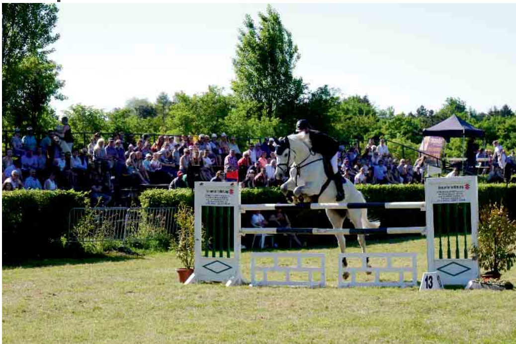
Viele Zuschauer lockt das traditionelle Jülicher Reitturnier jedes Jahr an die Rur

Ein breit gefächertes Programm für jung und alt bietet auch dieses Jahr das große Springturnier des Reit- und Fahrvereins Jan von Werth Jülich - und das nicht nur für die Teilnehmer. Es findet vom 12. bis 14. Mai auf dem Turnierplatz an der Rur statt. Schon seit Jahrzehnten ist das Jülicher Springturnier ein fester Bestandteil im Terminkalender der Stadt. Das ist auch kein Wunder, lockt es doch jährlich hunderte Besucher an die Rur. Auch ohne pferdesportlichen Hintergrund genießen viele Herzogstädter die Atmosphäre, die sportliche Spannung und das bei einem Stück Kuchen oder einem kühlen Getränk. So hofft der ortsansässige Reitverein auch an dem Wochenende vom 12. bis 14. Mai wieder auf großen Zulauf. Die Reitgemeinschaft ist auf jeden Fall schon voller Vorfreude auf das Rasenturnier. Das Programm ist für die zwei- und vierbeinigen Sportler wie immer breit gefächert. Der Freitagvormittag gehört ganz den jungen Pferden, die noch beweisen müssen, dass sie für den großen Springsport geeignet sind. Am Nachmittag gibt es dann mit einem L- und zwei M-Springen Prüfungen für fortgeschrittene Reiter. Der Samstag beginnt mit Einsteigerprüfungen der Klassen E und A. Anschließend folgt bereits eines der Höhepunkte des Turniers, die Mannschaftsprüfung der Klasse A**. In diesen