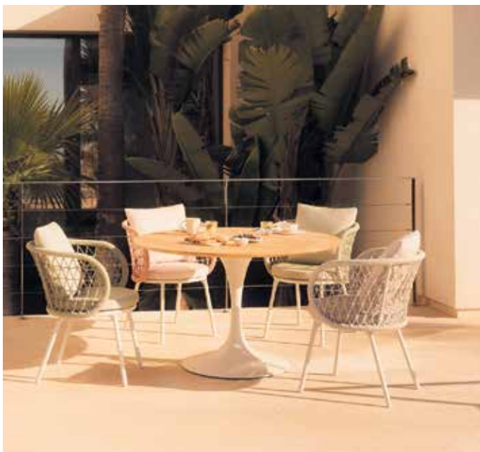
Sommerliches Flair: Der Säulentisch im Retrostil und die Aluminiumstühle mit den abgerundeten, kordelbespannten Lehnen bieten viel Komfort.