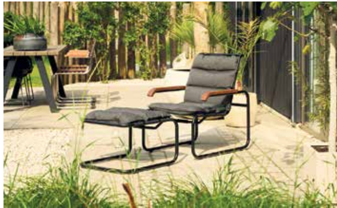
Freiluftvariante eines Klassikers: Der frei schwingende Stahlrohrsessel wird für zusätzlichen Komfort mit einem passenden Fußhocker ergänzt.

Outdoorküchen stehen für Geselligkeit und Genuss im Freien. Die einzelnen Module lassen sich individuell kombinieren und den jeweiligen Gegebenheiten anpassen. Zur Standardausstattung gehören meist ein Gas- oder Holzkohlegrill,