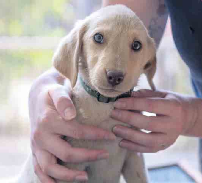
Hund mit Pflegerin.