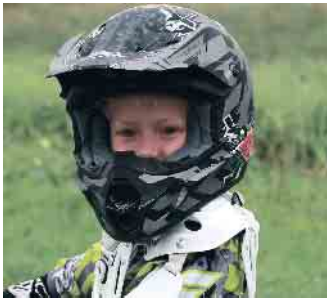
Wer leidenschaftlich gerne Motorrad fährt, steckt mit seiner Begeisterung oft auch den Nachwuchs an.

rem haben die Eltern dafür Sorge zu tragen, dass angemessene Schutzkleidung getragen wird. (mid/ak-o)