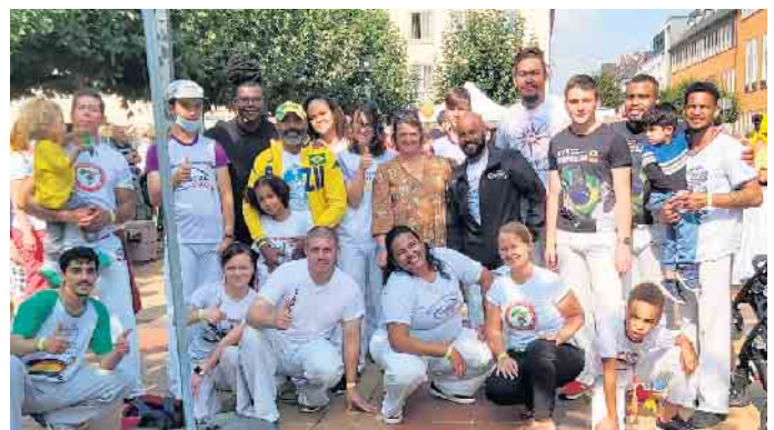
Die brasilianische Gruppe „Capoeira Siao“ aus Aachen sorgt immer für Freude beim Publikum des „Festes der Kulturen“.

nationalität und Vielfalt gelebt werden. Die Vielfalt der Kulturen Jülichs „mit allen Sinnen erfahren“, die Bereicherung durch diese Vielfalt erleben - das möchten die Organisatoren der Stadt Jülich mit dem Fest ermöglichen und den Bürgern nahebringen. Ab sofort können sich interessierte Migrantenselbstorganisationen, Kulturvereine und Einzelakteure zur Teilnahme anmelden. Alle Interessierten, die bei der Gestaltung des „8. Fest der Kulturen“ mitwirken möchten, sind herzlich eingeladen sich bis Ende