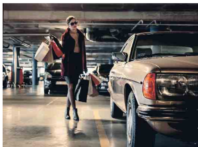
In Parkhäusern ist Vorsicht und gegenseitige Rücksichtnahme notwendig.

stählen oder Sachbeschädigungen werden. Einkaufstüten gehören in aus. Deshalb sollten Wertgegenstände nicht im Auto gelassen den Kofferraum, nicht auf die Rückbank. (mid/ak-o)