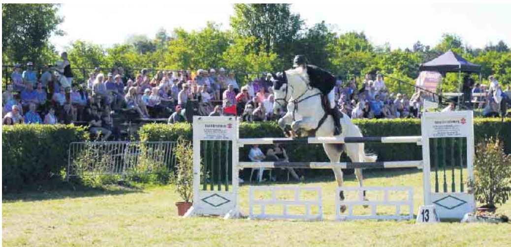
Viele Zuschauer lockt das traditionelle Jülicher Reitturnier jedes Jahr an die Rur

Das Programm ist für die zwei- und vierbeinigen Sportler wie immer breit gefächert. Der Freitagvormittag gehört ganz den jungen Pferden, die noch beweisen müssen, dass sie für den großen Spring-