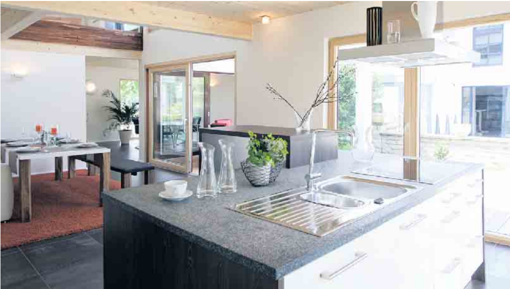
„Es ist sinnvoll, spätere Alltagsabläufe und Einrichtungsideen schon bei der Grundrissplanung vorzudenken.“

möglicherweise ein kombinierter Hauswirtschaftsraum.