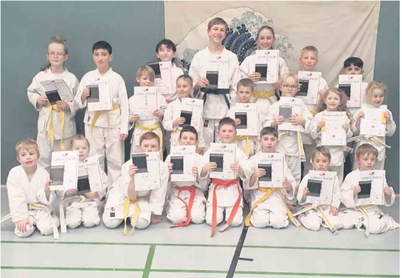
Die glücklichen Prüflinge der Karate Akademie Düren e.V. mit ihren neuen Gürteln und Urkunden

Am vergangenen Wochenende haben 24 Nachwuchskaratekas der Karate Akademie Düren e.V. erfolgreich ihre Prüfung im Deutschen Karate Verband abgelegt.