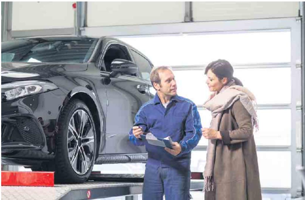
Auf der Hebebühne lassen sich die Spuren des Winters an Fahrgestell, Unterboden, Bremsen und Reifen genau unter die Lupe nehmen.

kann. Auf der Hebebühne erkennt der Fachmann sofort, wie der Wagen den Winter überstanden hat. Unterboden und Auspuff, Stoßdämpfer und Bremsen werden unter die Lupe genommen, auch den Zustand der Reifen kann man in luftiger Höhe optimal untersuchen.