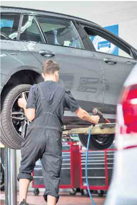
Wenn sowieso der Umstieg auf Sommerreifen ansteht, können Autobesitzer gleich einen Frühjahrs-Check in der Kfz-Werkstatt vereinbaren.

Um die Technik kümmert sich am besten die Kfz-Meisterwerkstatt im Rahmen eines Frühjahrs-Checks, den man zum Beispiel parallel zum anstehenden Umstieg auf Sommerreifen vereinbaren