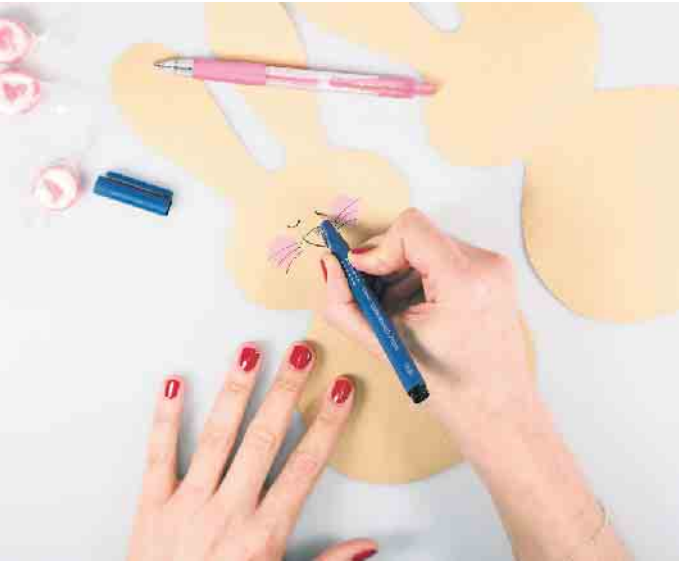
Ist der Osterhase ausgeschnitten, bekommt er ein hübsches Gesicht aufgemalt.