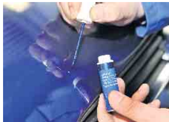
Kleine Steinschläge im Lack lassen sich per Smart-Repair unsichtbar machen.

verspricht hier ein Filtertausch oder eine gründliche Desinfektion der Lüftungskanäle. (djd)