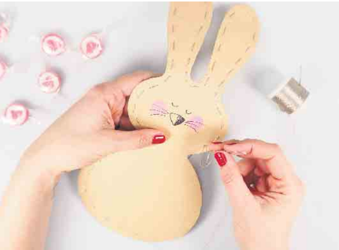
Mit einem Faden werden beide Hälften zusammengenäht. Kurz vor Schluss ein kleines Loch lassen, die kleinen Naschereien reinstecken und zunähen.