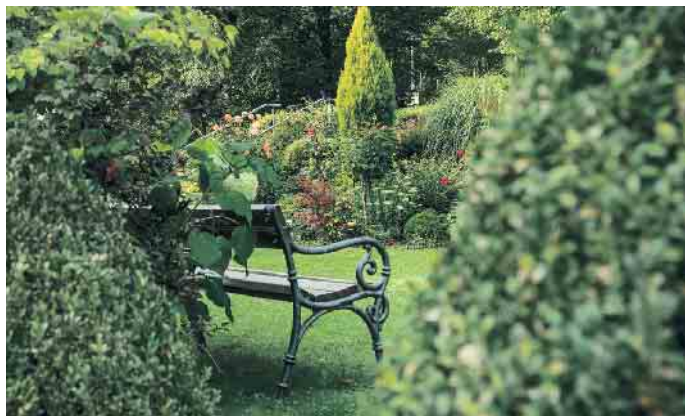
Rasengrab oder Bestattung im Blumengarten.

Urnenwand, Blumengarten oder klassische Beisetzung