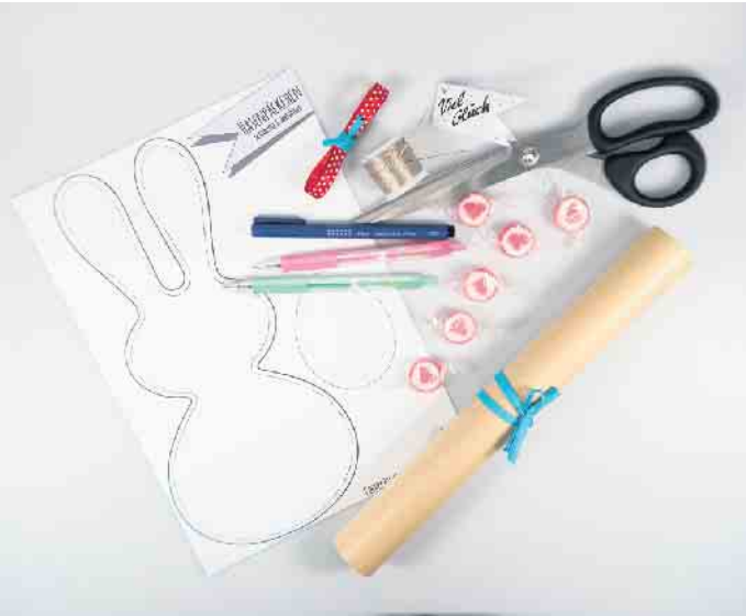
Das Material für die Osterhasentüten auf einen Blick.