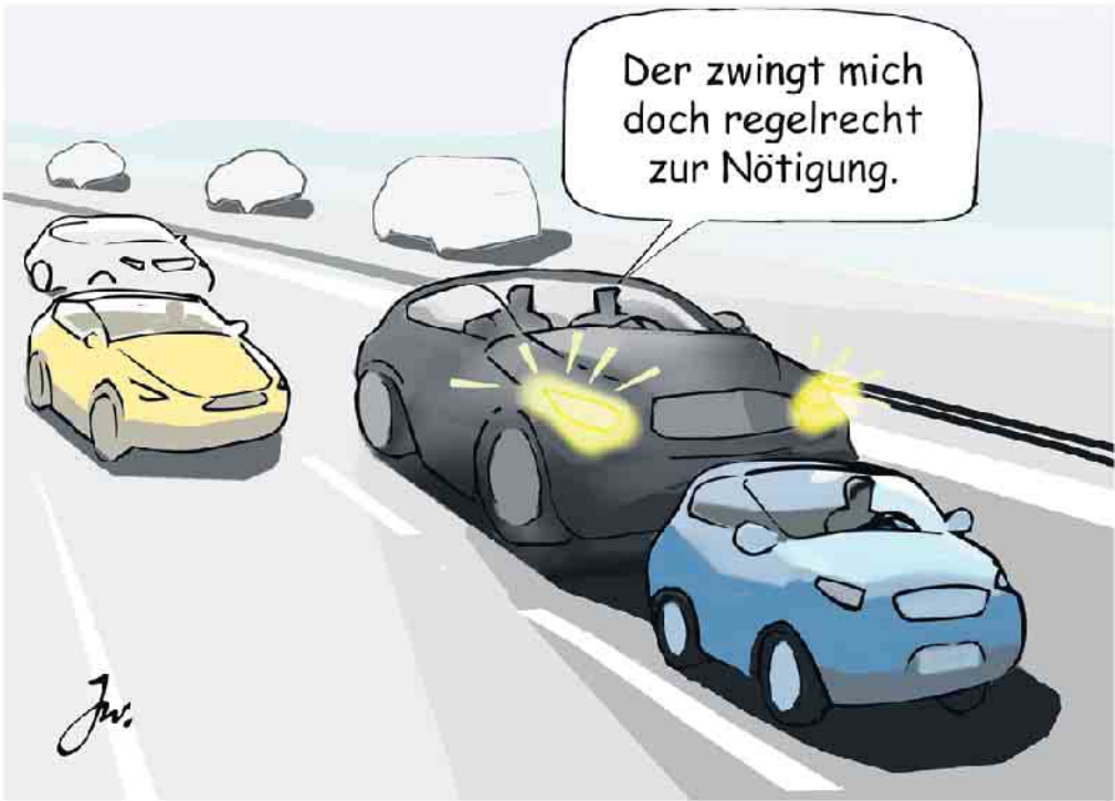
Falsche Reaktion auf Drängler: Demonstratives Langsamfahren auf dem linken Fahrstreifen trägt zur Eskalation bei.

Während die Zahl der Verkehrsunfälle mit Personenschäden laut Statistik weiter zurückgeht, nehmen Karambolagen aufgrund von zu dichtem Auffahren immer mehr zu. Drängeln ist neben überhöhter Geschwindigkeit eine der beiden häufigsten Unfallursachen. Wenn es auf Deutschlands Autobahnen zum Crash kommt, sind in der Regel Rasen oder Drängeln oder beides in Kombination im Spiel, wie Polizei und Verkehrssicherheitsexperten berichten. Wer es mit solch einem Drängler zu tun hat, kann dabei schnell selbst in Hektik oder in Wut geraten. Beides ist die denkbar schlechteste Reaktion. Stattdessen muss die Devise lauten: Immer ruhig bleiben. Denn Ärger oder Wut haben auf der Autobahn, aber auch im Straßenverkehr generell nichts zu suchen, weil diese Emotionen zu den falschen Aktionen und Reaktionen verleiten. Wenn man sich durch einen Drängler unter Druck gesetzt fühlt, sollte man nicht hartnäckig auf seinem Recht bestehen, sondern dem nervenden Zeitgenossen möglichst schnell das Überholen ermöglichen - ohne Hektik und ohne andere Autofahrer in Bedrängnis zu bringen. Ebenso gilt es zu vermeiden, die Bedrängnis, in die man durch den aufdringlichen Hintermann gebracht wird, an das vorausfahrende Fahrzeug weiterzugeben, indem man sich diesem zu sehr nähert. Denn daraus können unliebsame Kettenreaktionen resultieren. Zur Vermeidung solcher Situationen ist es ebenfalls ratsam, bei einem eigenen Überholvorgang immer wieder - alle fünf bis zehn Sekunden raten die Fachleute - zu kontrollieren,