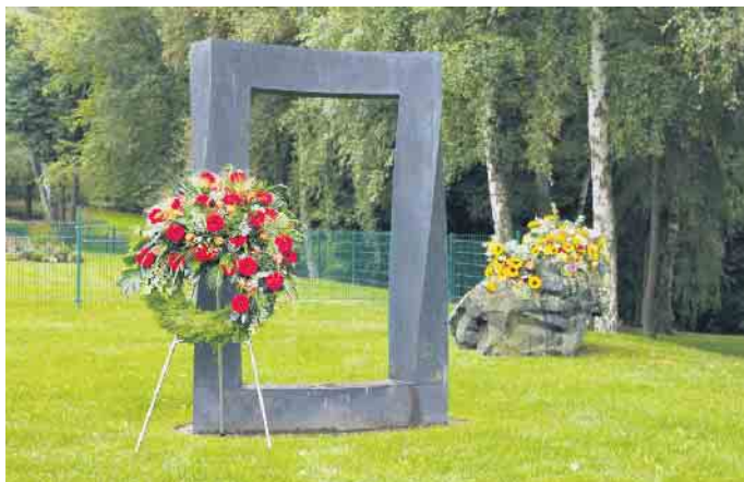
Tor zwischen den Welten.