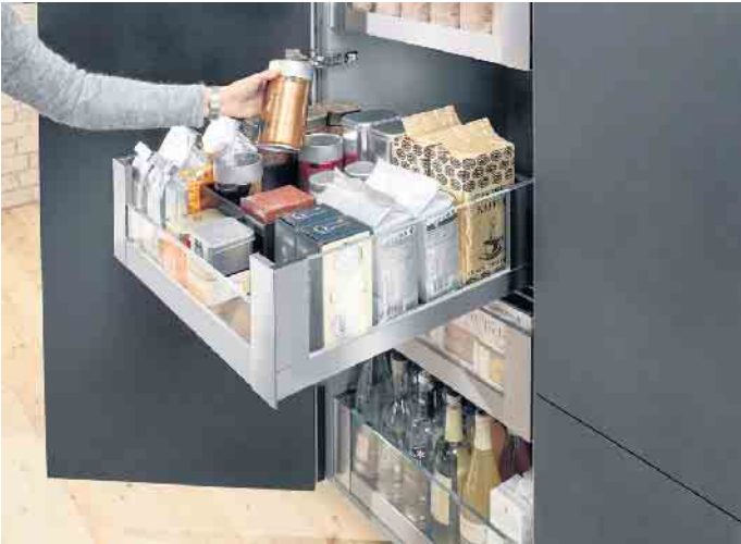
Glas spielt auch bei der Innenausstattung eine wichtige Rolle wie z. B. bei diesem Vorratsschrank, in dem sich viel übersichtlich verstaut lässt. In Auszügen mit Glaseinschubelementen sind die Inhalte schnell identifiziert. (Fo-to: AMK)

mit besonderer Tiefenwirkung. Oder als satinierte Arbeitsflächen, die sich samtweich anfühlen und jeden Tag besondere haptische Erlebnisse schenken. „Glas hat darüber hinaus viele weitere glanzvolle Auftritte“, sagt Volker Irlle. Und das gelte in Lifestyle-Wohnküchen jeglicher Stilrichtung - von modern-minimalistisch über klassisch und nostalgisch bis hin zum rauen Factory Charme bzw. zu Küchen im Industriestil. Beispielsweise in Form hochwertiger Echtglasfronten in der Küche, lackiert oder bedruckt. Vielleicht eher dezent als attraktive Glaseinleger in edlen Holz- und Lack-Fronten. Ein Blickfang der besonderen Art sind illuminierte Vitrinenschränke sowie freistehende Vitrinen-Side-/Highboards, die auch gerne als Raumteiler eingesetzt werden, um elegante, semitransparente Übergänge zwischen dem Koch-, Ess- und Wohnbereich zu gestalten. Das gilt übrigens auch für indirekt beleuchtete Glasregale, auf denen ausgesuchte Wohnaccessoires und Deko-Artikel in den Fokus gerückt werden. Hingucker sind auch Oberschränke, die anstelle von Unterböden mit indirekt strahlenden Lichtböden ausgestattet sind. Das raffinierte Lichtspiel, das sich dadurch an den Wänden und auf den darunter liegenden Arbeitsflächen ergibt, zieht sofort Aufmerksamkeit auf sich. Viel Glas findet sich auch bei den Einbaugeräten. Vom Kochfeld,