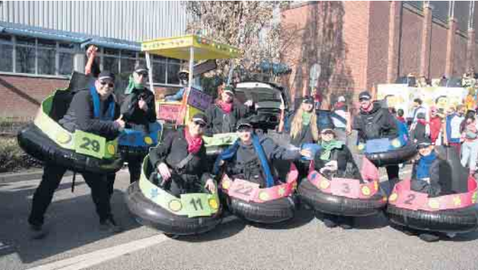
Als Autoscooter fuhren die „Jecken Knallköpp“ durch Elsdorf

Die Gesichter der Jecken strahlten am Karnevalssonntag in Elsdorf mit der Sonne um die Wette und ihre Sorgen um Regenwetter lösten sich beim Anblick des strahlend blauen Himmels auf wie Zuckerwürfel im heißen Tee. Entsprechend gut gelaunt stellten sich gegen 13 Uhr