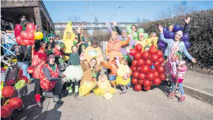
Süß und bunt: Die Jecke Früchtchen waren eine Augenweide

insgesamt zirka 800 Zugteilnehmer zum Zuckerwürfelzug auf. 16 Großwagen und viele weitere kleinere, teils handgezogene Wagen reihten sich ein, Einzelpersonen und Fußtruppen. Manche Gruppen waren schon seit Jahren und Jahrzehnten, andere erst zum ersten oder zwei-