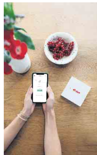
Mehr Transparenz über die eigene Stromerzeugung und den Verbrauch: Moderne Technologie macht es möglich.

gaben entscheidet das System dann selbst, welche Stromquelle bevorzugt genutzt werden soll. Weil alles klug aufeinander abgestimmt wird, steigt das Sparpotenzial mit jeder Energielösung, die verknüpft wird. (DJD)