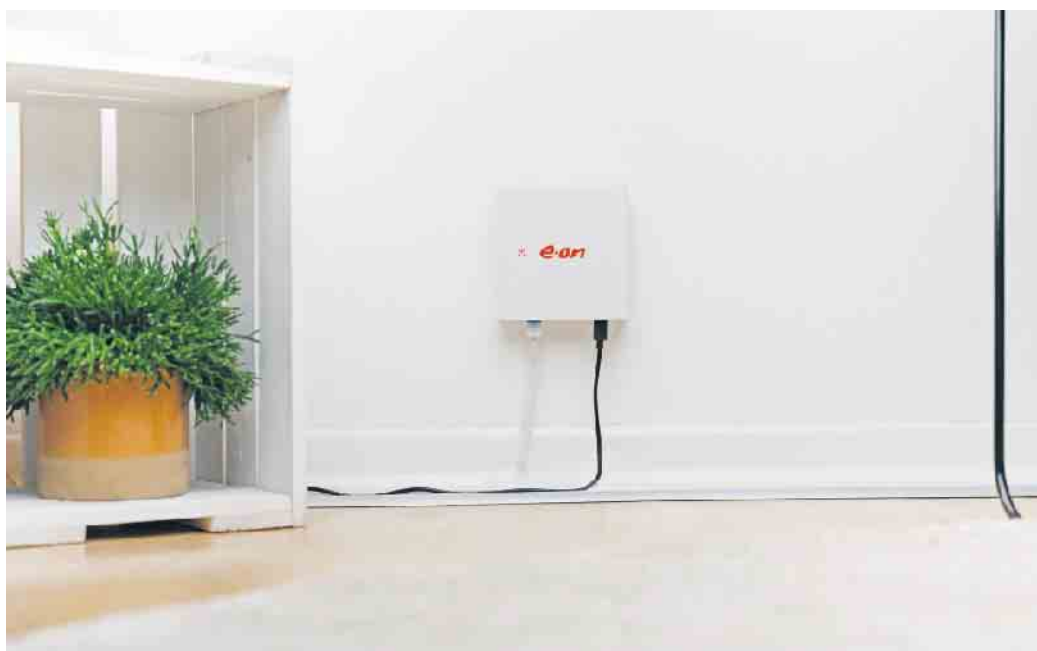
Die kompakte Box dient als Steuerzentrale und verknüpft bestehende Energielösungen wie Photovoltaik, Batteriespeicher oder Wärmepumpe zu einem effizienten System.