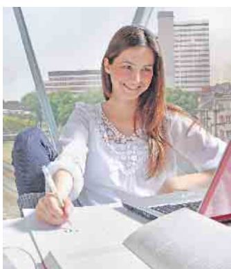
Effektiver Lärmschutz kann zu einer besseren Konzentration im Homeoffice beitragen.

Um Lärm wirksam abzuhalten, sind dazu Schallschutzfolien in die Mehrfachverglasung integriert. „Zusätzlich ist es möglich, dies mit Sicherheitseigenschaften zu kombinieren und somit auch den Einbruchschutz zu verbessern“, erklärt Stefan Wolter weiter. Erfahrene Fachhandwerker können individuell zu den verschiedenen Möglichkeiten für Neubau oder Modernisierung beraten, unter www.uniglas.de gibt es mehr Informationen und eine Kontaktmöglichkeit. Doch nicht nur für Wohnräume oder das Schlafzimmer sind Schallschutzfenster gefragt: Häufig werden die schallschluckenden Spezialfolien auch im Überkopfbereich genutzt. Auf diese Weise können zum Beispiel bei Wintergärten oder Glasvordächern nervige Geräusche von Regentropfen auf dem Glas stark abgemildert werden. (DJD)