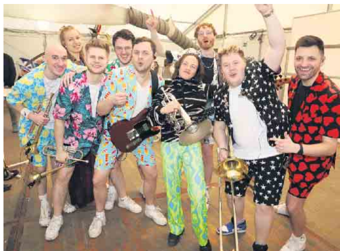
Mit „Druckluft“ hatte die Merzenicher Damensitzung einen guten Fang gemacht