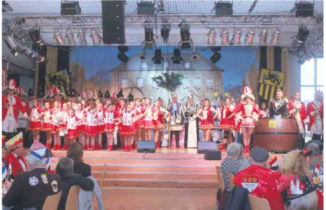
Gleich nach dem Einzug bot sich den Senioren ein buntes Bild auf der Bühne