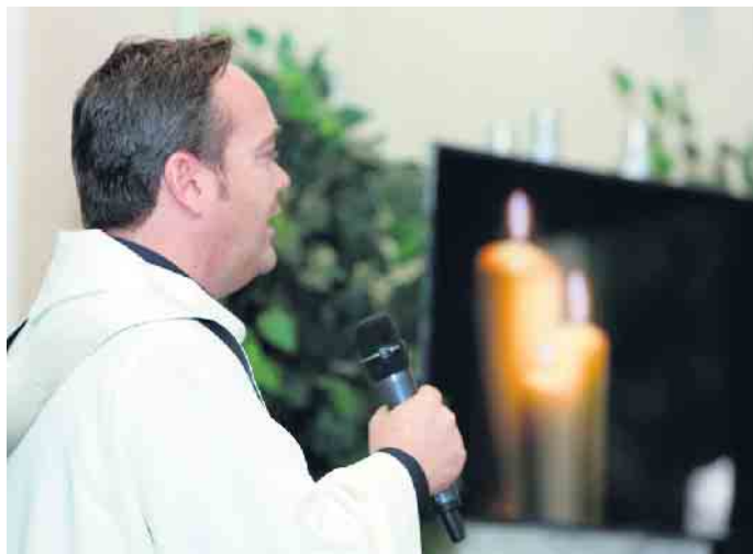
Gemeinsam Abschied nehmen.