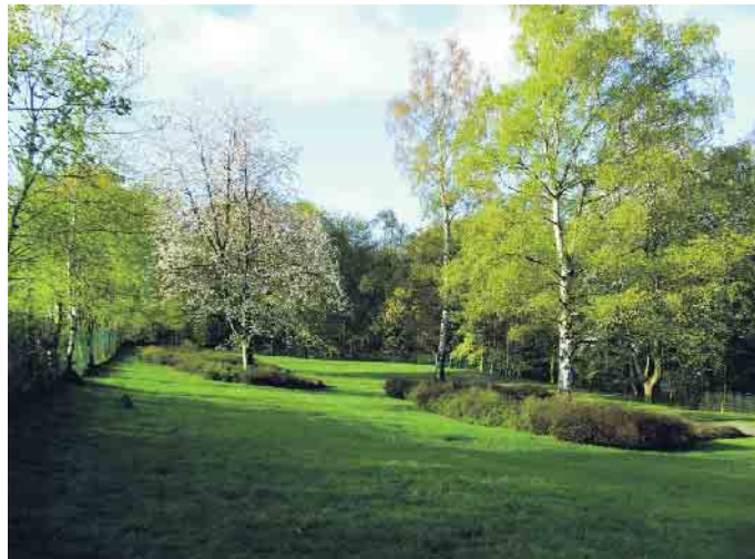
Beisetzung im Rasengrab.

Die Zahl derer, die im Alter jeden Cent zweimal umdrehen müssen, steigt inzwischen wieder an. Da ist es nicht verwunderlich, dass auch bei der Finanzierung der eigenen Beerdigung Geld zunehmend eine Rolle spielt. Es ist gerade für finanziell schwächer gestellte Angehörige besonders wichtig, sich frühzeitig einen Überblick über alle Kosten einer Beerdigung zu verschaffen, um nicht später in eine finanzielle Notlage zu geraten. Schon beim „Grab-Kauf“, genauer gesagt dem Erwerb des zeitlich begrenzten Nutzungsrechtes fallen manchmal Kosten an, an die die Angehörigen gar nicht denken. So wird bereits mit der Wahl des Friedhofs über die wichtigste Kostenposition entschieden. Die Friedhofsgebühren, die die Gemeinden festlegen und bei denen es keine Quersubventionen gibt, steigen seit Jahren. Erhöhungen von mehr als 400 Prozent sind keine Seltenheit. Die Kosten sind regional aber sehr verschieden. Nach Einschätzung von Karl-Heinz Könsen, Geschäftsführer der Deutschen Friedhofsgesellschaft, haben nahezu alle Kommunen erhebliche Probleme, Friedhöfe zu betreiben: „Vierorts wurden die Friedhofsgebühren derart massiv erhöht, dass Menschen auf überregionale Friedhöfe ausweichen.“ Vergleichen lohnt sich Manchmal ist ein Grab im nächsten Ort bereits mehrere hundert