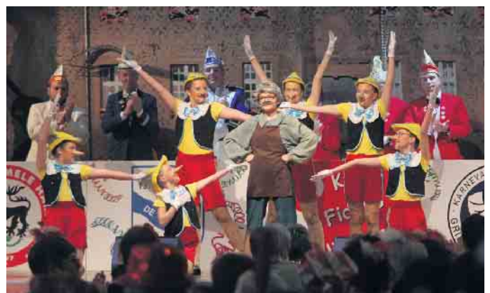
Der Tanz-Junioren-Schautanz der TSG mit prachtvollen Kostümen