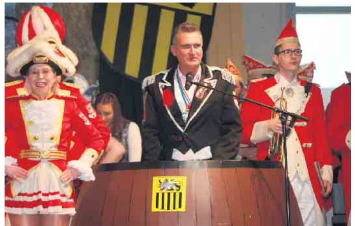
Bürgermeister Frank Rombey hieß die Anwesenden auf das Herzlichste willkommen

Alle freuten sich auf einen abwechslungsreichen, karnevalistischen Nachmittag und selbstverständlich auch auf kühle Getränke und herzhaftes Brötchen zu sehr zivilen Preisen - wie es sich gehört. FH