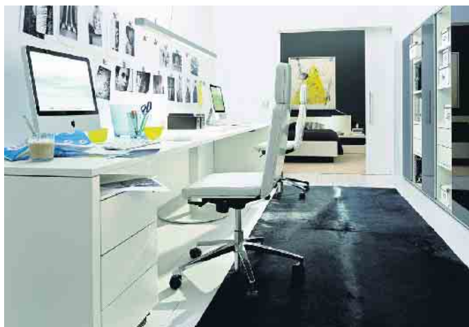
Rückenfreundliches Arbeiten bringt im Homeoffice und im Büro mehrere Anforderungen bei der Möbelauswahl mit sich.

Der Schreibtisch sollte eine Größe von etwa 160 x 80 Zentimeter besitzen und im Idealfall hell und matt sein, da starke farbliche Kontraste und spiegelnder Glanz die Augen schneller ermüden. Gegen Ermüdung hilft außerdem ein Arbeitsplatz mit viel Tageslicht, sowie mit ausreichend künstlicher Beleuchtung für die dunkleren Tages- und Jahreszeiten. Der Computerbildschirm sollte 50 bis 70 Zentimeter Abstand zu den Augen haben und leicht erhöht stehen. „Eine lineare Anordnung von Bildschirm, Maus und Tastatur mit dem Schreibtischstuhl verhindert Verspannungen im Kopf- und Nackenbereich und beugt damit ebenfalls Rückenschmerzen vor“, so Winning. Der DGM-Geschäftsführer betont, dass ergonomisches Arbeiten nicht nur für Erwachsene Bedeutung hat, sondern ganz besonders auch für Kinder im Wachstum, deren Wirbelsäule sich noch entwickelt und empfindlich ist. Entsprechend wichtig seien ergonomische Gesichtspunkte auch bei der Auswahl der