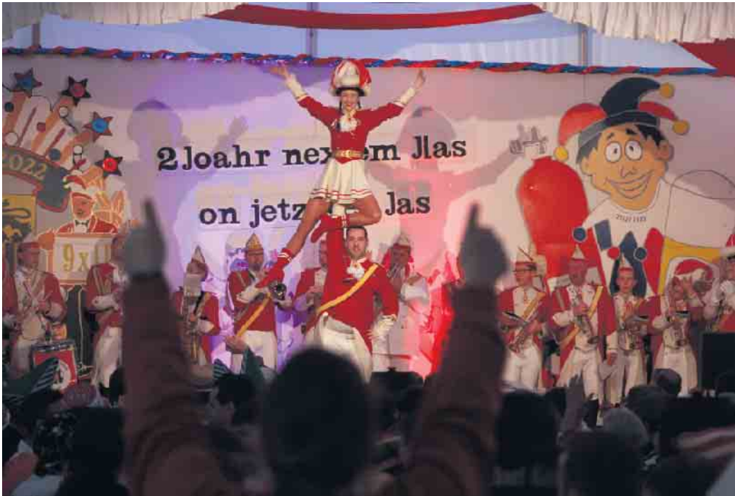
Gleich nach dem Einmarsch bot sich auf der Bühne mit der „Prinzengarde Zülrich 1910 e.V.“ ein imposantes Bild