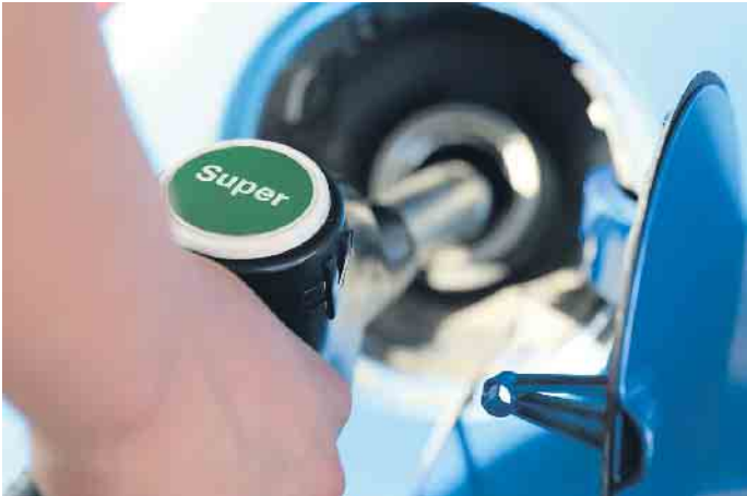
Nicht immer super: Benzin kann im Dieselfahrzeug erhebliche Schäden anrichten.

Verbrennung kann zu Motordefekten führen, auch Katalysator oder die Lambdasonde können Schäden davontragen. Rasches Handeln hilft: Nach dem Absaugen des Diesels und dem Einfüllen von Benzin sollte der Motor wieder anspringen und nach kurzer Zeit wieder laufen wie gewohnt. Viel kritischer für die Technik ist das Befüllen eines Diesel-Pkw mit Benzin. Leider kommt das viel öfter vor als umgekehrt. Der Grund ist einfach: Die Benzin-Zapfpistole hat einen kleinen Durchmesser und passt locker in den Einfüllstutzen eines Dieselfahrzeugs. Wenn Benzin in die Dieselleitungen oder gar bis zur Hochdruckeinspritzpumpe gerät, drohen Schäden am Treibstoffsystem. Vorsicht: Bei vielen modernen Autos springt die Kraftstoffpumpe schon nach dem Öffnen der Fahrertür an, um ein schnelles Starten zu erleichtern. Von außen betrachtet ist nicht viel geschehen. Doch Benzin im Dieselsystem zerstört den Schmierfilm, der die Einspritzpumpe schützt und kühlt.