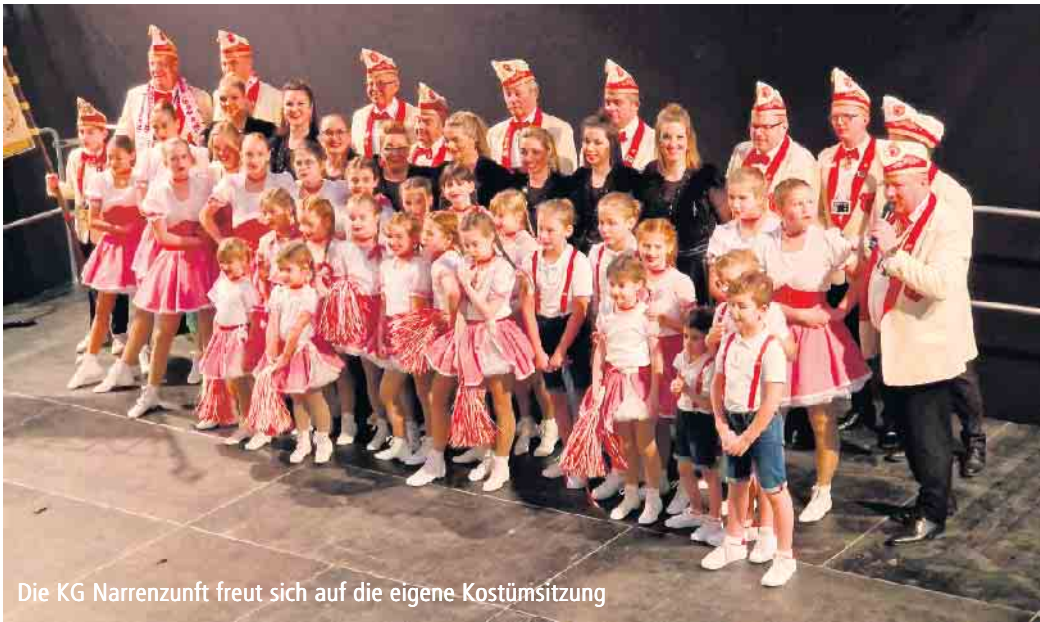
Die KG Narrenzunft freut sich auf die eigene Kostümsitzung