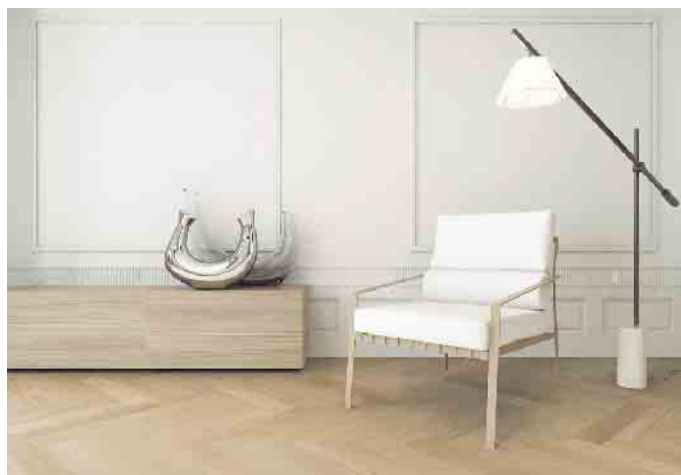
Beim feuchten Wischen gilt es, immer ein zur Oberfläche passendes Reinigungsmittel zu verwenden.

Bei noch unbehandelten Böden kann zwischen einem atmungsaktiven Finish mit Öl oder einem langfristig versiegelnden Lack entschieden wer-