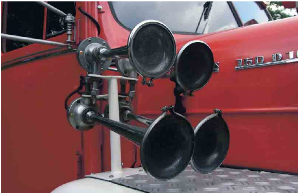
In Deutschland sind kreative Installationen von Schallerzeugern am Privatfahrzeug verboten.

Die Weltgesundheitsorganisation WHO und das Umweltbundesamt sehen die Zielwerte für die Lärmbekämpfung bei 65 Dezibel tagsüber und bei 55 Dezibel nachts. Grundsätzlich ist Hupen laut Paragraphen 16 der Straßenverkehrsordnung (StVO) innerorts nicht erlaubt, außer es besteht eine berechtigte Gefahrenlage, die einen Unfall nach sich ziehen könnte. Dies gilt auch außerorts - mit einer weiteren Ausnahme: Der nachfolgende Verkehrsteilnehmende möchte überholen und zeigt dies durch ein Hupsignal an. Die verschlafene Grünphase hingegen zählt als Verkehrsverzögerung und rechtfertigt keine Betätigung der Hupe. Wer nun zur Lichthupe greift, verhält sich ebenfalls ordnungswidrig. Stattdessen könnte versucht werden, mit Hilfe von Winken auf die grüne Ampel hinzuweisen. Wer unerlaubt ein Schallzeichen abgibt, muss mit einem Bußgeld in Höhe von fünf Euro rechnen, werden zusätzlich andere dadurch belastigt, sind zehn Euro fällig. Fühlt sich jemand durch das Hupen genötigt, kann der oder die Belästigte eine Anzeige stellen. Wer zu oft wegen