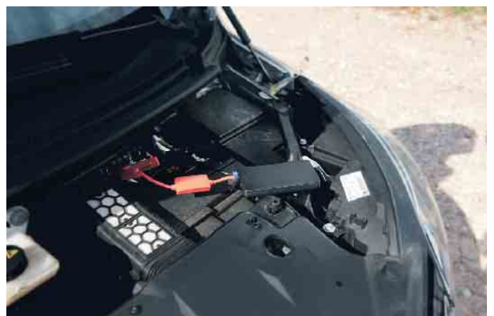
Akku-Booster in Aktion: Rote Polklemme an Plus, schwarze Polklemme an Minus, dann fließt der Strom.

rie des Autos angeschlossen werden, heißt es beim Automobilclub ACE. Dazu die rote Polklemme an Plus anklemmen, die schwarze Polklemme an Minus und prüfen, ob die Klemmen richtig sitzen. Fünf Minuten warten und den Motor starten. Sobald der Motor läuft, den Booster so schnell wie möglich abklemmen. Das Starthilfegerät sollte unbedingt