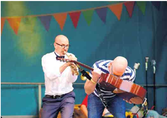
„ICH & HERR MEYER“ live