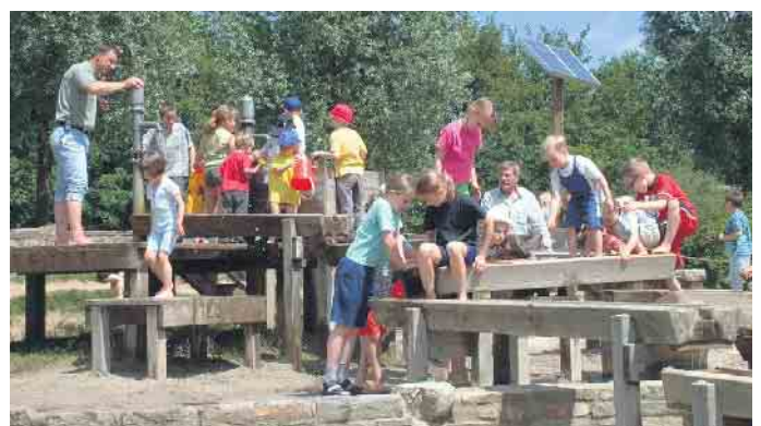
Die Anmeldungen starten am 1. Februar.

Wer keine Möglichkeit zum Drucken hat, kann einen Flyer per E-Mail oder telefonisch unter 02461/62411 anfordern. Für Berechtigte gibt es die Möglichkeit, den Beitrag über das Bildungs- und Teilhabepaket abzurechnen. Fragen werden gerne beantwortet.