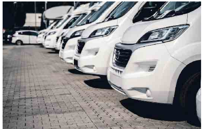
Wohnwagen sind aktuell sehr beliebt.

Unabhängig vom Fahrzeugtyp sollten Mietinteressenten genug Zeit für ihren Urlaub einplanen. Denn unter einer Woche vermieten die wenigsten Händler ihre Fahrzeuge. Das hat aber einen guten Grund, über den sich Kunden freuen können: In den vergangenen zwei Jahren sind die Hygienestandards nochmal ge-