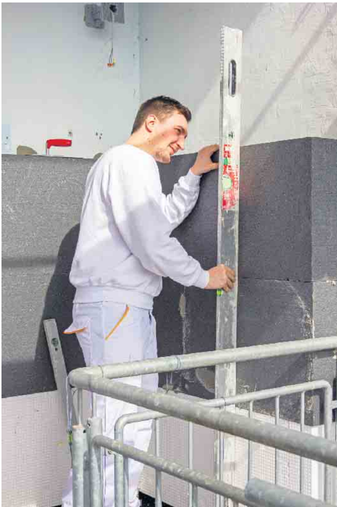
Die Ausführung durch einen erfahrenen Fachbetrieb sorgt für Langlebigkeit und Wirksamkeit der Dämmung.

sich etwa bei expandiertem Polystyrol (EPS) eine hohe Dämmleistung mit Langlebigkeit und einfacher Verarbeitbarkeit. Das Material bewährt sich seit Langem an zahlreichen Gebäudefassaden, ist sicher und lässt sich dank neuester Technik nach Jahrzehnten der Nutzung anschließend auch recyceln. Unter www.mit-sicherheit-eps.de gibt es mehr Informationen dazu, unter anderem zu den aktuellen Fördervorgaben. Nachhaltigkeit beim Modernisieren hat darüber hinaus auch eine wirtschaftliche Komponente: Weil die Dämmung die Baustanz dauerhaft schützt, trägt sie zum Werterhalt und vielfach zu einer Wertsteigerung der Immobilie bei. (djd)