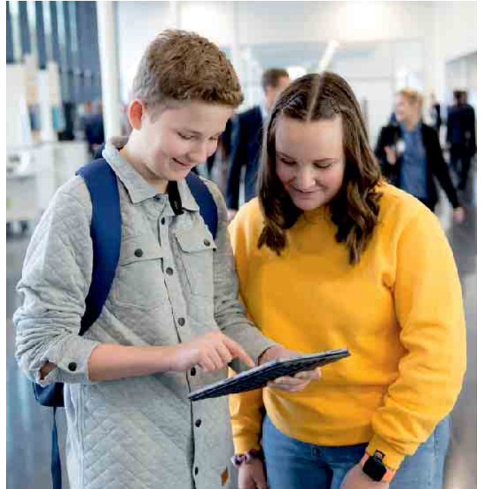
Deutschland sicher im Netz e.V. ruft Schülerinnen und Schüler der Klassen 7 bis 12 dazu auf, sich an dem Wettbewerb myDigitalWorld 2022 zu beteiligen.

Schirmherrschaft von Bundesminister Dr. Volker Wissing prämiert und ausgezeichnet. Aktuelle Studien zeigen: Insbesondere durch die Corona-Krise und vor dem Hintergrund des Kriegs in der Ukraine hat sich die Verbreitung von Falschnachrichten im Internet nochmal deutlich verstärkt. Dabei reicht die