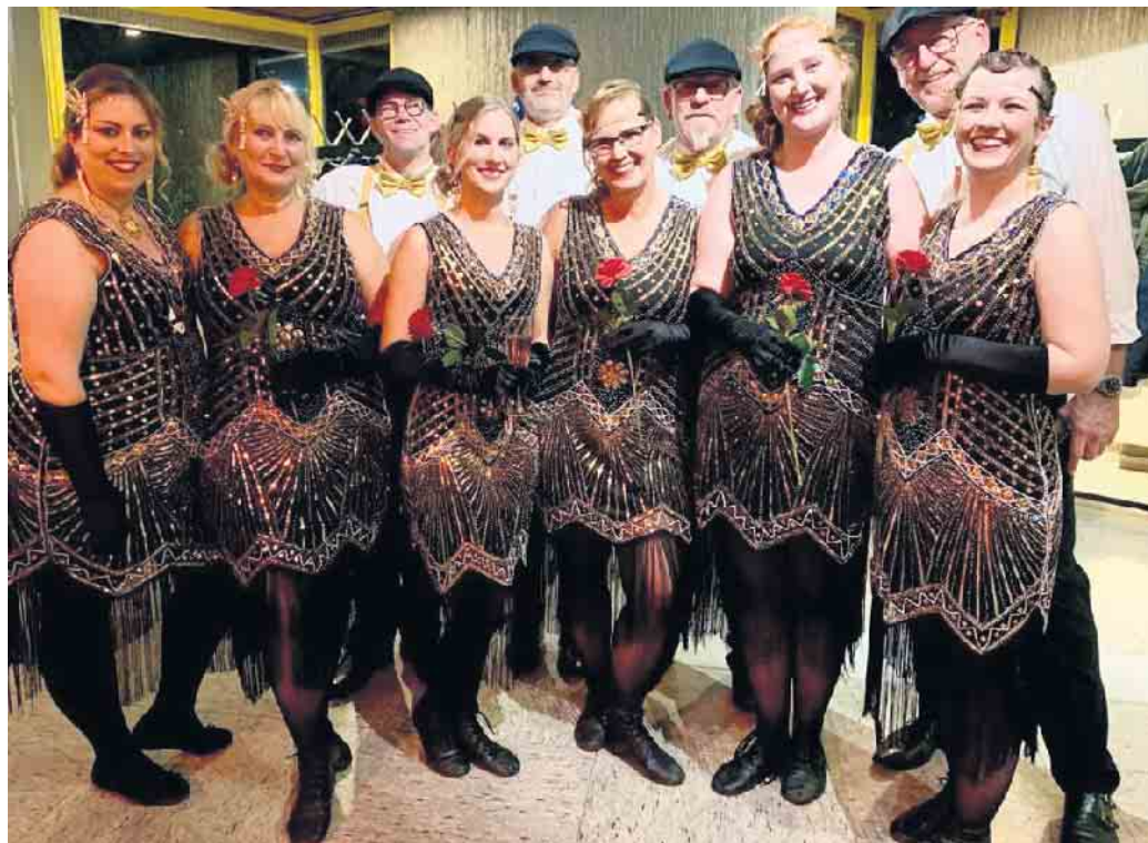
Die aktuelle, kombinierte Showtanzgruppe der KG „Stopp dä Mutz“

Nach der langen, pandemiebedingten „Sitzungsabstinenz“ steht am Freitag, den 27. Januar endlich auch wieder eine Kostümsitzung auf dem Programm der KG: Ab 19 Uhr (Einlass) wird die Broicher Bürgerhalle wieder zum Herz des Broicher Karnevals. Die KG hat ein buntes Programm zusammengestellt, bei dem u.a. die „Prinzengarde Frechen“, „Feuerwehrmann Kresse“, die Band „Schnütz“ und „Der Kölner Landmetzger“ auf der Bühne stehen werden. Und natürlich wird es auch einen Auftritt der beiden KG-eigenen Showtanzgruppen geben, die in dieser Session einen gemeinsamen Auftritt einstudiert haben. Eintrittskarten für die Sitzung gibt es bei allen Aktiven (Kontakt über stoppdaemutz@web.de) zum Vorverkaufspreis von 17 Euro (Abendkasse 19 Euro).