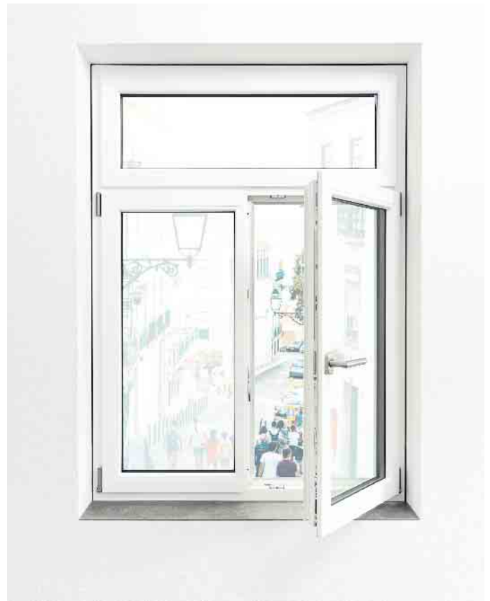
Fenster, die geschlossen und geöffnet Freude machen.

Kleine nützliche Technik-Helfer bieten sich auch an, um sogenannte Wärmebrücken zu erkennen. Dort ist es, anders als man vermuten mag, nicht besonders warm, sondern kühler, denn über Wärmebrücken wird die Wärme leichter nach außen geführt. Erkennen lassen sich diese für wiederholten Schimmel anfälligen Fassadenteile an einer niedrigen Wandtemperatur von weniger als 15 Grad Celsius. Die Temperatur zeigt ein Oberflächenthermometer verlässlich an. Die überschaubare Investition in Oberflächenthermometer lohnt