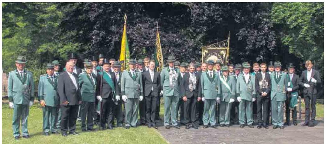
Ein Teil der Nideggerer Schützenbruderschaft beim lockeren Gruppenbild im vergangenen Sommer

ANZEIGEN · PROSPEKTEVERTEILUNG DRUCKE · WEB-AUFTRITTE · FILM