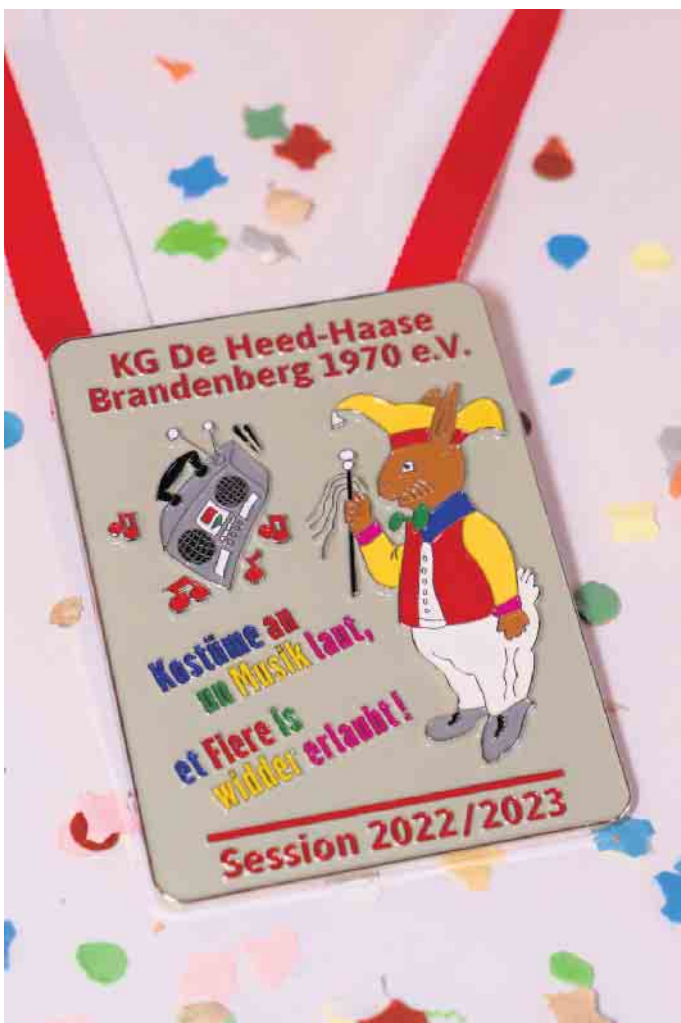
Der Sessionsorden der Heed-Haase

beginnt ab 11.11 Uhr sich den Weg durch das Eifeldorf zu bahnen. Weitere Infos sind auf www.heed-haase.de sowie auf deren Facebook-Seite zu finden.