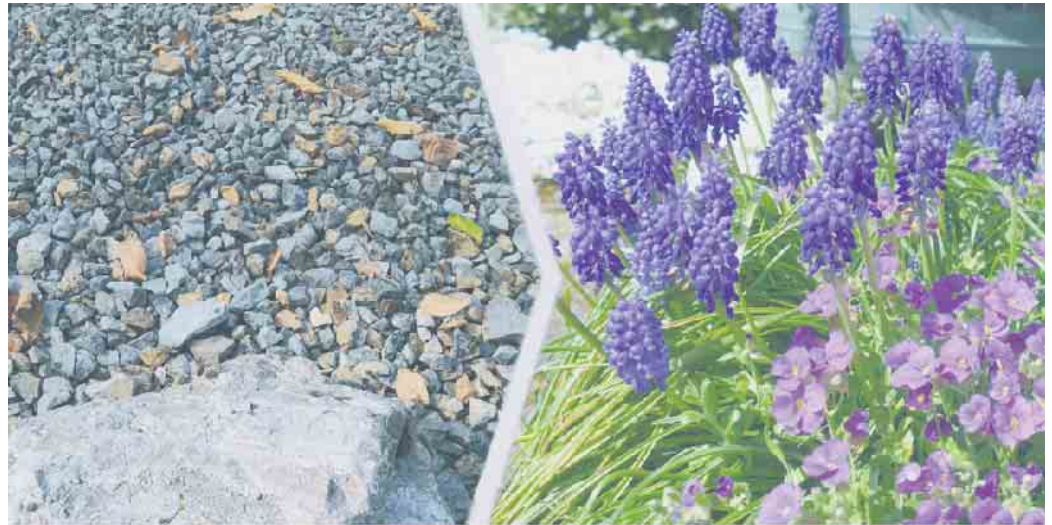
Wo einst Schotter war, blüht es nun. Dies ist das Ziel des neuen LEADER-Projekts.

Die letzten Sommer haben gezeigt, dass Extremwetterlagen punktuell zu Starkregen führen können. Versiegelte Flächen erlauben dabei keinen Abfluss des