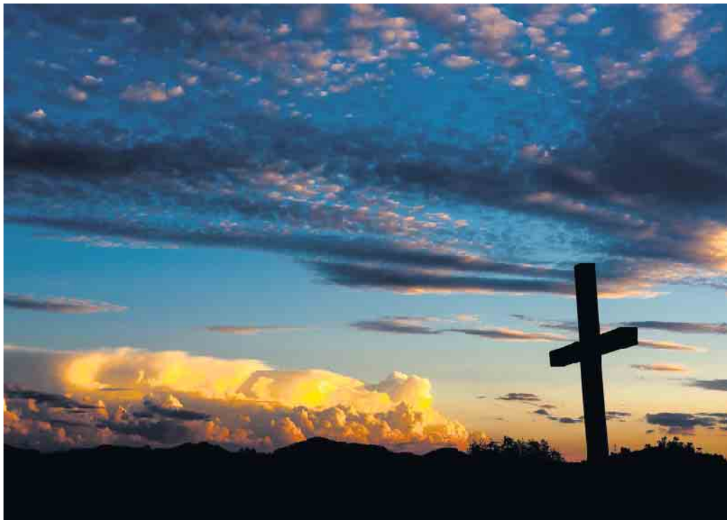
Die Bestattungskultur wandelt sich zunehmend.

Gestorben wird immer - nur die Trauerfeier und die Bestattung selbst sind individueller als früher. „Während früher ein beeindruckender Sarg den Mittelpunkt der Bestattungsfeier darstellte, geht es heute auch darum, das Programm darum herum so individuell wie möglich vorzubereiten. Es braucht eine Trauerfeier, die das Leben und die Persönlichkeit des Verstorbenen würdigt, eine gute Beratung hinsichtlich der Bestattungsart und ein immer offenes Ohr für die Belange der Hinterbliebenen“, bekräftigt Stahl. Dazu kommt die Bestattung selbst: Helle, moderne Räumlichkeiten mit der Lieblingsmusik des Verstorbenen und individuell ausgesuchtem Raumschmuck mit anschließender Beisetzung des aufwändig ge-