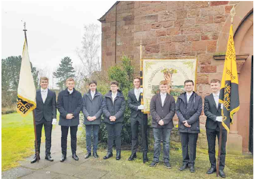
Das war im Januar 2022: Nideggens Fahnenträger und Neuaufnahmen im Corona-Jahr