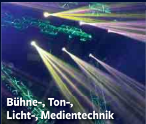
Bühne-, Ton-, Licht-, Medientechnik

Seit 25 Jahren Ihr Ansprechpartner für Medien- & Veranstaltungstechnik: