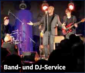
Band- und DJ-Service

SOUNDS SHOWTECHNIK Oberstraße 51 D-59964 Medebach Telefon: (02982) 3597 Telefax: (02982) 3551 www.sounds-showtechnik.de info@sounds-showtechnik.de