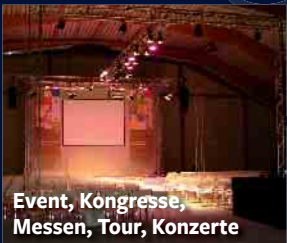
Event, Kongresse, Messen, Tour, Konzerte