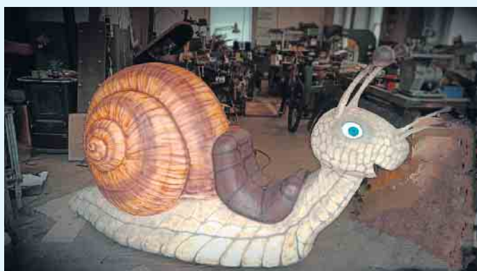
Eine Schnecke als neues Spielgerät, bevor es die Kinderaugen zum Leuchten bringt