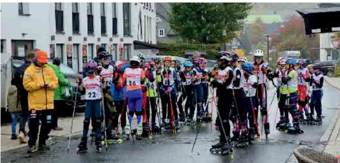
Inlinerlauf in der Innenstadt

DSV Schülercup Skisprung / Nordische Kombination S12 / S13 machte traditionell wieder Station in Winterberg