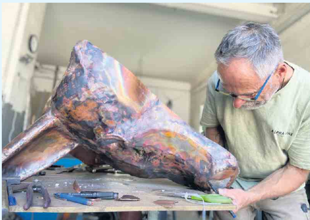
Der Kopf des Angusrind aus Kupfer in seiner Entstehung