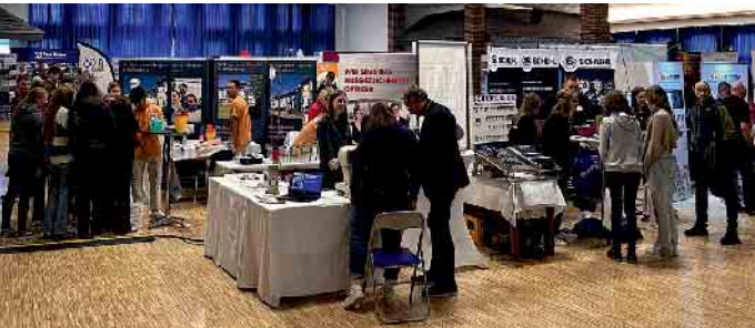
Über 500 Schülerinnen und Schüler informierten sich bei der 8. Interkommunalen Ausbildungsmesse in der Schützenhalle Niedersfeld bei den 41 heimischen Unternehmen über Karrierechancen und Ausbildungs-Angebote nach der schulischen Laufbahn.

10 der Sekundarschule Medebach-Winterberg sowie des Geschwister-Scholl-Gymnasiums, eine perfekte Kombination für eine erfolgreiche 8. Interkommunale Ausbildungsmesse, die die Städte Winterberg, Medebach und Hallenberg jetzt in der Schützenhalle Niedersfeld angeboten haben. Ein modernes Format mit vielen digitalen Elementen sowie zahlreichen Produktions-Exponaten sorgten in der Schützenhalle für ein hervorragendes Fundament, um zwischen den heimischen Betrieben und künftigen Nachwuchskräften erste Kontakte zu knüpfen, sich zu vernetzen sowie wertvolle Informationen über berufliche Karrierewege sowie Angebote seitens der Unternehmen zu transportieren.