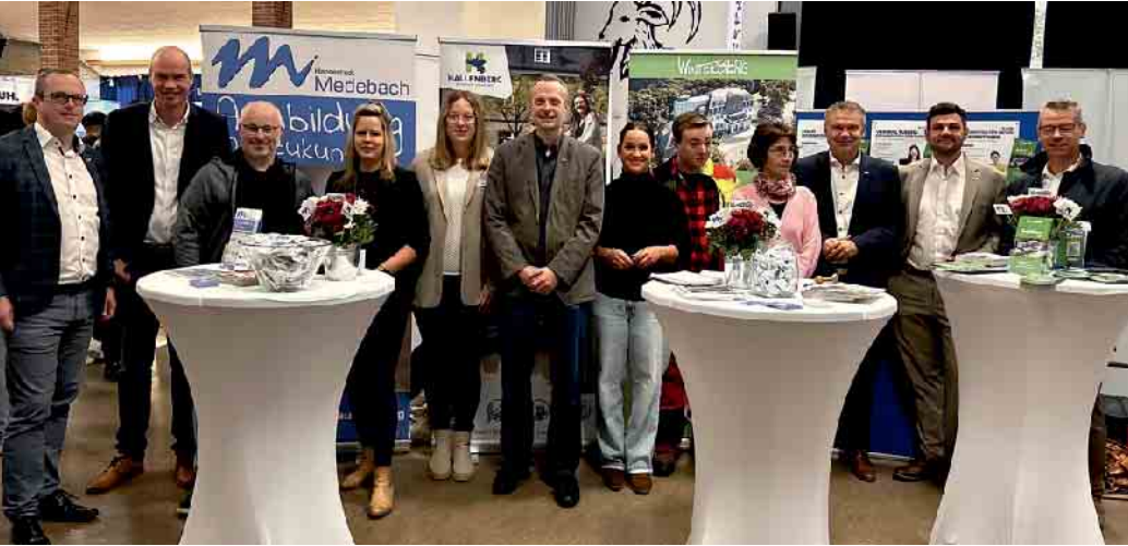
Die Vertreterinnen und Vertreter der Städte Winterberg, Medebach und Hallenberg zeigten sich von der 8. Interkommunalen Ausbildungsmesse in Niedersfeld ebenso begeistert wie die Unternehmen und Besucher.

8. Interkommunale Ausbildungsmesse in Niedersfeld überzeugt mit über 150 Angeboten für eine erfolgreiche berufliche Zukunft