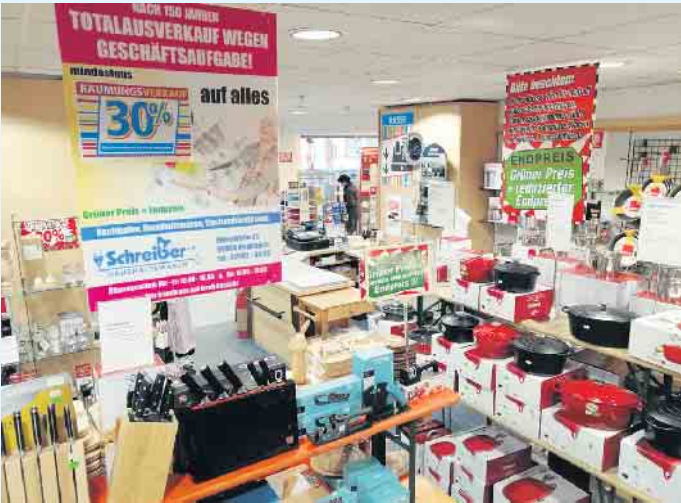
Markenküchenprodukte zu Schnäppchenpreisen bei Schreiber e.K. in Medebach