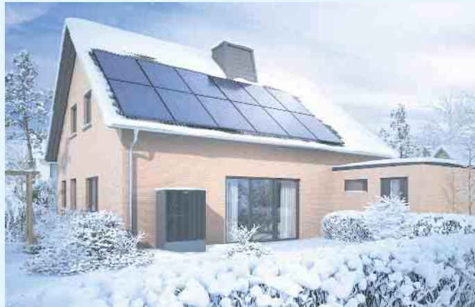
Modernes Einfamilienhaus mit Wärmepumpe und PV-Anlage

Die neueste Generation der Wärmepumpen wurde speziell für die Modernisierung entwickelt und überzeugt mit vielen Vorteilen: