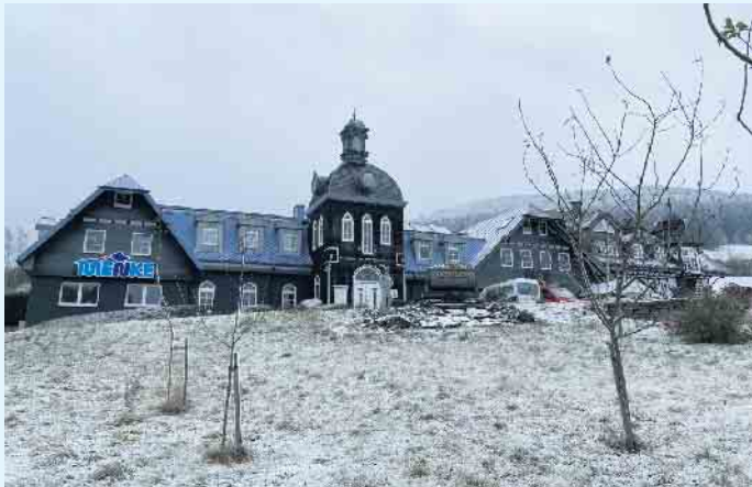
Der Meisterbetrieb Menke in Winterberg-Siedlinghausen

Die schlaue Wärmepumpe - leise, zeitlos, modular