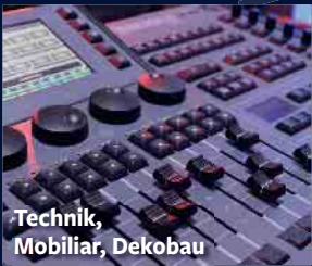
Technik, Möbiliar, Dekobau