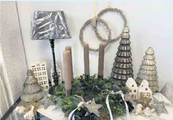
Weihnachtsdeko aus dem „Tischlein deck dich“

grün, aber auch in Naturtönen oder in festlichem gold- und silberfarben. Das weitere Sortiment besteht aus qualitativen Haushaltswaren, hochwertigem Koch- und Bratgeschirr, Küchenhelfern sowie Besteck, Gläsern, Tischwäsche, Wohnaccessoires und Dekorationen im klassisch zeitlosen, aber auch ausgefallenen Stil sowie edlen Feinkostprodukten. Alle Produkte können zum Verschenken auch gerne in einem Präsentkorb zusammengestellt und liebevoll verpackt werden. Als Geschenkidee zu Weihnachten gerne auch in Form eines Gutscheins. Das Team des „Tischlein deck dich“ freut sich auf Euren Besuch! [BL]