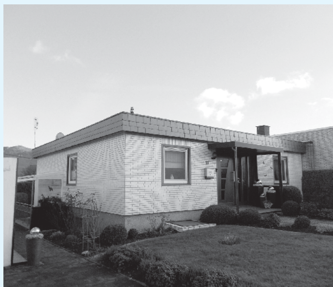
Bungalow vor der Aufstockung

Sie möchten zusätzlichen Wohnraum schaffen und Ihr Haus aufstocken? Die Möglichkeiten ei-