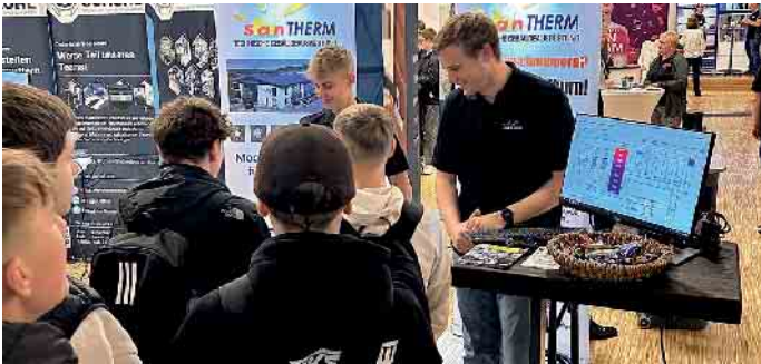
Kontakte knüpfen, Informationen über Ausbildungsberufe und -wege transportieren, Interesse wecken - dies stand bei der 8. Interkommunalen Ausbildungsmesse in Niedersfeld im Mittelpunkt.