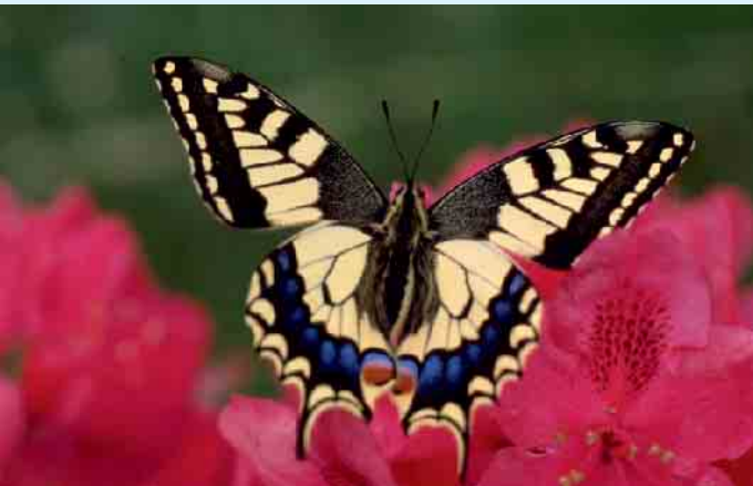
Prächtiger Schwalbenschwanz.