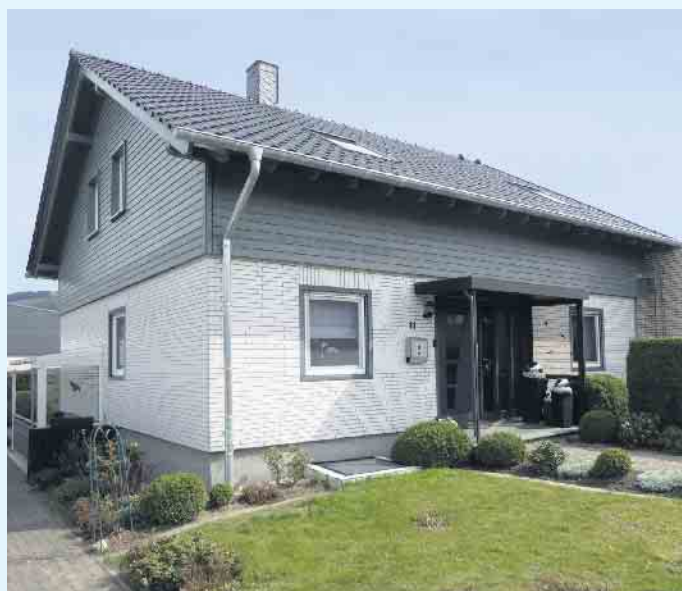
Nach der Aufstockung mit Satteldach

ner Aufstockung von bestehenden Wohnhäusern sind enorm vielfältig. Holz ist dabei der ideale