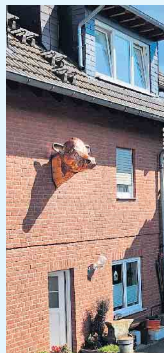
Der fertige Angusrind-Kopf als Eyecatcher an der Hauswand

Alle Objekte werden stets sehr authentisch gefertigt, mit allen Feinheiten und typischen Zügen, mit viel Liebe zum Detail. Deshalb sind bereits die nächsten großen Projekte in Planung. [BL]