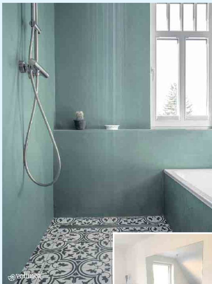
Moderne, farbenfrohe und fugenlose Badgestaltung von Volimea futado

sen auftragen. Das Ergebnis sind fugenlose, rutschsichere und pflegeleichte Oberflächen, die in ihrem natürlichen Charme viel Raum für Individualität in allen Wohnbereichen, besonders Bädern oder auch in Ihrem Geschäftsbereich lassen. Die hochstabilen und mineralischen Kalkzement- und Harzkomponenten machen die Beschichtung spannungsarm.