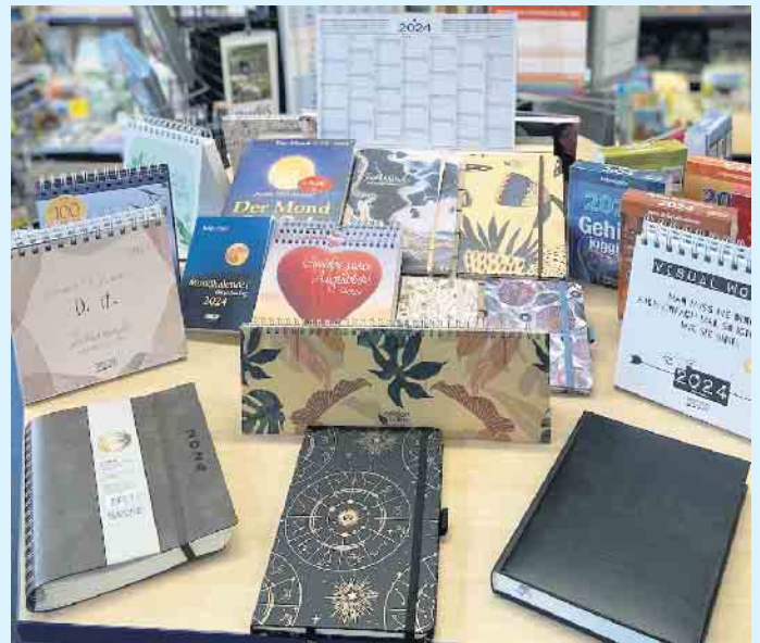
Viele Kalender für Privat bis Business bei „Buch bei Rudolph“

meist schon für den nächsten Tag bestellt werden. Über sechs Millionen literarische Werke können nur mit wenigen Klicks zur Abholung geordert werden. Auf Wunsch auch versandkostenfrei mit Lieferung bis an die Haustür, mit Bezahlung auch an der Kasse bei „Buch bei Rudolph“ und Einsparung von lästigem Verpackungsmüll dank der Auslieferung in wiederverwendbaren Bücherkisten. Ein gutes Konzept zwischen „online shoppen“ und trotzdem „lokal“ einkaufen. Bei „genialokal.de“ haben sich über 700 unabhängige Buchhandlungen zusammengeschlossen. Und das beste: Bei jedem Onlineeinkauf auf dieser Plattform werden die lokalen Buchhandlungen beteiligt. [BL]