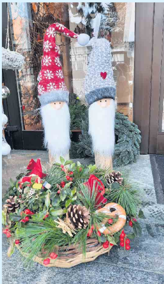
Lustig weihnachtliches bei Blumen Klauke

Familie Klauke freut sich auf Ihren Besuch [BL]