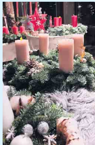
Adventskränze in verschiedenen Farben beim Adventszauber in Züschchen