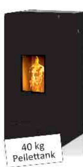
40 kg Pellettank