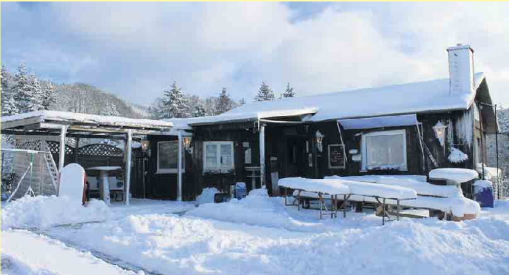
Die Clemensberghütte in Winterberg-Hildfeld

Die Clemensberghütte ist ein Treffpunkt nicht nur für die Stammgäste, sondern auch für Wanderer und andere Gäste und Einkehrer. Die Hütte liegt inmitten einer idyllischen Landschaft in der Nähe von Winterberg, am Rande des hinzugehörigen Dorfs Hildfeld am ehemaligen Skilift. Von hier aus erreicht man über die Zubringerwege unmittelbar den Rothaargebirge, der über die schöne Landschaft zur Hochheide zum Clemensberg hinaufführt. Hier kann man bei guter Fernsicht eine schöne Aussicht zum Schloßberg, dem Kahlen Asten und den umliegenden Ortschaften Küstelberg, Hildfeld, Grönebach und Winterberg genießen. Oder aber dem „Uplandsteig“ in Richtung Willingen folgen. - Hier passiert man schon die hessische Landesgrenze ins direkt angrenzende Upland. In der Clemensberghütte selbst, gilt das Motto: „Als Fremde kommen und als Freunde gehen!“ - Prima geeignet als gemütliche Rast. Wer also durch das Rothaargebirge in der Nähe von Hildfeld umherstreift,