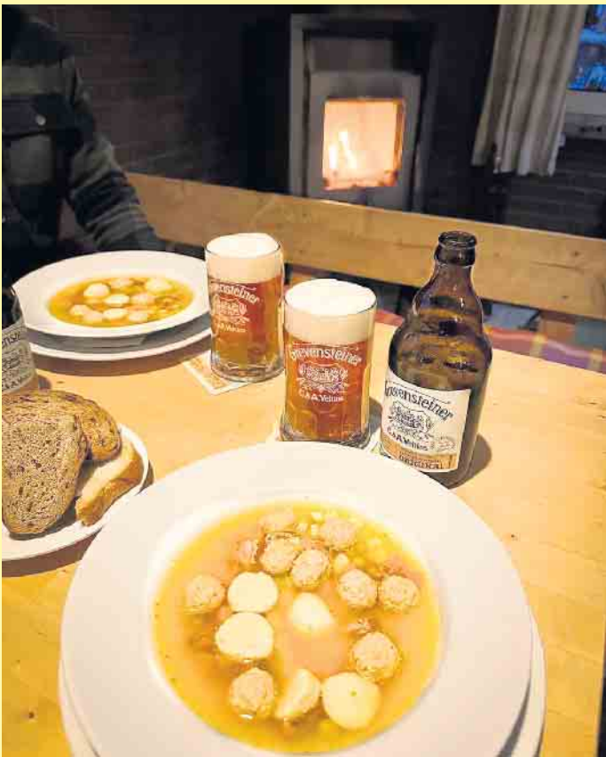
Rustikales Hüttenambiente in der Clemensberghütte