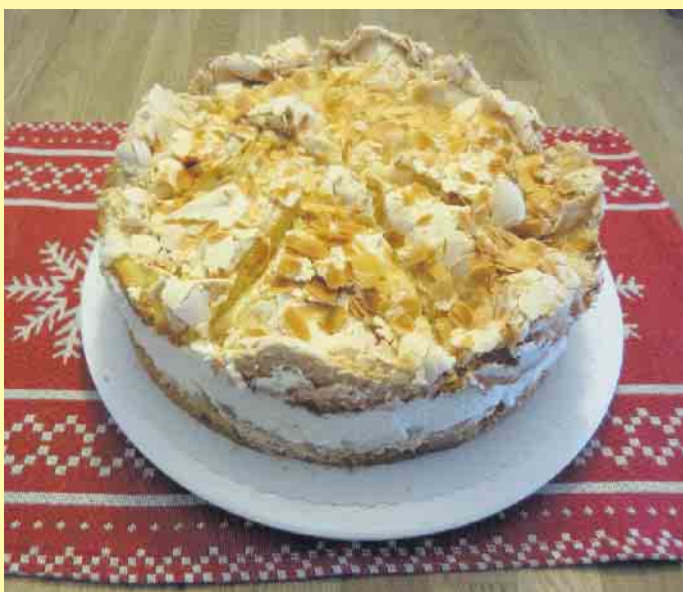
Der beliebte Bratapfel-Kuchen aus dem Altstadt Café

Die Räumlichkeiten eignen sich aber auch gut für kleine, private Weihnachtsfeiern in gemütlichem Ambiente. Verschieden belegte Waffeln und diverse Suppen lassen jedes Herz nach einer langen Tour rund um Winterberg höher schlagen. Jenni Tielke und ihr Team freuen sich auf Ihren Besuch! [BL]