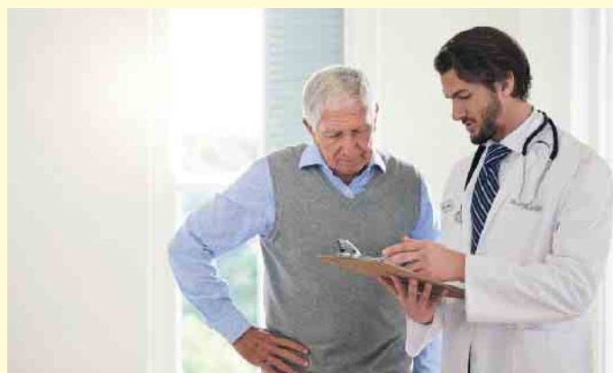
Bei Herzinsuffizienz sollten Ärzte genau hinschauen.

Ob es sich um die altersbedingte oder die erbliche Form der ATTR-CM handelt, klärt ein Gentest. Patient:innen profitieren von der ärztlichen Detektivarbeit, denn