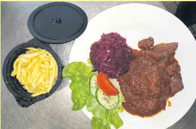
Leckere Hausmannskost in der Clemensberghütte

ung kann wahlweise auch per Karte oder mobil über Handy erfolgen. Die Speisekarte enthält reichhaltige und schmackhafte Gerichte und die Küche ist durchgehend von 12.30 - 18.30 Uhr geöffnet. [BL]