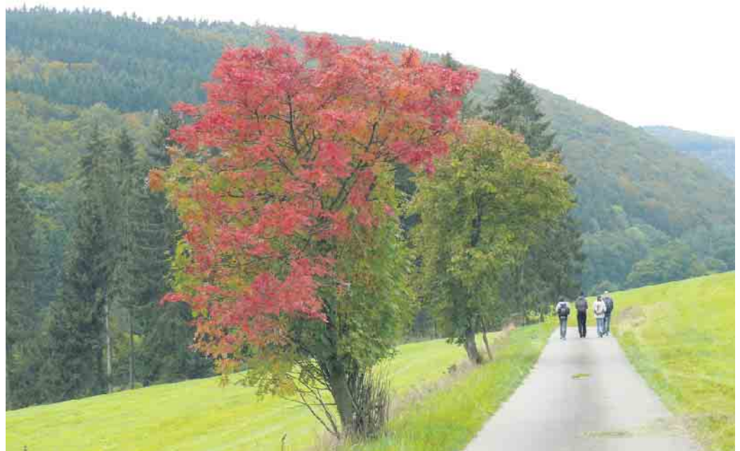
Der Herbst ist da.