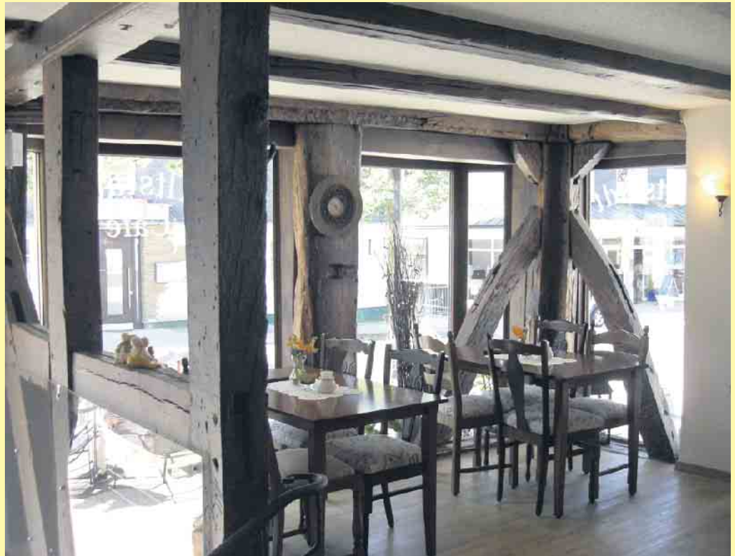
Das urig gemütliche Ambiente im Altstadt Café in Winterberg

Das Winterberger Fachwerkhaus, das von außen verschiefert wurde mit seinem „Altstadt Café“ im Inneren, ist nicht nur äußerlich eine Augenweide. Das gemütliche Café befindet sich in zentraler Lage in der Hauptstraße zwischen Marktplatz und dem Hotel Oversum. Vom Hausnamen her den Einheimischen als Haus „Wolfes“ bekannt, befindet sich das Haus mitten in der Winterberger Altstadt. Noch heute ist aus der Luft deutlich die ringförmige Anordnung der Häuser um die St.-Jakobus-Kirche herum erkennbar und besonders durch den bogenförmigen Verlauf der Hellenstraße zu erkennen. Die dort befindlichen Häuser können allesamt ein Stück Geschichte aufweisen, da sie bereits im 18. Jahrhundert errichtet wurden. Betritt man das Altstadt Café, so fühlt man sich gleich „wie bei Muttern“. Das im Inneren noch gut erhaltene Fachwerkgebälk wurde beim Umbau vor über zehn Jahren neu in Szene gesetzt. Hierdurch ist ein uriges Ambiente entstanden, wo man sich gerne niederlässt. Frühstück ist auf Vorbestellung im Café immer möglich. Eine Kinderspielecke ist vorhanden. So können die Mütter in Ruhe ihren Kaffee genießen. Auf