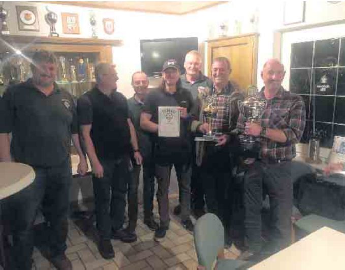
Sieger des Kreispokalschießens: die Schützengesellschaft Winterberg