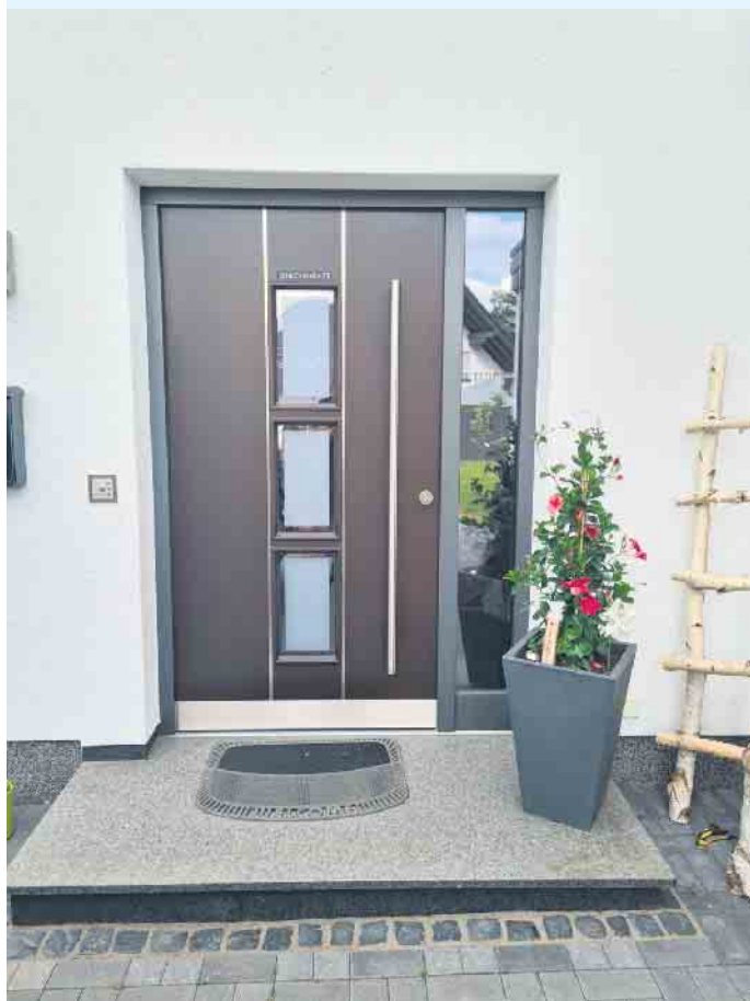
Moderne Haustür von Tischlerei Holztec