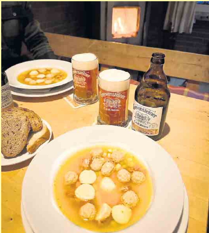
Warme Suppe in der kalten Jahreszeit in der Clemensberghütte

Die Clemensberghütte ist ein Treffpunkt nicht nur für die Stammgäste, sondern auch für Wanderer und andere Gäste und Einkehrer. Die Hütte liegt inmitten einer idyllischen Landschaft in der Nähe von Winterberg, am ehemaligen Skilift, am Rande des hinzugehörigen Dorfes Hildfeld. Von hier aus erreicht man über die Zubringerwege unmittelbar den Rothaargebiet, der über die schöne Land-