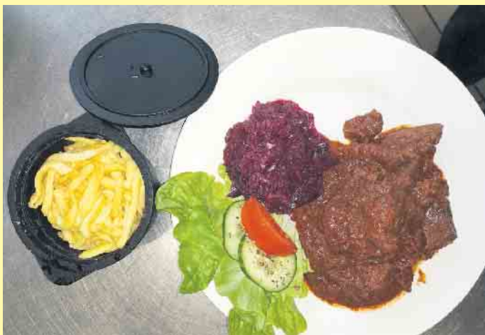
Leckeres Gulaschgericht mit Pommes