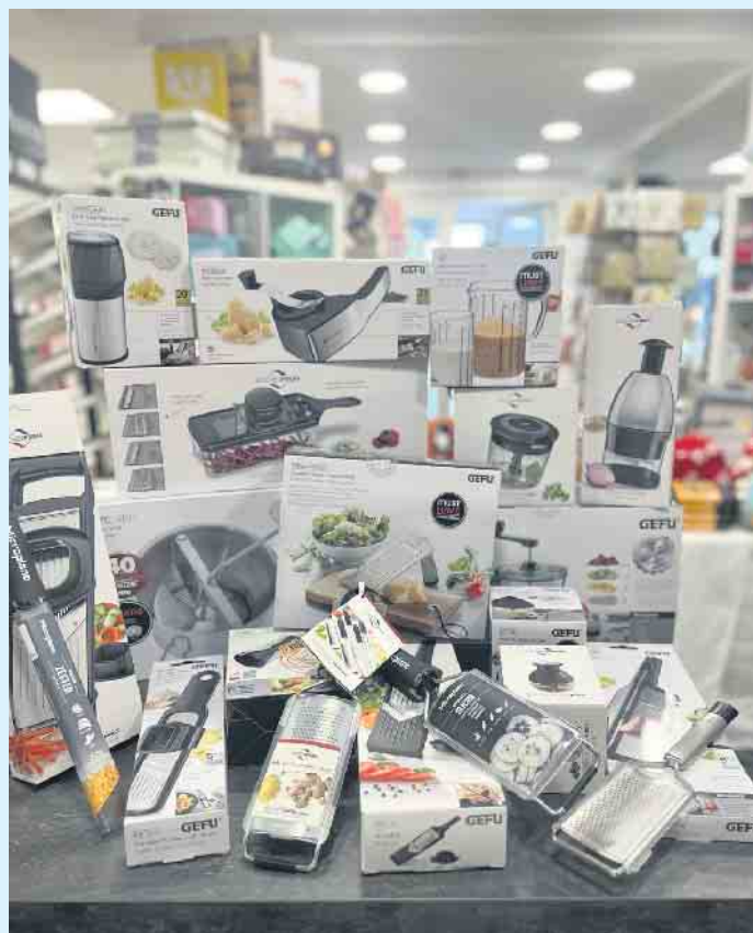
Zahlreiche Küchenhelfer von KÜCHENPROFI und GEFU beim „Tischlein deck dich“

Das Team vom „Tischlein deck dich“ berät Sie gerne für eine meisterhafte Zubereitung und anschließenden perfekten Genuss in der Küche. [BL]