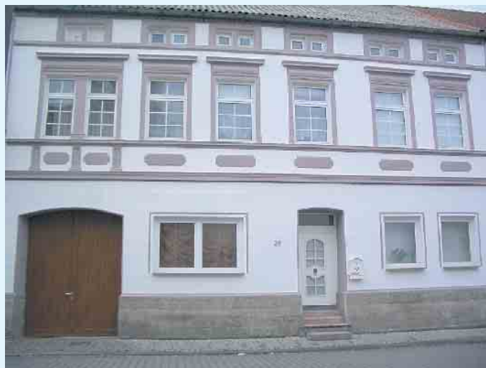
Tor- und Außentürerneuerung

weiteren bietet Holztec neben dem Einbau von Türen wie Zimmertüren, sicheren Wohnungstüren sowie Trennwänden und Trennwandsystemen mit Gleittüren, auch die Nachrüstung von Fenstern und Türen mit Sicherheitssystemen und Beschlägen an. Ebenso den Einbau hochwertiger Isoliergläser, Reparaturarbeiten an Fenstern, Rollläden und Möbeln. Auch das Verlegen von Fertigparkett, Laminat, Korkboden oder Vertäfelungen gehört neben der Beratung in Sachen Innenausbau und Treppenrenovierung zum Aufgabengebiet. Vor ein paar Jahren kam die Fertigung von Balkonen, Zäunen und Sichtschutzelementen aus Kunststoff hinzu. Natürlich gibt es auch hier eine Vielzahl von Gestaltungsmöglichkeiten in Form und Farbe. [BL]