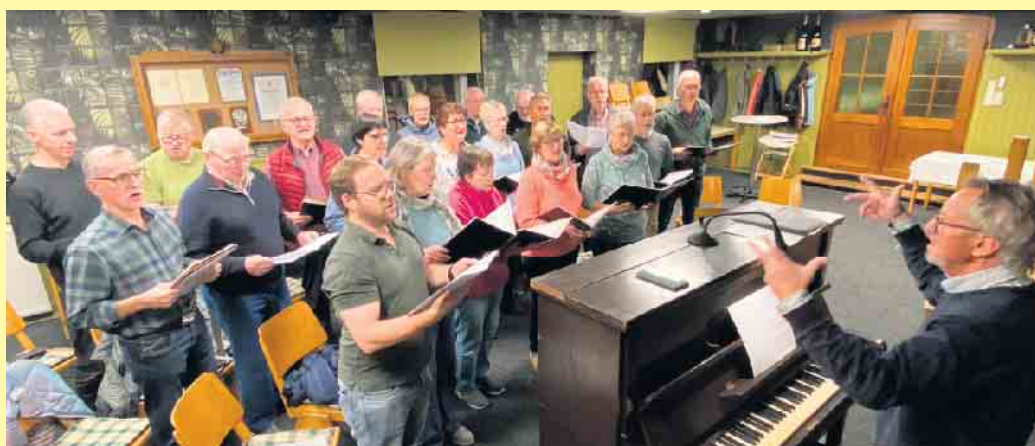
Der Chor beim Proben im Landgasthof Schöttes

bedingt auch das traditionelle Martinsgans- und Enten-Essen vormerken. Auch hier bitte mit Reservierung.