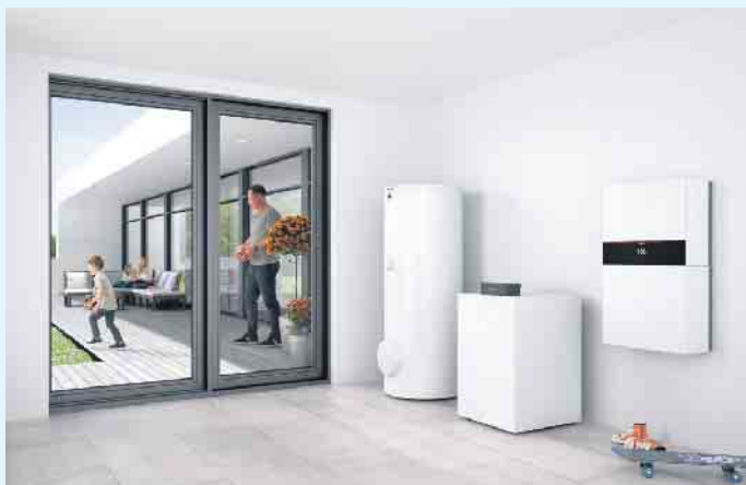
Wärmepumpe im Innenbereich