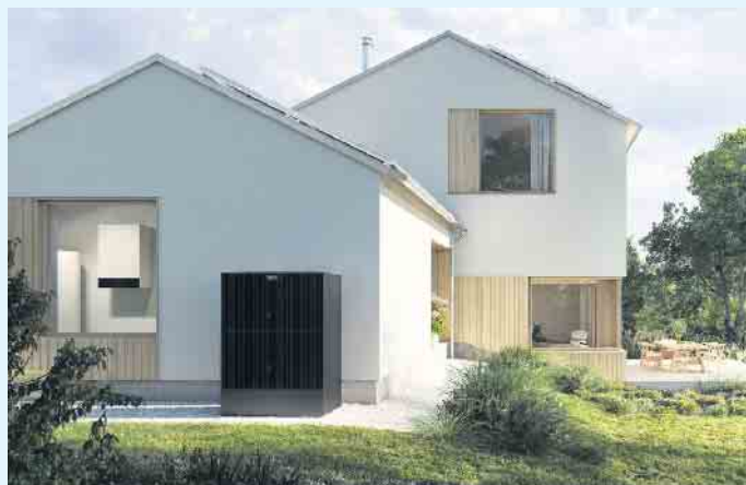
Moderne Einfamilienhäuser mit Wärmepumpe im Außenbereich