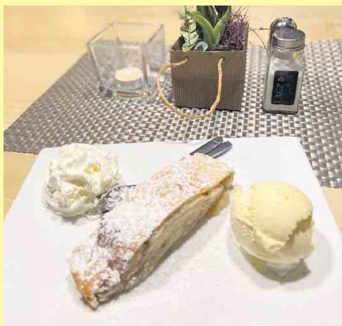
Apfelstrudel als Dessert im Landgasthof Schöttes

Kulinarische Sonderwünsche, vegetarische Speisen sowie spezielle Gerichte bei Unverträglichkeiten werden gerne individuell umgesetzt. Alle Speisen können einen Tag zuvor auf Bestellung gerne auch für zu Hause abgeholt werden. Außerdem bietet der Gasthof mit Herz auch einen Catering-Service für Firmen und Privatpersonen an. [BL]