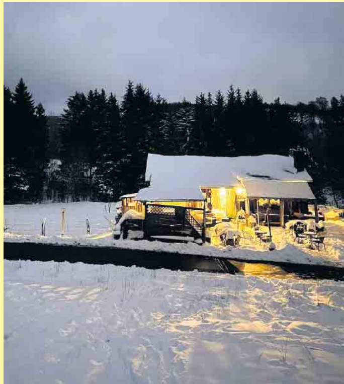
Die Clemensberghütte in Winterberg-Hildfeld

schaft zur Hochheide zum Clemensberg hinaufführt. Von dort aus kann man bei guter Fernsicht eine schöne Aussicht zum Schloßberg, den Kahlen Asten und den umliegenden Ortschaften Küstelberg, Hildfeld, Grönebach und Winterberg genießen. Oder aber dem „Uplandsteig“ in Richtung Willingen folgen. Hier passiert man schon die hessische Landesgrenze ins direkt angrenzende Upland.