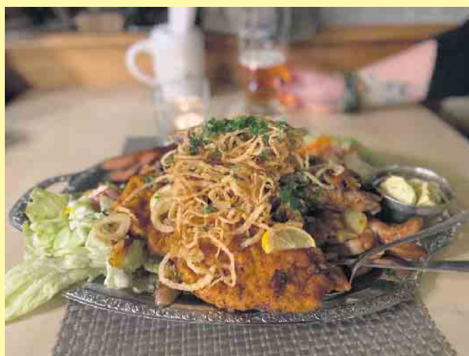
Leckeres Schnitzelgericht im Gasthof Schöttes