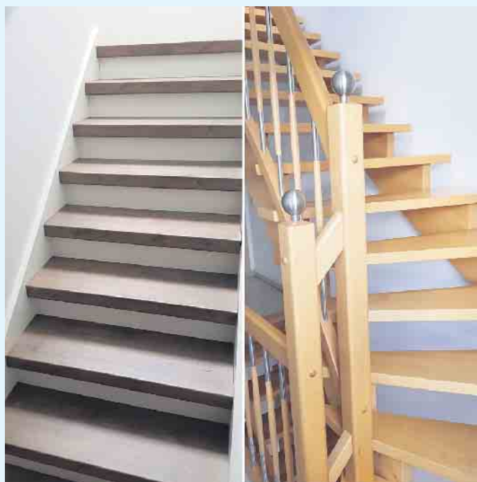
Treppengestaltungen von Holztec aus Küstelberg