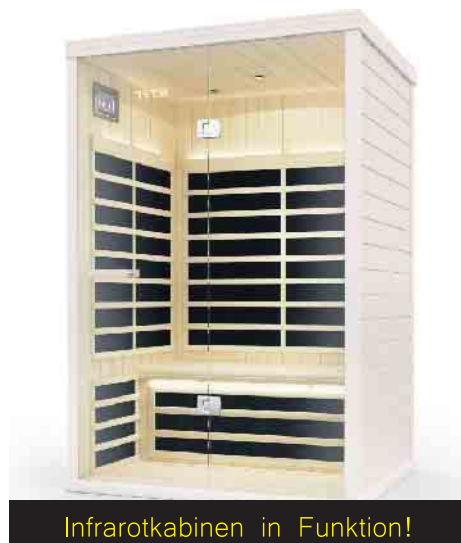
Infrarotkabinen in Funktion!