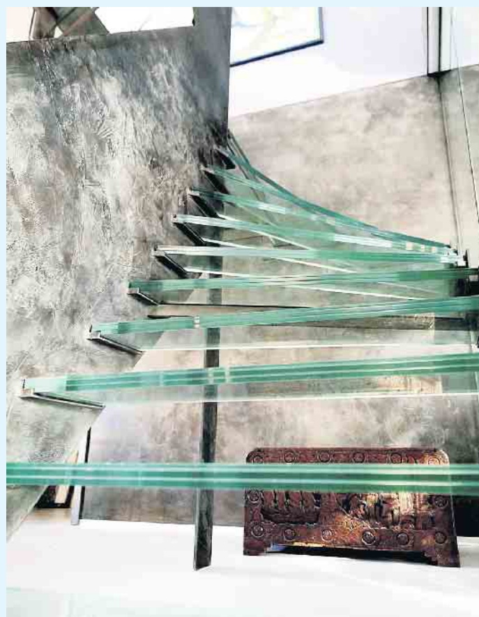
Einzigartige Wandbeschichtung von „Volimea purmetalico“

Ihr Malerbetrieb Schnorbus berät Sie gerne zu Ihrer individuellen, Echtmittel-Wandgestaltung. [BL]