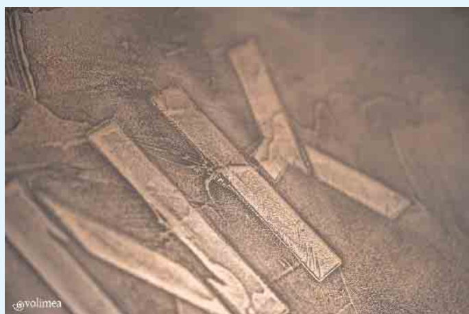
Zeitlos schöne Echtmittel-Beschichtung von „purmetalico“