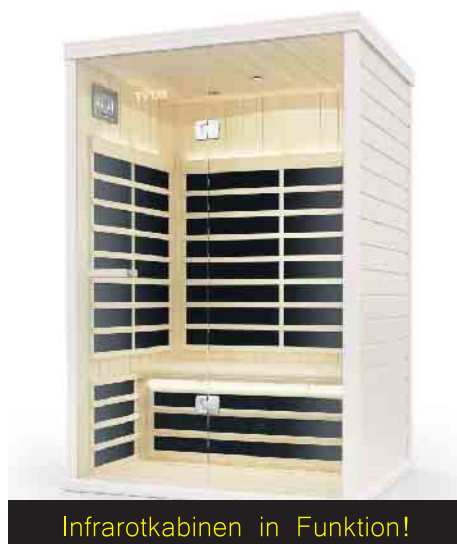
Infrarotkabinen in Funktion!