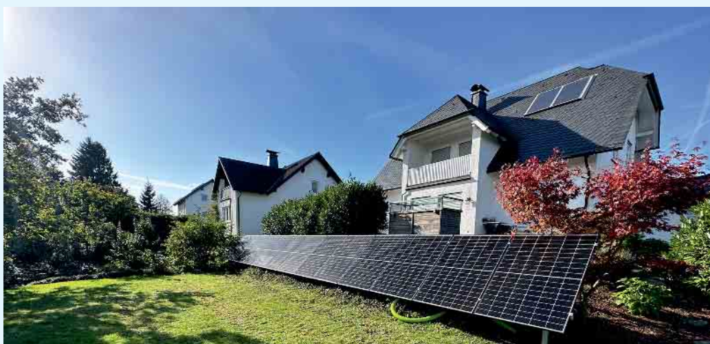
Auch eine gute Aufstellmöglichkeit: PV-Anlage auf der Rasenfläche im Garten

Alternativ kann eine Aufstellung einer PV-Anlage auch mit entsprechender Halterung auf einem Carport, einer Garage, Balkon oder im Garten erfolgen. Einige moderne Module verfügen über einen schwarz eloxierten Rahmen, besonders dunkle monokristalline Zellen und eine schwarze Tedlarfolie.