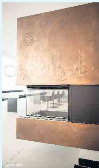
Einzigartige, stylische und gemütliche Raumgestaltung von „purmetalico“

Der Malerbetrieb Schnorbus aus Züschen verleiht jeder Oberfläche mit Echtmittel-Beschichtungen durch besondere Texturen, Strukturen sowie natürlicher Patina eine besondere Note. Purmetalico von Volimea ist eine wärmeleitfähige, magnetische und reaktive Wandbeschichtung mit metalltypischen Eigenschaften.