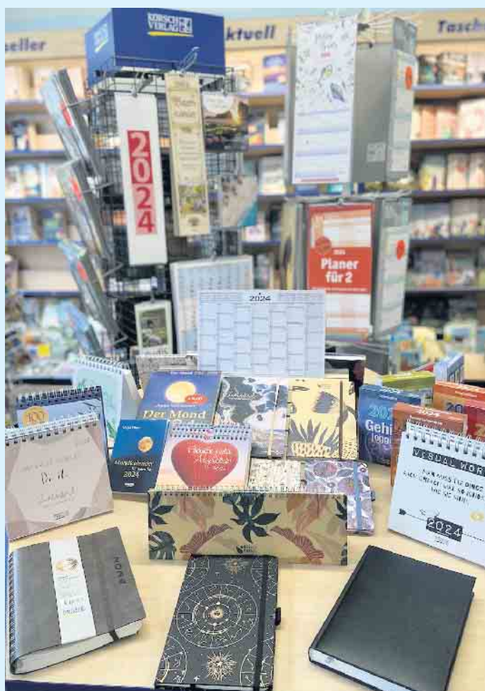
Viele Kalender für Privat und Business bei „Buch bei Rudolph“

den nächsten Tag bestellt werden. Über sechs Millionen literarische Werke können nur mit wenigen Klicks zur Abholung geordert werden. - Auf Wunsch auch versandkostenfrei mit Lieferung bis an die Haustür, mit Bezahlung auch an der Kasse bei „Buch bei Rudolph“ und Einsparung von lästigem Verpackungsmüll dank der Auslieferung in wiederverwendbaren Bücherkisten. Ein gutes Konzept zwischen „online shoppen“ und trotzdem „lokalement“ einkaufen. Bei „genialokal.de“ haben sich über 700 unabhängige Buchhandlungen zusammengeschlossen. Und das beste: Bei jedem Onlineeinkauf auf dieser Plattform werden die lokalen Buchhandlungen beteiligt. [BL]