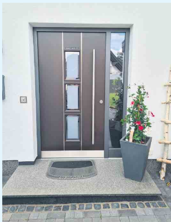
Zeitlos schöne Haustür von Tischlerei Holztec