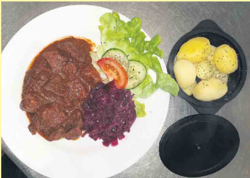
Schmackhaftes Gulaschgericht in der Clemensberghütte

In der Clemensberghütte selbst, gilt das Motto: „Als Fremde kom-