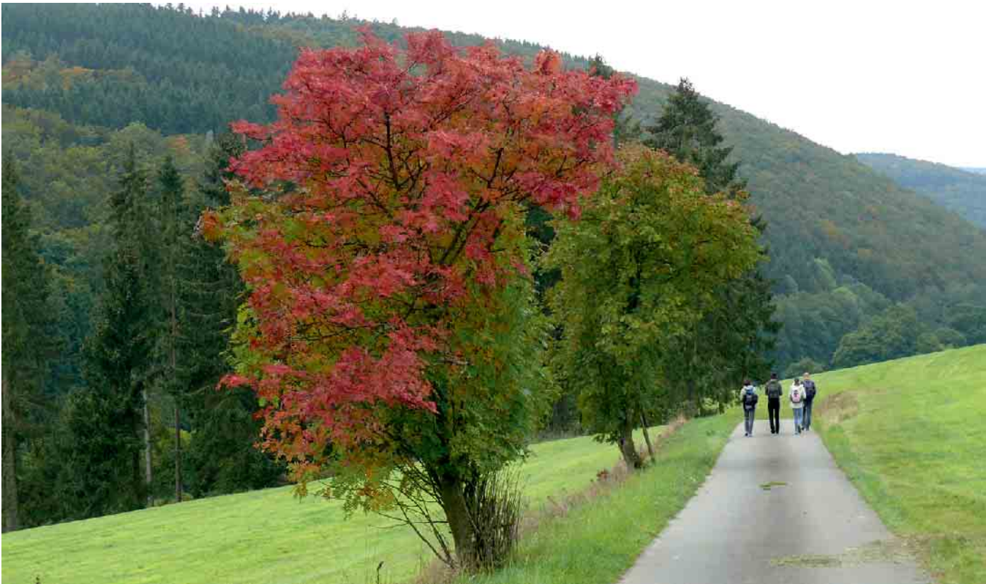
Herbst im Halletal von Heinz Kling