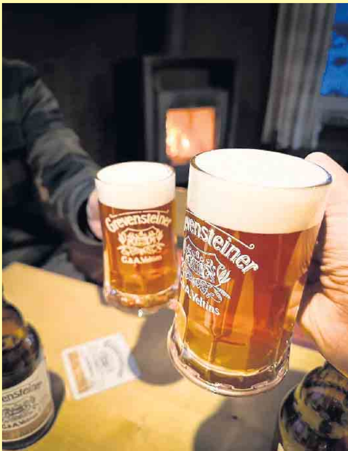
Wohl bekomm's in der Clemensberghütte