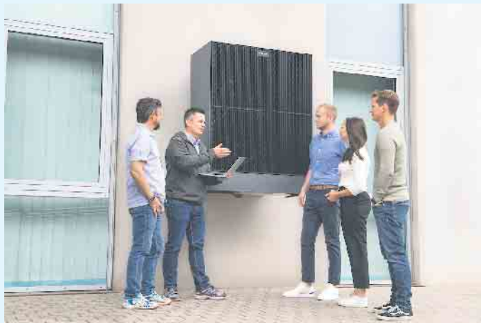
Beratungsgespräch zu PV-Anlage, Wärmepumpe und Wallbox

aktuellen Bedarf nicht vollständig abdecken kann. Der erzeugte Strom lässt sich auch in das öffentliche Stromnetz einspeisen. Moderne Anlagen sind aber meistens mit einem Speicher ausgestattet, sodass der erzeugte Strom gespeichert und abgegeben wird, bis er im Haus gerade gebraucht wird. Dächer, die von der Dachfläche her nach Süden oder Südosten ausgerichtet sind, eignen sich am besten für Solaranlagen. Allerdings passt eine Ausrichtung auf Ost- oder Westdächern am besten zum typischen Verbrauchsverhalten eine Privathaushalts, da die Module in den Morgen- und Abendstunden den Strom produzieren. Mit einer Solaranlage werden ausschließlich erneuerbare Energien genutzt, außer in Kombination mit einem anderen Heizsystem. Ein klarer Vorteil bei einer Anschaffung einer Solaranlage sind die hohen, staatlichen Förderungen der „BAFA-“ oder der „KfW-Bank“. Der Meisterbetrieb Menke berät Sie gerne rund um das Thema Solar. [BL]