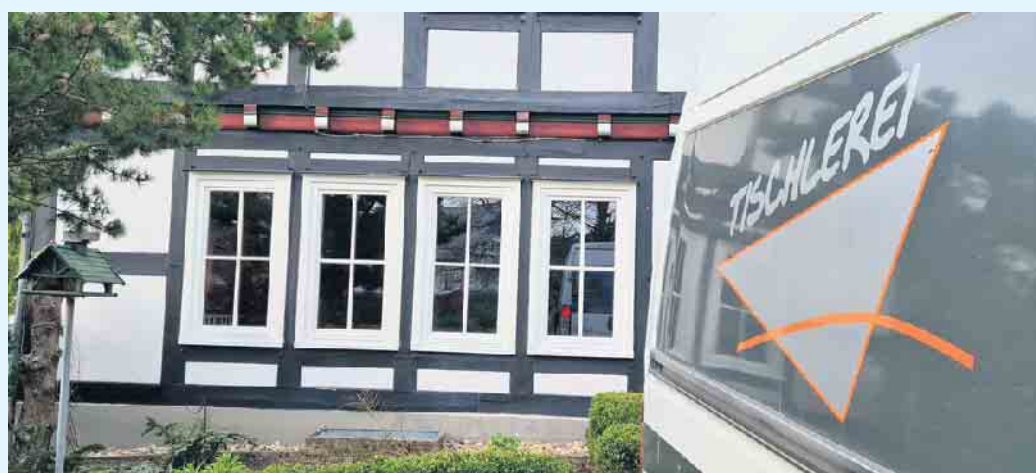
Neue Fenster von der Tischlerei Holztec

Tischlerei Holztec aus Medebach-Küstelberg bietet alles von der Planung und Anfertigung individueller Haustüren über die Fertigung von Einbaumöbeln nach Maß, den Einbau von Fenstern in allen Rahmenmaterialien, edle Fenster aus Holz, über Holz-Aluminium oder die preis-