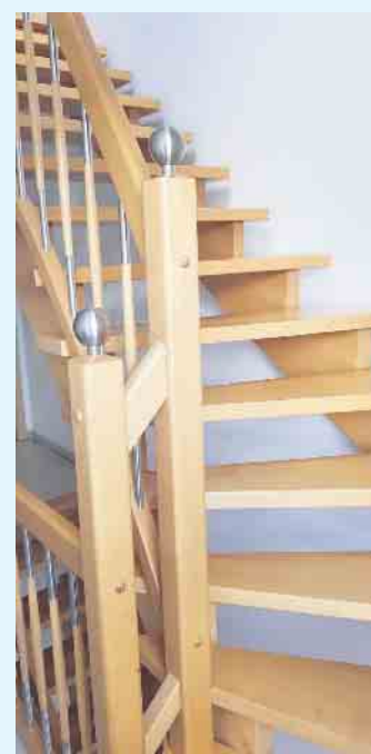
Moderne Treppe von Holztec

und baut Andreas Koch gerne nach eigener Vorstellung. Des weiteren bietet Holztec neben dem Einbau von Türen wie Zimmertüren sicheren Wohnungstüren sowie Trennwänden und Trennwandsystemen mit Gleitüren, auch die Nachrüstung von Fenstern und Türen mit Sicherheitssystemen und Beschlägen, den Einbau hochwertiger Isoliergläser, Reparaturarbeiten an Fenstern, Rollläden, Möbeln und die Planung und Montage von Sonnenschutz, Insektenschutz und Markisen. Auch das Verlegen von Fertigparkett, Laminat, Korkboden oder Vertäfelungen gehört neben Beratung in Sachen Innenausbau und Treppenrenovierung zum Aufgabengebiet der Tischlerei Holztec dazu. [BL]