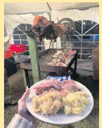
Spanferkelgrillen beim Erntedankfest an der Clemensberghütte

Geöffnet hat die Hütte Donnerstag bis Montag von 12.30 - 20.30 Uhr, Dienstag und Mittwoch ist Ruhetag. Die Küche ist ab 12.30 Uhr durchgängig geöffnet und wie lange, richtet sich nach der jeweiligen Anzahl der Besucher.- Nach Absprache auch länger. Die Speisekarte enthält schmackhafte, selbstgemachte Gerichte, teilweise saisonal variabel. Das Team um Barbara Straeck freut sich auf alle Einkehrer. [BL]