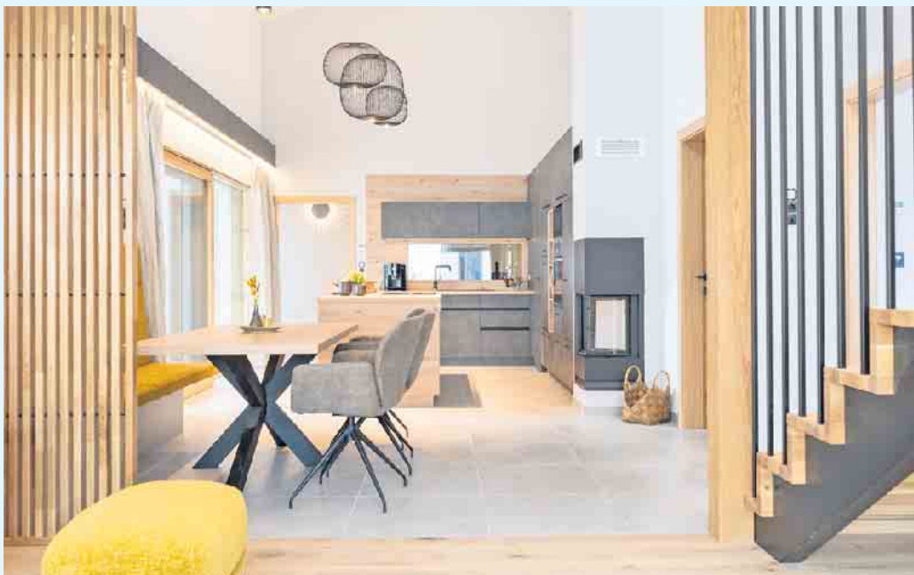
Unterschiedlich zonierte Bereiche und kurze Wege zwischen Küche, Essen und Wohnen unterstützen einen reibungslosen Familienalltag.