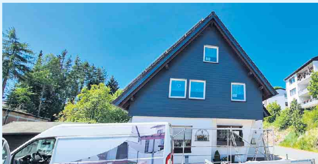
Fassadengestaltung von Tischlerei Holztec