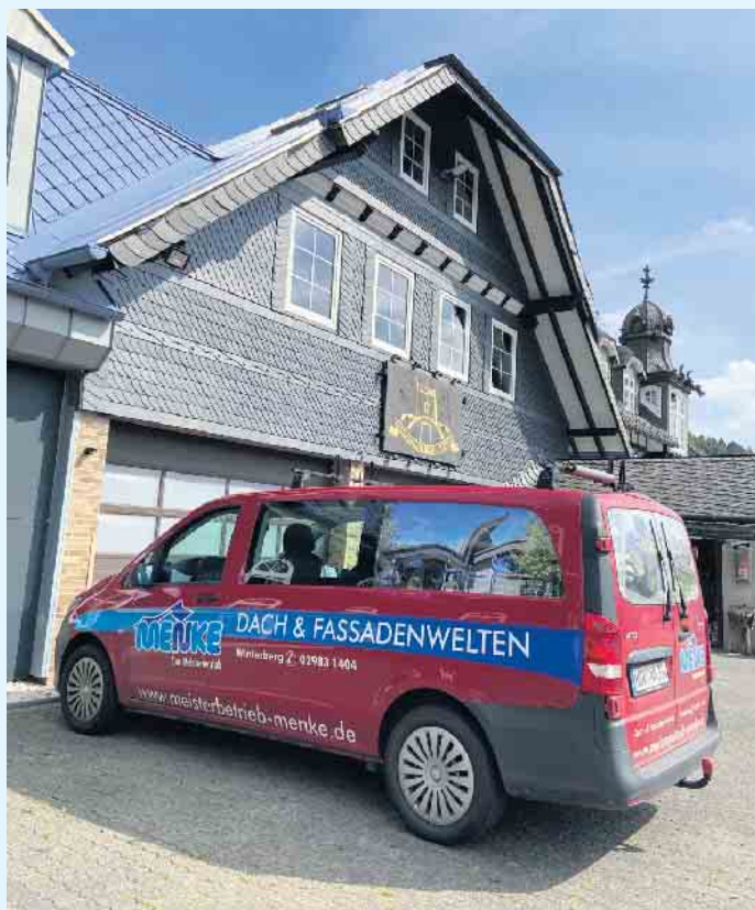
Der Meisterbetrieb Menke in Winterberg-Siedlinghausen

www.meisterbetrieb-menke.de • info@meisterbetrieb-menke.de