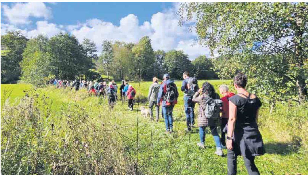
Impressionen einer vergangenen Wanderung.

Medebach. Vom 4. bis 11. Oktober können sich Outdoorfans auf eine aktive Auszeit in der bunten Herbstlandschaft des Hochsauerlandes freuen. Entdecken Sie mit Gleichgesinnten die Schönheit der Medebacher Bucht und erleben Sie emotionale und topografische Gipfelmomente! Qualifizierte Wanderführerinnen und Wanderführer bieten täglich attraktive Themenwanderungen im Luftkurort Medebach an. Die vielfältige Auswahl reicht vom Kräuterspaziergang über die Geoparkführung bis hin zu den beliebten kulinarischen Wanderungen. Zum Auftakt stehen „Verträumte Pfade rund um Medebach“ auf dem Programm. Die Teilnehmer genießen auf 13 Kilometern neben traumhaften Ausblicken auch regionale Köstlichkeiten. Der Geoparkführer bietet eine Wanderung auf dem Premiumweg „Geologischer Rundweg“ an. Ursprüngliche Steinbrüche geben Einblick in die Erdgeschichte, wunderschöne Aus- und Fernblicke gibt es on top. Die Open Mind Places im Ortsteil Referinghausen laden zum Entschleunigen, Innehalten und Verweilen ein. Entlang der Kunstwerke des Architekten Christoph Hesse wird eine geführte Tour angeboten; der Guide spricht Deutsch und Niederländisch. Zum Abschluss der achttägigen Wanderserie dürfen sich die Genusswanderer auf die beliebte Weinwanderung freuen: In eige-