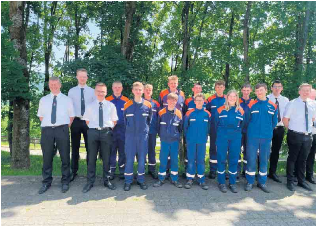
Teilnehmer und Betreuer.