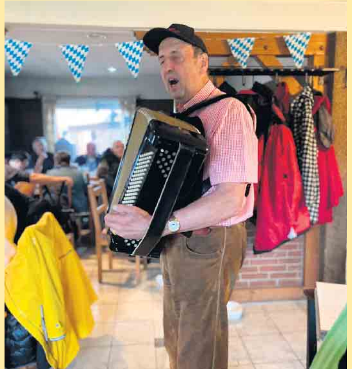
Ausgelassene Stimmung in der Clemensberghütte

der über die Hochheide mit dem Clemensberg (838m) hinaufführt, mit toller Aussicht zum Schloßberg, dem Kahlen Asten und den umliegenden Ortschaften Küstelberg, Hildfeld, Grönebach und Winterberg. Oder aber den Wanderpfad „Uplandsteig“ in Richtung