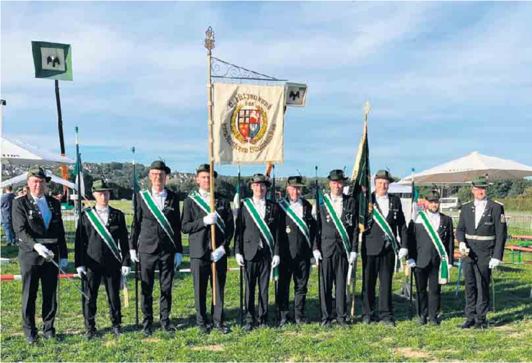
Abordnung der Medebacher Schützen mit der Bundesstandarte.