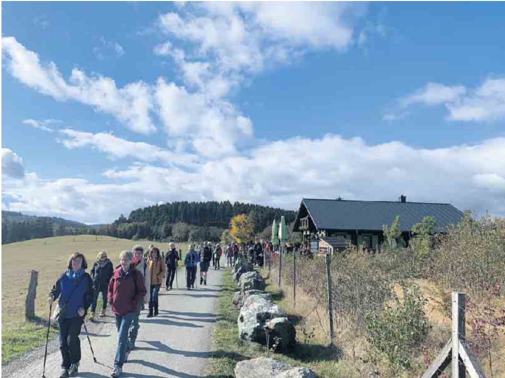
Impressionen von vergangenen kulinarischen Wanderungen.

Herbstzeit ist Wanderzeit! Die bunte Jahreszeit mit allen Sinnen ausgiebig genießen, können Outdoorfans bei den kulinarischen Wanderungen, die sich als fester Bestandteil im Veranstaltungskalender etabliert haben. Die Touristik Medebach lädt zu zwei unterschiedlich langen Touren ein: Am Samstag, 7. Oktober, startet unter dem Motto „Sauerländer Hütten kulinarisch genießen“ eine etwa 16 Kilometer lange, geführte Wanderung mit fünf deftig-rustikalen Stationen. Von der Ruhrquellenhütte bei Winterberg geht es über den Rothaarsteig zur Ruhrquelle und weiter zur Schlossberg Alm in Küstelberg. Stetig bergab über den alten Hanseweg X13, erreichen die Wanderer das Kloster Glindfeld, welches sich im Privatbesitz der Familie Borbet befindet. Hier dürfen sich die Teilnehmer auf eine Führung durch die historischen Gemäuer freuen. Die letzte Hütteneinkehr ist im Hasenstall, direkt am AVENTURA-SpielBerg. Hier klingt der ereignisreiche Wandertag mit herrlichem Blick auf die Medebacher Bucht aus. „Kulinarik & Wein auf alten Spuren“ heißt es dann am Sonntag, 8. Oktober, auf der etwa sieben Kilometer langen Weinwanderung in Zusammenarbeit mit dem Pfälzer Weinlädchen. Hierbei handelt es sich nicht um eine geführte Tour, die Teilnehmer wandern selbstständig und im eigenen Tempo entlang der fünf