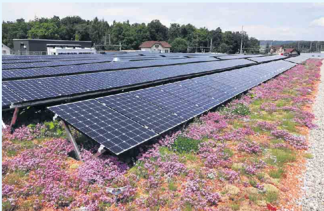
Solare Technik und eine Dachbegrünung: Diese Kombination ist gleichermaßen ökologisch als auch wirtschaftlich sinnvoll.

Besonders vielfältig sind die Möglichkeiten naturgemäß auf flachen Dächern, sie reichen von der Wildblumenwiese über den Dachgarten und das hauseigene Biotop bis hin zum solaren Kleinkraftwerk. Wer begrünt, schafft nicht nur eine optische Verschönerung, sondern trägt aktiv zum Klimaschutz bei. Vor allem in Ballungsräumen sind die Flächen in hohem Maße versiegelt, für Siedlungs- und Verkehrsflächen liegt die Quote aktuell bei 45 Prozent.