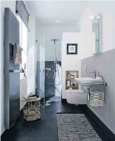
Kermi zeigt mit der Duschattrennung Raya, wie sich Wandelemente und transparente Duschtüren zu komfortablen Lösungen kombinieren lassen, die auch in kleinen oder schmalen Räumen perfekt funktionieren.

Kombination aus falt- und Drehtüren fällt, hängt ganz von den räumlichen Gegebenheiten und den persönlichen Vorlieben ab. Aber auch eine abgeschlossene Kabine kann ausgesprochen transparent wirken, wenn eine rahmenlose oder teilgerahmte Beschlag-Duschkabine gewählt wird. Wie auch immer: Hauptsache, die Dusche bietet kein Hindernis für grenzenlosen Durchblick. (akz-o)