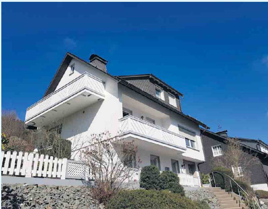
Moderne, helle Balkongestaltung der Tischlerei Holztec