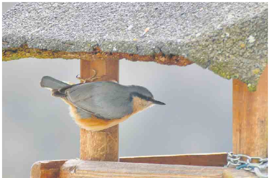
Kleiber am Vogelhäuschen in Oberschledorn