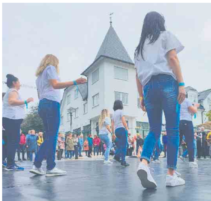
Tanzen auf Augenhöhe hieß die Devise auch bei der Premiere der „Offenen Tanzfläche“ in Winterberg.

„Wir möchten mit diesem Projekt den Tanz in allen seinen Formen in unserer Region alltäglicher machen. Ziel ist es, die Hemmschwelle zu senken. Es wird Zeit zu zeigen, dass das Tanzen nicht nur exklusiv in Tanzschulen und Theatern oder bei größeren Festen stattfindet, son-