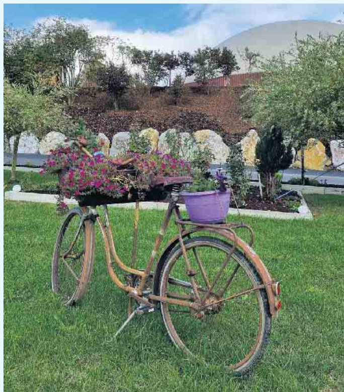
Einladende Herbstdeko beim Hof Wittmar