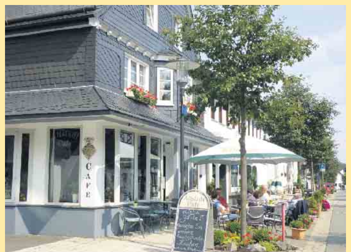
Das gemütliche Altstadt Café in Winterberg