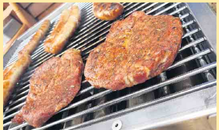
Grillgut bei der Hoheleyer Hütte

Am 15. und 16. Oktober findet das herbstliche Kartoffelfest mit rustikalen Speisen sowie Holzhauer-Kaffee & Kuchen an der Hütte statt, mit musikalischer Unterhaltung. Alles aber nur bei gutem Wetter. Dienstags bis sonntags ist das Team um Volker Müller durchgehend von 11.00 bis 19.00 Uhr für alle Einkehrer da. Die Küche ist von 11.30 bis 18.00 Uhr geöffnet. Das Speisenangebot umfasst eine rustikale Speisekarte, hausgemachten Kuchen wie diverse Obststreu-Sorten vom Blech, die „Windbeutel-torte“- als Spezialität des Hauses oder der Hütten-Burger vom Angus Rind. Dazu natürlich auch eine passende Auswahl an Kalt- und Heißgetränken. Alle Gerichte auch „to go“ und „take away“. Als besondere Geschenkidee sind hier auch Gutscheine erhältlich. Außerhalb der regulären Öffnungszeiten steht das Hüttenteam auf Vorbestellung auch für private oder geschäftliche Feierlichkeiten gerne zur Verfügung. [BL]