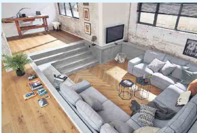
Ein Parkettboden ist auch 2022 moderner denn je.

Holzfußböden tragen als einziger moderner Fußbodenbelag entscheidend zu einem gesunden Raumklima bei. „Einmal verlegt, lebt und atmet das Holz als natürlicher und lebendiger Werkstoff auch nach der Verarbeitung weiter“, weiß der vdp-Vorsitzende. „Dabei reagiert der Holzboden auf die Raumtemperatur und schwankende Luftfeuchtigkeit, indem das Holz die feuchte Luft aufnimmt und in trockeneren Phasen wieder abgibt.“ Auf diese Wei-