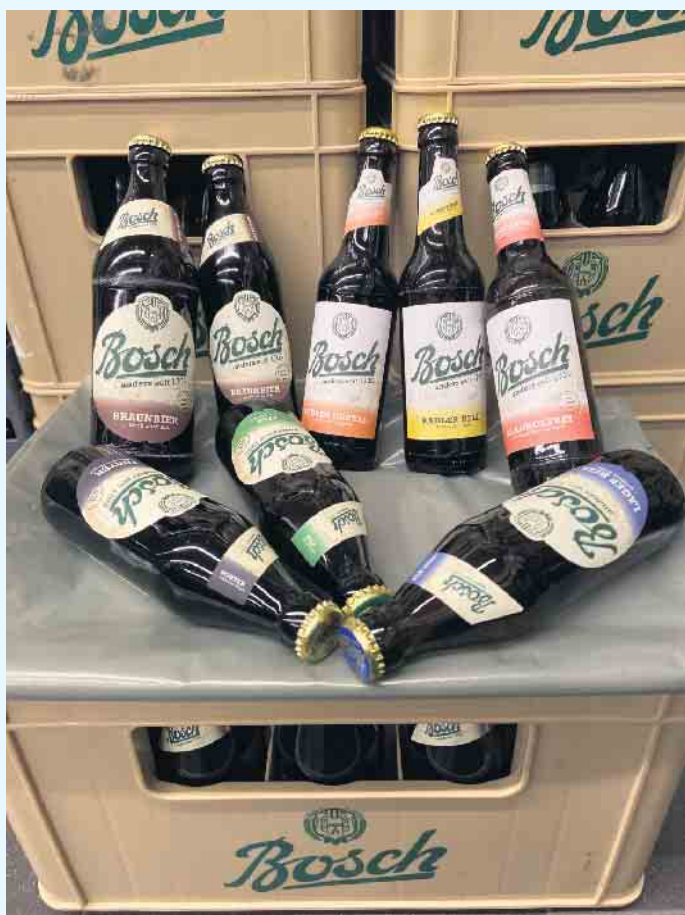
Biersorten von Bosch beim E-Center Löffler

Im Getränkemarkt des „E-Center Löffler“ in Winterberg sind neben einer großen Auswahl an Biersorten aus ganz Deutschland und der ganzen Welt, auch Premium-Biere aus den heimischen Region vorhanden. Fast jeder kennt und schätzt es mittlerweile: „Das Bier von hier- mit dem Besten aus dem Sauerland“, so der Slogan des Hallenberger und Winterberger Landbier, was im Brauhof, direkt am Kump in Hallenberg, unter dem neuen Braumeister Valentin Schöttke gebraut wird. Mittlerweile wird in Hallenberg sogar eigener Hopfen angebaut und alle Zutaten für die Sondersorte „Hallenberger Landbier spezial“ stammen aus einem Umkreis von nur einem Kilometer von der Brauerei entfernt. In der Traditionsbrauerei Bosch in der gemütlichen Wittgensteiner Altstadt von Bad Laasphe, wird seit 1705 durchgängig in alter Familientradition noch richtiges Handwerks-