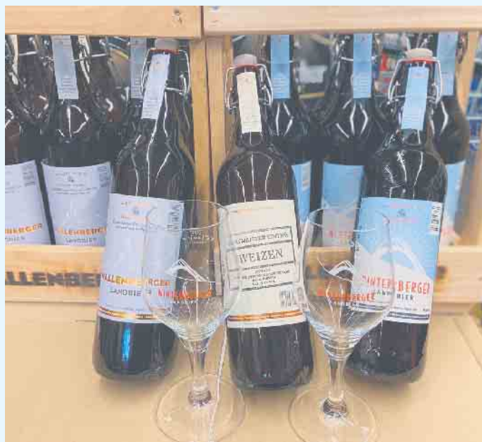
Hallenberger und Winterberger Bier beim E-Center Löffler

Neben dem klassischen Pils werden im E-Center Löffler auch beliebte Sorten wie Braunbier, Porter, Radler hell und dunkel, Lager hell und Alkohol-freies Bier aus dem Hause Bosch angeboten. Seit zwei Jahren ist Inhaber Olav Dumke geschulter Biersommelier und kann durch die unter anderem erlernten Brauprozesse sowie Rohstoffkunde bestens beraten und empfehlen. [BL]