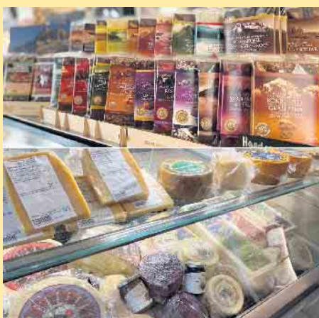
Oben die vielen Schokoladensorten, unten Käse aus Südtirol

Allesamt benannt nach Bergen, Seen oder anderen obligatorischen Orten in Südtirol- Süße Verführungen mit besonderen Zutaten, perfekt auch zum Verschenken! [BL]