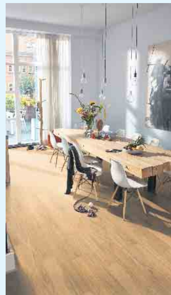
Formschön, nachhaltig und gesund - für Parkett spricht vieles.

Gesund, langlebig, nachhaltig - die Vorteile von Holzfußböden machen deutlich, wie sehr es sich lohnt, auch im Jahr 2022 auf das Naturprodukt zu setzen. „Entscheidet man sich für einen Parkettboden, sind einem nicht nur die vielen ästhetischen Vorteile von echtem Holz sicher“, betont Schmid abschließend. „Mit der Wahl für Parkett tut man sowohl etwas für sein persönliches Wohlbefinden als auch nachhaltig etwas für die Umwelt. Was könnte noch moderner sein?“ (vdp/fs)