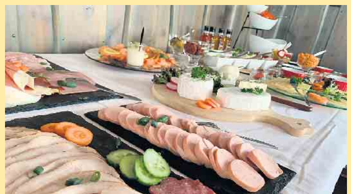
Reichhaltiges Frühstückesbuffet in der Hoheleyer Hütte

Wandern Biken Tolle Aussicht Leckeres Essen Kühles Bier Kaffee & Kuchen