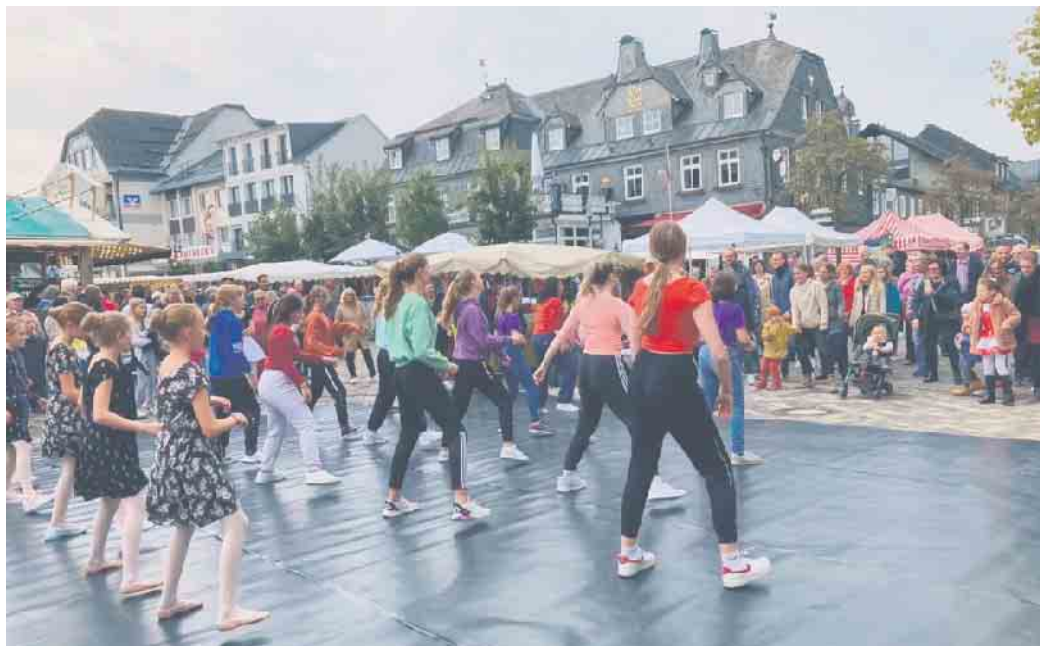
Ein tolles Publikum hatten die Tanzgruppen an der Unteren Pforte in Winterberg.