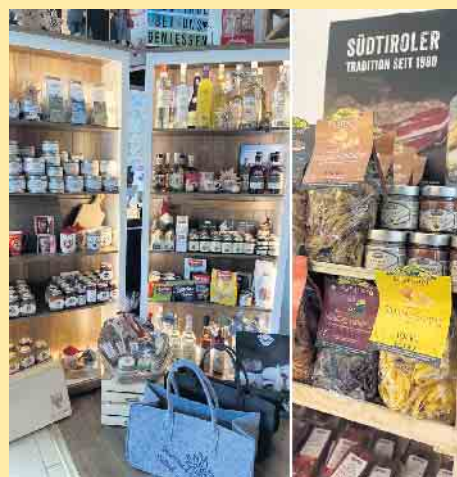
Links die Regale mit schönen Geschenkartikeln, rechts die Eierteigwaren vom Eggerhof