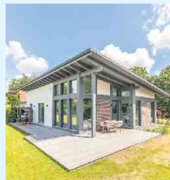
Fertighäuser werden nach den individuellen Wünschen und Bedürfnissen des Bauherrn geplant - vom kompakten Bungalow bis hin zur großen Stadtvilla.

tighausherstellern knüpfen. Dieses persönliche Kennenlernen vereinfacht die Entscheidung für ein Fertighaus. (BDF/MB)