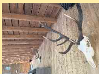
Rustikal gemütliche Dekorationen der Homberg Jause