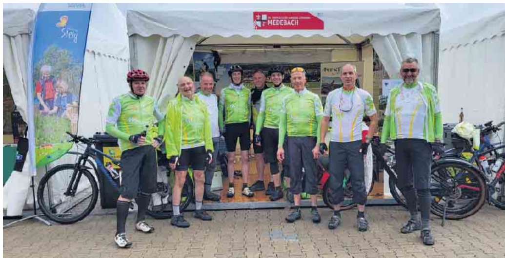
Empfang der Hanseradler auf dem Westfälischen Hansetag in Attendorn. Bericht auf Seite 6