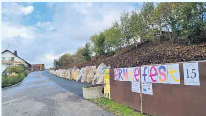
Die Einfahrt zum Hof Wittmar

Am 15. Oktober 2022 findet auf dem Hof Wittmar wieder das beliebte Erntefest statt. Für Groß und Klein wird an diesem Tag einiges geboten: