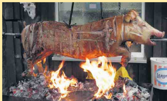
Schweinegrillen zum Erntedankfest

das ganze Jahr, den Jahreszeiten immer saisonal angepasst. Das Team um Barbara Straeck freut sich auf alle Einkehrer. [BL]