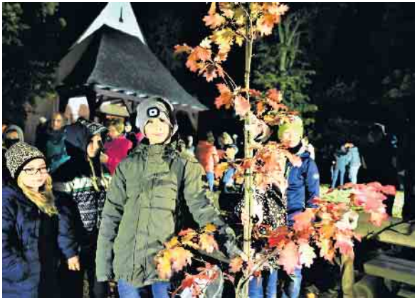
Friedens-Baum gepflanzt während der 15. Lichterwallfahrt zur Wallfahrtskapelle auf dem Kahlen bei Medebach.

Die Vision von Frieden auf der ganzen Erde treibt viele Menschen um. Im Pastoralen Raum Medebach-Hallenberg beteiligten sich zahlreiche Wallfahrer an der abendlichen Lichterwallfahrt zum Kahlen bei Medebach.