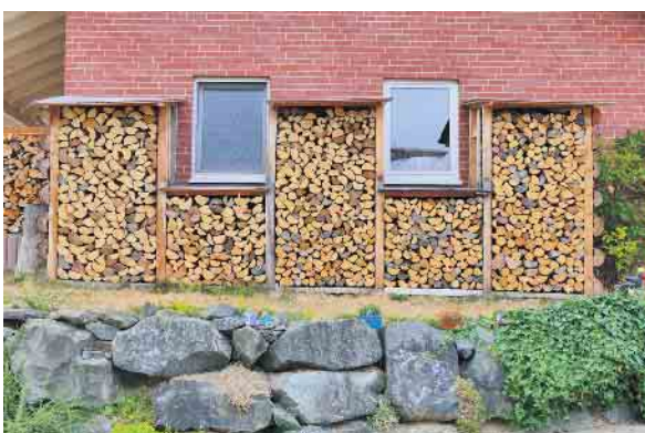
Der nächste Winter kommt bestimmt

Aus der handwerklichen Familien-Bäckerei.