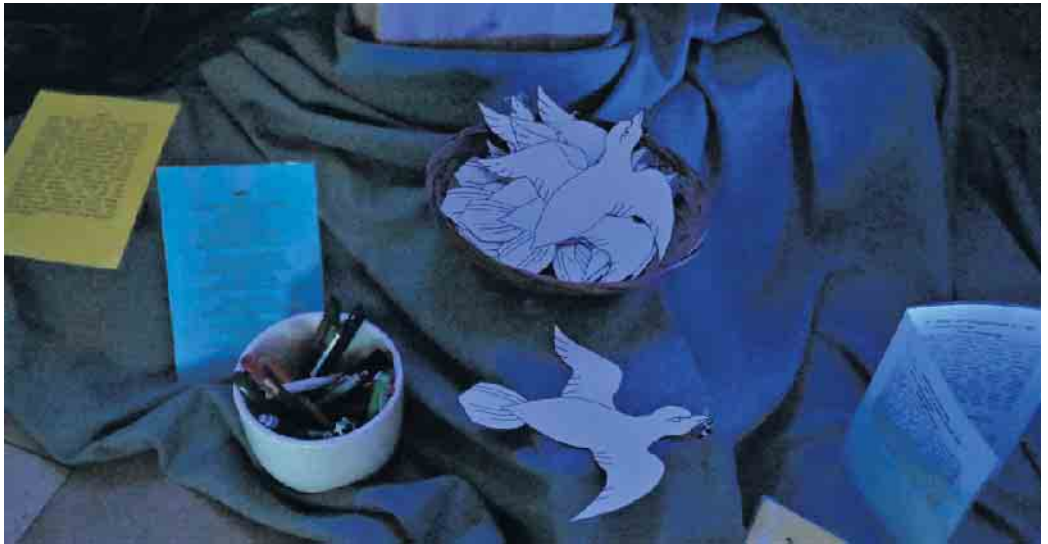
Friedensgebets- und Bastelecke in der Pfarrkirche St. Peter und Paul Medebach.

Der Termin für das Mitmachen bei den nächsten Friedensgebeten des Pfarrgemeinderates: Dienstag, 18. Oktober um