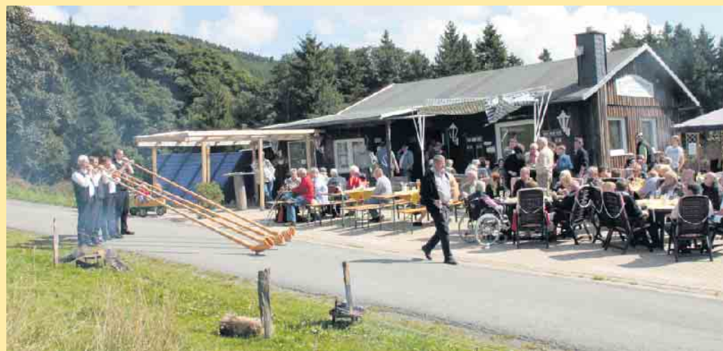
Die Clemensberghütte in Hildfeld

In der Clemensberghütte selbst, gilt das Motto: „Als Fremde kommen und als Freunde gehen!“.- Prima geeignet als Wander- oder Biker-Treffpunkt zu einer gemütlichen Rast. Auf den nahe gelegenen Wiesen ist Zelten und ebenso ein Lagerfeuer nach Absprache erlaubt. Wer also durch das Rothaargebirge in der Nähe von Hildfeld umherstreift, kann prima an der Clemensberghütte zur Ruhe kommen, dabei die Aussicht ins weitläufige Hilletal genießen und sich verwöhnen lassen.