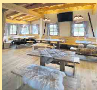
Das gemütliche Ambiente in der Homberg Jause

Am 08.10.2022 Erntedankfest mit Gottesdienst Am 27.11. & 18.12.2022 ab 9.00 Uhr Brunch auf Voranmeldung unter 0176/19991535 Am 03.12. und 10.12.2022 Weihnachtsfeiern im Kollektiv mit Live-Musik auf Voranmeldung Am 31.12.2022 Silvester auf Voranmeldung