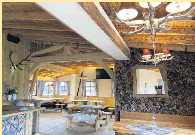
Die Homberg Jause: Tolle Lokation für Feiern aller Art

10.12.2022 finden Weihnachtsfeiern im Kollektiv in der Hütte mit Livemusik statt. Anmeldungen für kleine Gruppen mit den Kollegen oder der Familie. Am 26. Dezember steht ein Weihnachtsmenü auf der Karte und am 31.12. ist eine Silvesterfeier geplant. - Alles auf Voranmeldung. Wandern, Biken, Erleben und Schlemmen am Homberg, wo jeder Moment ein wenig Urlaub ist! [BL]