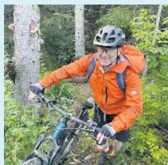
Biken in purer Natur auf herrlichen Trails

Arnsberg mit dem Möhnesee. Die Route führt durch Naturschutzgebiete, vorbei an Quellen bis zum Möhnesee und ist eine landschaftlich sehr reizvolle Tour. [BL]