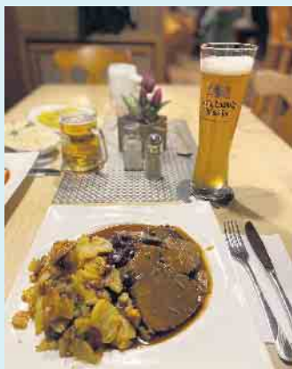
Leckeres Wildgericht im Landgasthof Schöttes

Bis Mitte Oktober finden hier an den Wochenenden wieder die bayrischen Wochen statt. Kulinarisch abgerundet mit bayrischen Schmankerl, und echtem Wiesn-Bier.