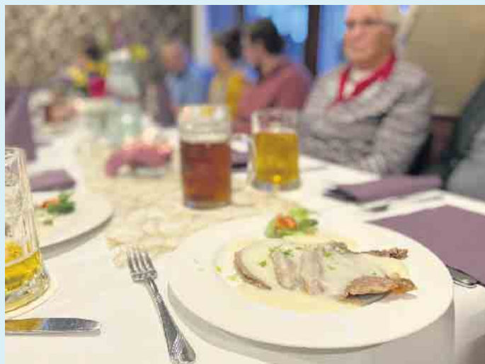
Kulinarische Köstlichkeiten beim Landgasthof Schöttes