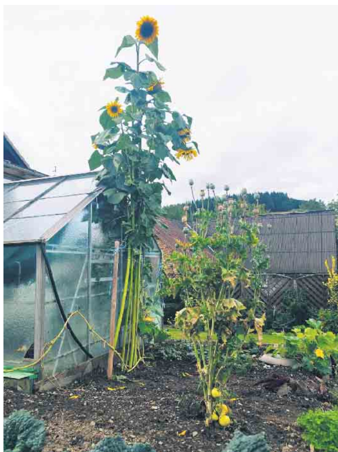
Sonnenblumen im Garten von Familie Schlechter aus Referringhausen