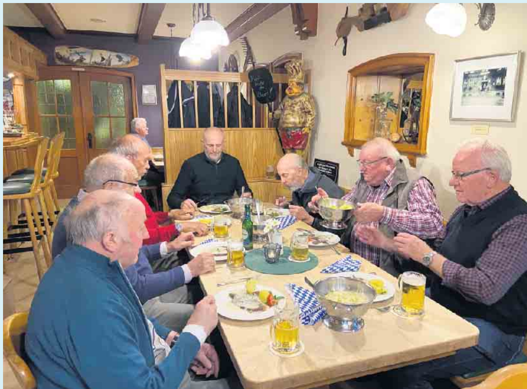
Lockere Runde mit bayrischen Schmankerl und Wiesn-Bier

Im November unbedingt das Martinsgans- und Enten-Essen schon jetzt vormerken.