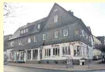
Café Krämer in Winterbergs Zentrum am Marktplatz

In der heutigen Zeit kann das Café Krämer stolz auf sein 25-jähriges Jubiläum mit einem Vierteljahrhundert gelebter Handwerkstradition blicken und möchte am 22. September seine Wiedereröffnung nach Umbau feiern. Obwohl sich das Café Krämer zum Jubiläum ein neues Dach gegönnt hat und die Bauarbeiten noch eine Weile andauern, bleibt der Betrieb weiterhin für seine Gäste geöffnet. [BL]