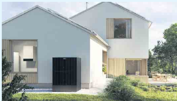
Modernes Einfamilienhaus mit PV-Anlage, Wärmepumpe und Wallbox

auch zum Laden des Elektroautos genutzt werden und nicht nur die Wärmepumpe kann mit dem erzeugten Strom betrieben werden. Der Meisterbetrieb Menke aus Siedlinghausen steht für diese Anwendung mit einem entsprechend abgestimmtem System von Photovoltaikanlage, Wärmepumpe und Wallbox beratend und ausführend zur Seite. Die Kombination aus einer Wärmepumpe mit Photovoltaik und Wallbox bietet sich auch an, wenn Hausbesitzer den Standard eines Niedrigenergiehauses erreichen möchten. Schließlich erlaubt es die Energieeinsparverordnung (EnEV), den selbst erzeugten Strom vom Endenergiebedarf rechnerisch abziehen zu lassen. Der Jahres-Primärenergiebedarf würde dadurch sinken und Hausbesitzer wären berechtigt, attraktive staatliche Wärmepumpen-Förderung auch für Neubauten in Anspruch zu nehmen.- Aber ganz unabhängig davon, ob die Wärmepumpe in einem Neubau oder einem Altbau zum Einsatz kommt- für die Gewährleistung eines dauerhaft sicheren und wirtschaftlichen Betriebes oder Haushaltes muss das Heizsystem möglichst exakt zum Heizbedarf passen. Das Team vom Meisterbetrieb Menke berät Sie gern. [BL]