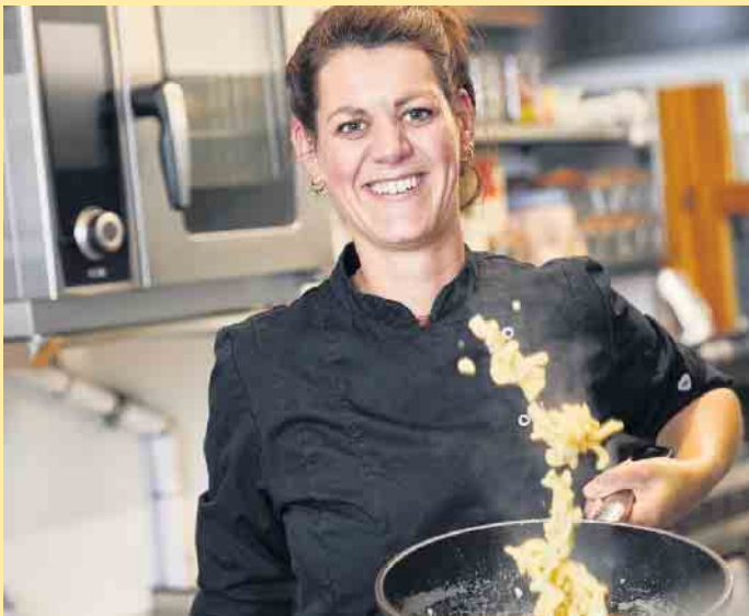
Leckeres aus der Küche in der Nordhang Jause

Hereinspaziert und wohlfühlen- in der neuen Location mit Flair und Gemütlichkeit, der Nordhang Jause, direkt am Fuße des Kahlen Asten, wo das Sauerland am „höchsten“ ist!- Hier lässt es sich gut einkehren