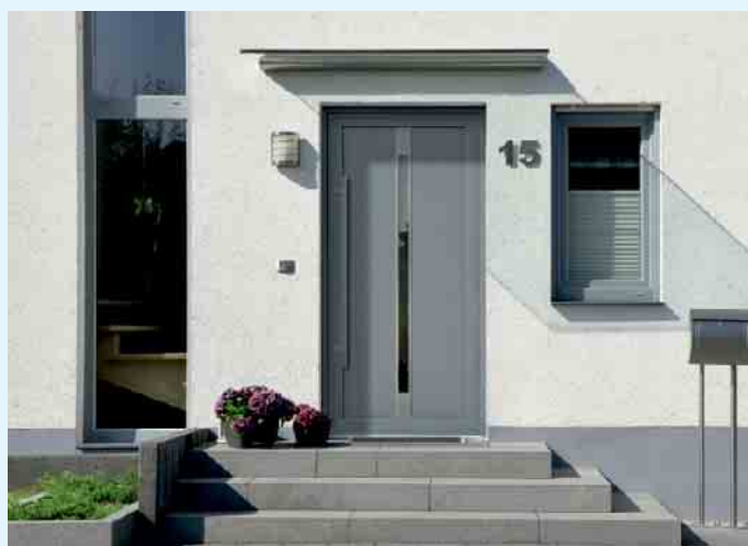
Moderne Haustür und Fenster von Holztec

Des weiteren bietet Holztec neben dem Einbau von Türen wie Zimmer Türen sicheren Wohnungstüren sowie Trennwänden und Trennwandsystemen mit Gleittüren, auch die Nachrüstung von Fenstern und Türen mit Sicherheitssystemen und Beschlägen, den Einbau hochwertiger Isoliergläser, Reparaturarbeiten an Fenstern, Rollläden, Möbeln und die Planung und Montage von Sonnenschutz, Insektenschutz und Markisen. Auch das Verlegen von Fertigparkett, Laminat, Korkboden oder Vertäfelungen gehört neben der Beratung in Sachen Innenausbau und Treppenrenovierung zum Aufgabengebiet. Vor ein paar Jahren kam die Fertigung von Balkonen, Zäunen und Sichtschutzelementen aus Kunststoff hinzu. Natürlich gibt es auch hier eine Vielzahl von Gestaltungsmöglichkeiten in Form und Farbe. [BL]