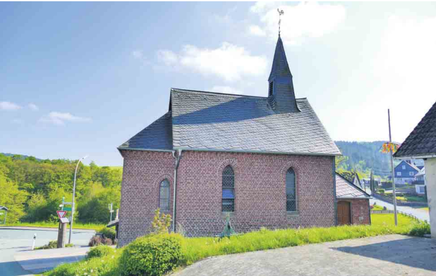
Kapelle in Wiemeringhausen