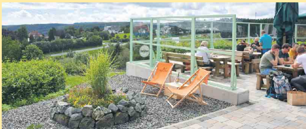
Gemütliche Terrasse mit Weitsicht am Fuß der St. Georg Sprungschanze

Von dort aus geht es weiter den Rothaarsteig entlang bis zum Schneewittchen-Haus. Wer mit dem Bike unterwegs ist, kann sich dort im Bikepark auf den verschiedenen Parcours ausprobieren. Ansonsten kann das komplette Equipment auch im Bike-Verleih