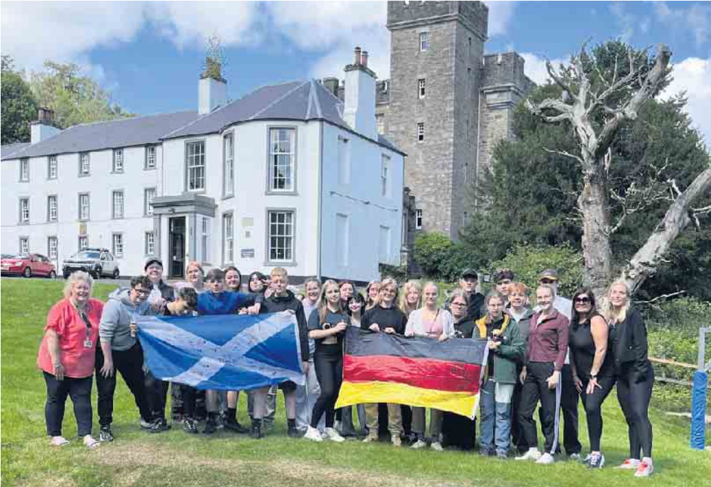
51. Internationaler Jugendaustausch zwischen West Lothian Council und dem Hochsauerlandkreis.

West Lothian/Hochsauerlandkreis. Vom 28. Juli bis zum 3. August fand der 51. Internationale Jugendaustausch zwischen dem West Lothian Council und dem Hochsauerlandkreis statt. Nachdem im Sommer 2024 zwölf Jugendliche aus Schottland im Rahmen des Austauschprogramms im Hochsauerlandkreis zu Gast waren, reiste diese Gruppe aus dem Hochsauerlandkreis nun nach Schottland, begleitet von zwei Kolleginnen des Jugendamtes. Die Reise war voller abwechslungsreicher Erlebnisse - von Kultur über sportliche Aktivitäten zu naturpädagogische Aktivitäten. Neben der Städtetour durch die schottische Hauptstadt Edinburgh und dem dazugehörigen Edinburgh Castle stand auch ein Besuch im „Edinburgh Dungeon“ auf dem Programm, bei dem die Ju-