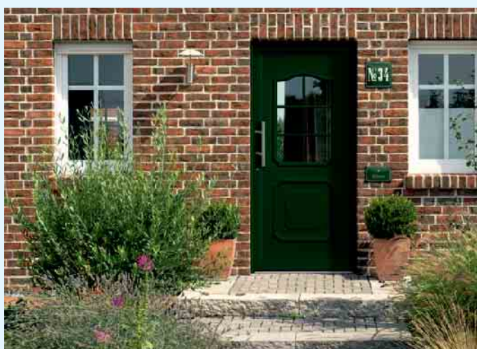
Haustür und Fenster von Tischlerei Holztec