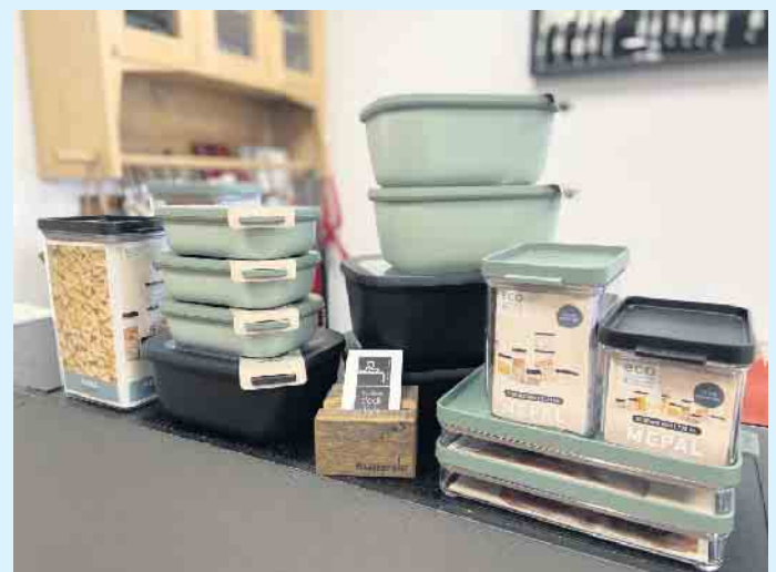
Qualitativ hochwertige Vorratsdosen und Schüsseln von MEPAL