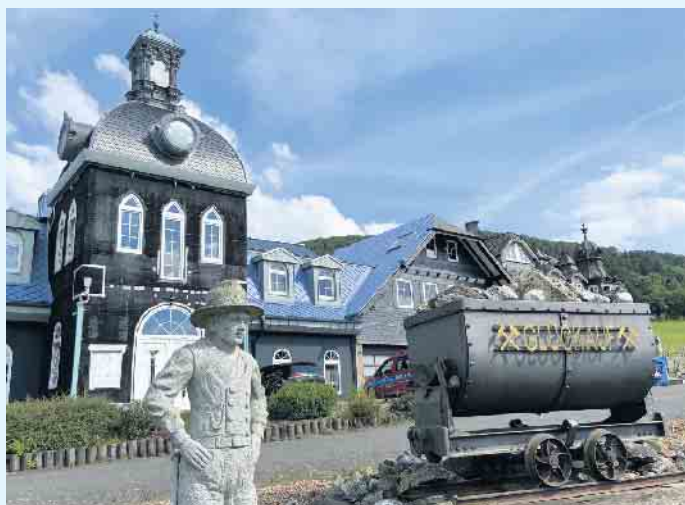
Der Meisterbetrieb Menke in Winterberg-Siedlinghausen

www.meisterbetrieb-menke.de • info@meisterbetrieb-menke.de