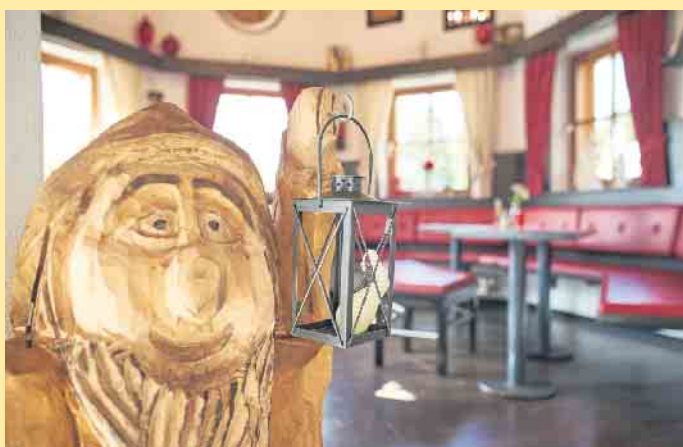
Gemütliche Räumlichkeiten in der Schneewittchen-Hütte

vor Ort gemietet werden. Für die Kinder warten die Zwergziegen, Schafe und Kaninchen in unserem Streichelzoo auf Eure Kleinen. Auf unserer Terrasse kann man aber auch ganz einfach dem Treiben nur zuschauen und an der Ostwand des Kahlen Asten vorbei den Blick in die Ferne schweifen lassen. Ein weiterer Blick in unsere Karte und schon zaubert unser Küchenteam Euch auch noch etwas Leckeres auf den Teller. Damit Ihr bei größeren Gruppen auch ausreichend Platz habt, empfehlen wir eine rechtzeitige Reservierung.