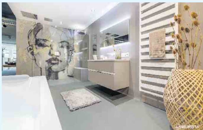
Stylisches Bad von LAMURISTA