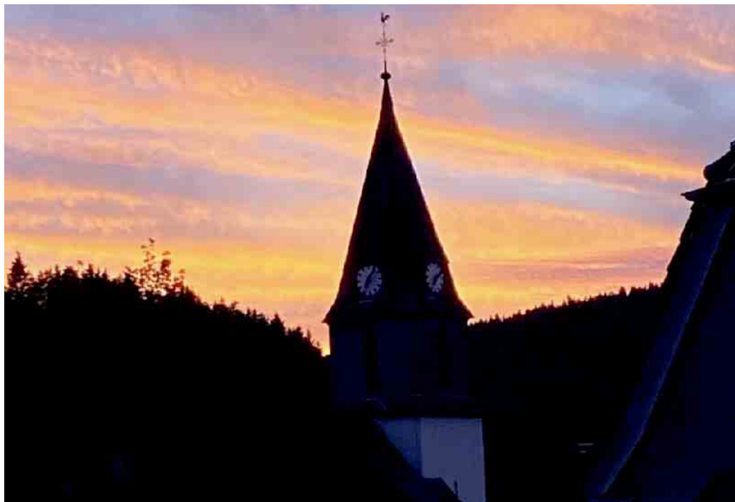
Die Kirche in der Dorfmitte von Niedersfeld.

Bis zur Feier der Erstkommunion im Mai 2025 wurde im ersten Bauabschnitt der Sockel freigelegt, verputzt und fachgerecht abgedichtet, um Feuchtigkeit vom Mauerwerk fern zu halten. Nun steht die Erneuerung der drei Eingänge und damit der Neuaufbau der Stufenanlagen auf dem Bauplan. Später wird an der Nordseite ein Gerüst aufgestellt, um ein Teil des Daches zu reparieren, die Nordseite, weitere Bereiche des Gebäudes und der umlaufende Sockel werden dann neu gestrichen. Der Haupteingang erhält eine barrieregerechte Rampe. Die Gesamtkosten werden durch