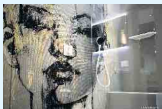
Dusche mit außergewöhnlicher Gestaltung von LAMURISTA

Der Malerbetrieb Schnorbus aus Züschen verleiht Ihren alten Bädern neuen Glanz.- Dank der fugenlosen und belastbaren Oberflächen von LAMURISTA .