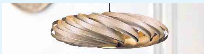
Mit Furnierleuchten wird jeder Raum aufgewertet.

Bäume, die mit viel Know-how zu dem edlen und natürlichen Material verarbeitet werden. Nur sehr wenige der gut 40.000 auf der Erde vorkommenden Holzarten lassen sich zu hochwertigem Furnier verarbeiten. „Rund 140 Arten kommen für die Herstellung in Frage und innerhalb dieser Arten gibt es nur wenige Exemplare, die mit innerer Schönheit punkten und sich damit für die Produktion von Furnieren eignen“, so der Forstwirt und Vorsitzende der Initiative Furnier + Natur (IFN), Axel Groh. Notwendig ist unter anderem ein ebenmäßiger Wuchs und der Stamm muss für eine perfekte Verarbeitung möglichst rund und kerzengerade sein. „Auch ein gleichmäßiges Rindenbild ist wichtig - am besten ohne störende, große Äste“, so Groh. Spuren von Blitzschlag, Hagel oder Insektenbefall führen ebenfalls dazu, dass ein Baum als Furnierlieferant ausscheidet. Ist das richtige Exemplar schließlich von einem geschulten Auge ausgesucht und ins Furnierwerk transportiert worden, wird der Baumstamm nachhaltig und materialschonend Schicht für Schicht mit verschiedenen Methoden in at-