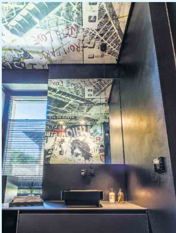
Graffiti-Style im Badbereich von LAMURISTA

Fugenlose Oberflächen von LAMURISTA sind bestens für Renovierungs- und Sanierungsarbeiten geeignet, da die alten Fliesenbeläge überarbeitet werden können.