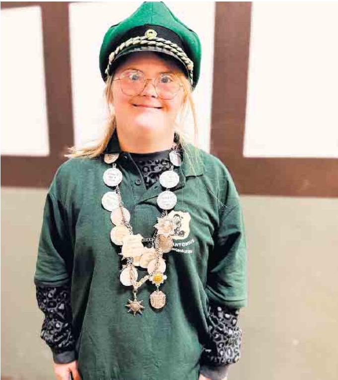
Titmaringhausen hat zwei neue Majestäten: Beim alljährlichen Kartoffelbraten der St. Antonius Schützenbruderschaft ermittelten die Nachwuchsschützen ihre Regenten. Dabei hatte beim Kin-