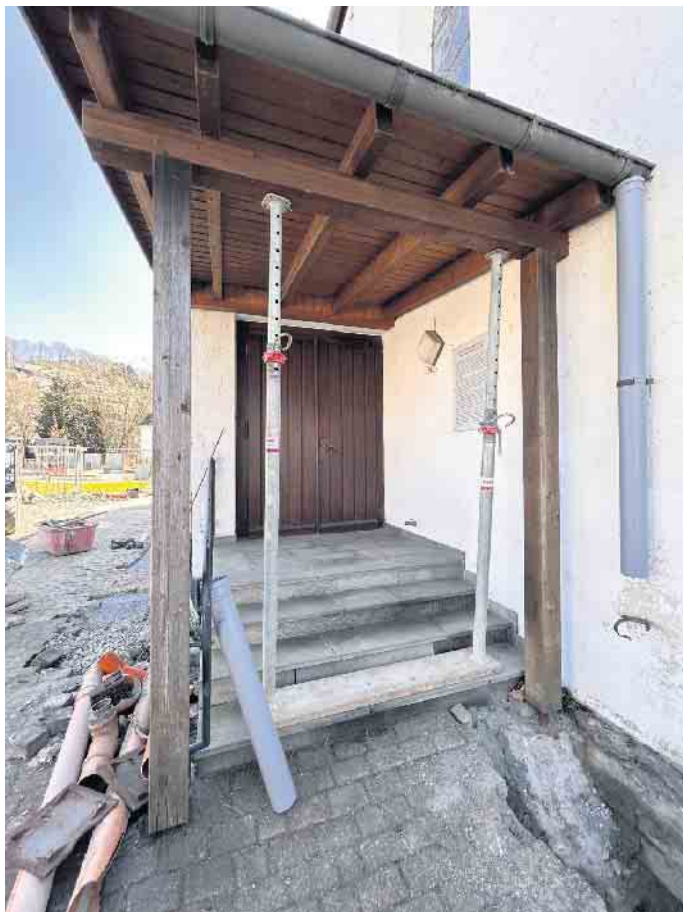
Der Außensockel und die Eingänge werden instandgesetzt.

Weitergehende Infos können inkl. Fotodokumentation auf der Dorfhomepage www.niedersfeld.info nachgelesen werden. niedersfeld.info/abendland