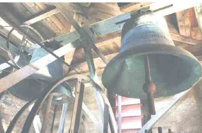
Zwei der vier Niedersfelder Glocken, sie wurden 1946 gegossen.

Früher, und so können einige Niedersfelder erzählen, wurden die Glocken auf dem Kirchturm per Muskelkraft in Schwung gebracht. Die oftmals als Messdiener oder Vizeküster eingesetzten jungen Herren flogen dabei auch hin und wieder mal mit dem Zugseil durch die Lüfte. Später wurde der Antrieb auf Elektromotoren umgestellt. Und eben diese Elektrik und die technischen Einrichtungen, wie die Schlagwerke (sie schlagen im Viertelstundentakt und zur vollen Stunde die Zeit), sind veraltet und werden zunehmend zum Problem. Von „Glockenmörder“ ist sogar die Rede. Wenn die Glocken läuten, dann schwingen diese hin und her, so dass der Klöppel am Glockenkörper anschlägt und den unverkennbaren Glockenton erzeugt. Die Schwingung ist zur hart eingestellt, das schädigt die Glocke auf Dauer. Nun wurde festgestellt, dass auch der Hammerschlag zur Vierte- und zur vollen Stunde zu fest anschlägt.