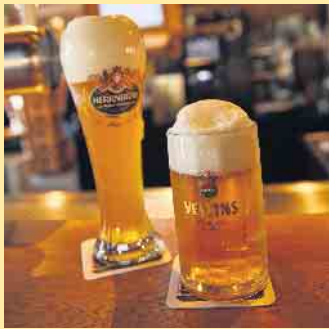
Biergenuss in der Nordhang Jause

und verweilen auf einer Wandertour oder einem Bikeausflug. Hüttenflair genießen in zentraler Lage, direkt an der Hochsauerland Höhenstraße, zwischen Winterberg und Altastenberg gelegen. Diesen Monat, immer montags von 18.00 - 21.00 Uhr, am 08.09./ 15.09./ 22.09. und 29.09.2025 gilt hier bei den mediterranen Grillabenden „All you can eat“ für nur 24,90 € pro Person, nur auf Voranmeldung. Am 20. Oktober ist ein Oktoberfest ab 14.00 Uhr geplant mit Livemusik von „Olmrausch“ und bayrischen Schmankerln wie Riesenbrezel, Leberkäs-Burgern sowie Bayrisches Weißbier vom Fass. Für die kleinen Gäste auch mit Kinderhüpfburg.