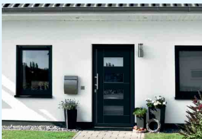
Schlichte Haustürgestaltung von Holztec aus Küstelberg