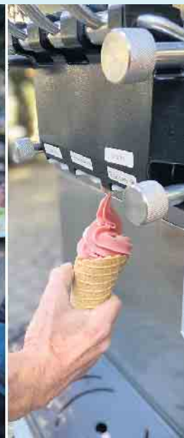
Leckeres vom Grillbuffet und Joghurt-Eis als Dessert zum selbstbedienen