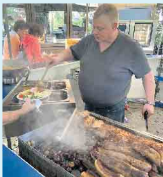
Der Chef selbst beim Grillbuffet