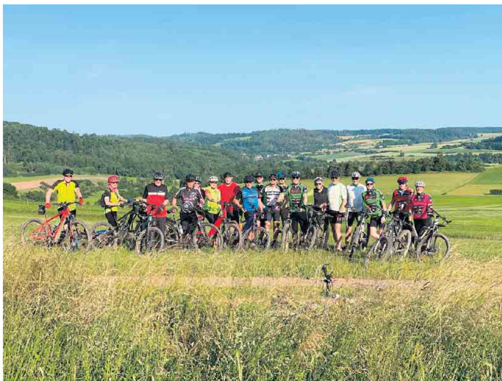
Stadtradeln-Abschlussfahrt im Juni, organisiert vom RW-Medelon Aktiv Bericht auf Seite 3