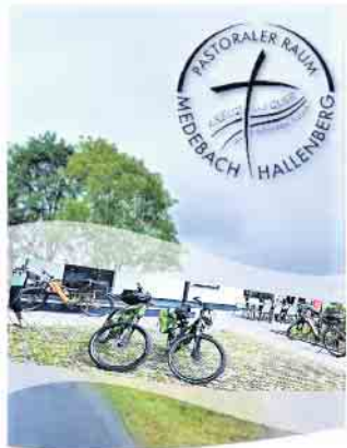
Rad-Pilgern – Tagestour 74 km Pilgerweg „kreuz und quer“ Samstag, 9. September 2023 um 9:00 Uhr Start des Rad-Rundweges: Unterkirche/Hallenberg Merklinghäuser Str., 59909 Hallenberg Anmeldung: 02984-8872 oder 0160-92379087

Eine lange Strecke von 74 Kilometern legen die Radpilger auf dem Pilgerweg „kreuz und quer“ durch Ortschaften im Pastoralen Raum Medebach-Hallenberg zurück. Die Radfahrer werden geführt und nach dem Wunsch der Teilnehmer besuchen sie unterwegs pastorale Orte. Der Einstieg in die Tour ist in jedem Ort möglich und es können auch nur einzelne Wegabschnitte mitgefahren werden. Alle Teilnehmer erleben die abwechslungsreiche Landschaft durch Wiesen, Wälder und Felder und lebendig gestaltete Kirchen. Die Begegnungen mit gleichgesinnten Menschen macht die Radtour zum Erlebnis. Start des Rundweges: Samstag, 9. September, um 9 Uhr ab Unterkirche in Hallenberg. Um circa 17 Uhr zurück an der Unterkirche/Wallfahrtskirche in