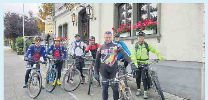
Biketruppe vor dem Landgasthof Schöttes