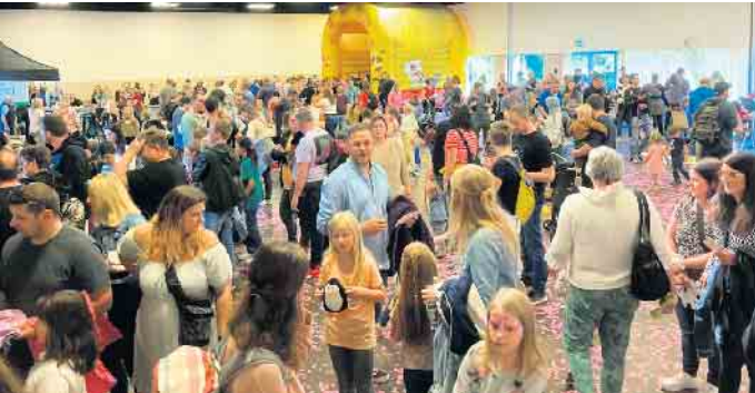
Den ganzen Tag über durften sich die Organisatoren des Stadtmarketingvereins Winterberg mit seinen Dörfern über rege Resonanz freuen.

Premiere des Kinderfestes in der Stadthalle Winterberg