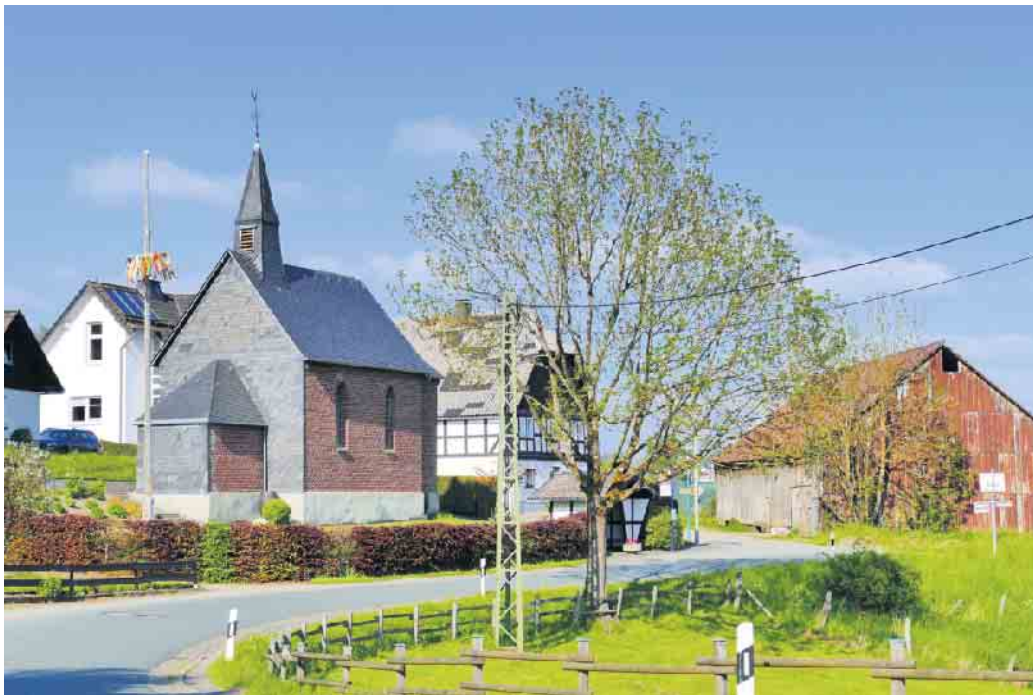
Wissinghäuser Kapelle. Erbaut 1897 durch Wilhelm Lichte, vom Gehöft Lichte (Hermes).