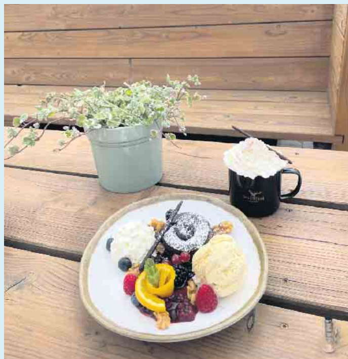
Leckere Desserts „Bei Möppi“

sind am Samstag, den 26. August ab 16.00 Uhr mit der Band „Mutants of Banana Street“ garantiert. Bei Möppi kann man die wilde Seite jeder Saison genießen. Hier treffen rustikales und stylisches Hüttenflair auf gleich drei Etagen, mit Winterbergs modernster und größter Erlebnisgastronomie aufeinander. Die große Außenanlage lädt bei gutem Wetter zum chillen ein. Bei gutem Wetter wird für die kleinen Gäste auch eine Hüpfburg aufgebaut. [BL]