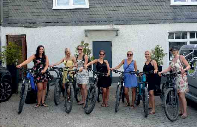
Bei Uppu Bikewerkstatt und Bikeverleih gibt's Bikes für alle

Adrenalin und Abenteuer pur- ein Gespräch mit Uppu Gruß