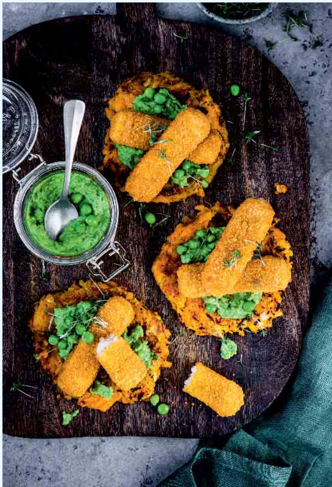
Veggie-Kost zum Schlemmen: Kürbis-Kartoffel-Puffer mit Erbsencreme und veganen „Fischstäbchen“.

Rezepttipps für eine abwechslungsreiche pflanzliche Ernährung