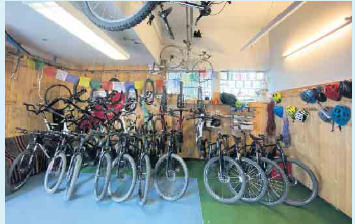
Uppu Bikewerkstatt und Verleih in Winterberg

Service und Werkstatt rund ums Bike befinden sich hier ebenfalls direkt vor Ort, ganz zentral in der Mitte des Waltenberg, im Herzen von Winterberg. Über 30 Bikes stehen im Bikeverleih Uppu zur Verfügung. In den Reifengrößen von 20 bis 29 Zoll sind für alle Altersklassen passende und gut gewartete Mountainbikes vorhanden. Auch Damen- oder Kinderbikes können bei Uppu auf Anfrage ausgeliehen werden.