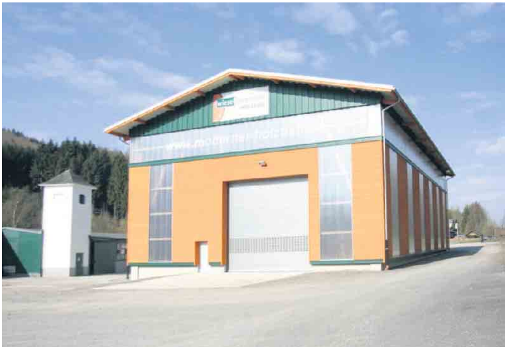
Produktionshalle Wiese und Heckmann GmbH