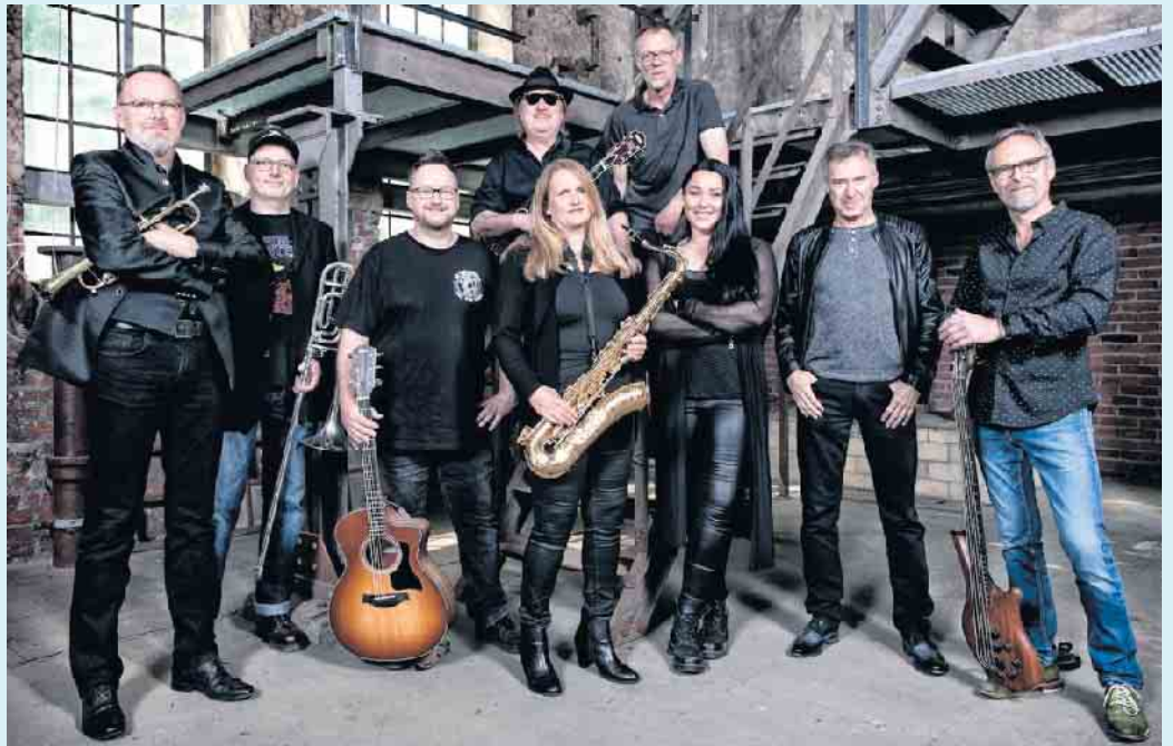
Die Band „No Porridge“

Hinzu kommt am Samstag, den 09.09.2023 noch der Liveauftritt der Band „No Porridge“. Beginn ab 19.00 Uhr. Die Band tritt seit vielen Jahren im Landgasthof Schöttes auf. Brillanter, ehrlicher Sound in Sachen Livemusik mit unvergessenen, gecoverten Mainstream-Rock- & Popsongs, überwiegend aus den 80ern, aber auch aus früheren und späteren Jahren. Tolles Programm, Spielfreude und ein authentischer, brillanter Sound machen „No Porridge“ zu einer ersten Adresse in Sachen Livemusik. Bei Kennern der Sauerländer Livemusik-Szene ist die