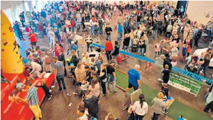
Viel Trubel herrschte bei der erfolgreichen Premiere des Kinderfestes in der Stadthalle Winterberg.