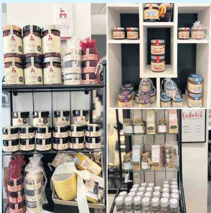
Große Auswahl an Feinkostprodukten beim „Tischlein deck dich“

Das Team im „Tischlein deck dich“ stellt alle Produkte auch gerne als Präsentkorb zusammen und gestaltet Gutscheine zum Verschenken. Neben den qualitativ hochwertigen Feinkostprodukten werden noch viele Haushaltswaren, Wohnaccessoires und Deko von etwa 70 namhaften Herstellern im klassisch zeitlosen und ausgefallenen Stil und für jeden Geschmack angeboten. [BL]