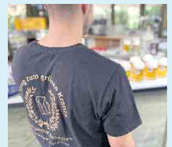
Biergenuss im Landgasthof Schöttes

Die Speisekarten sind über QR-Codes von den Tischen aus per Handy einscannbar.- Darüber ge-