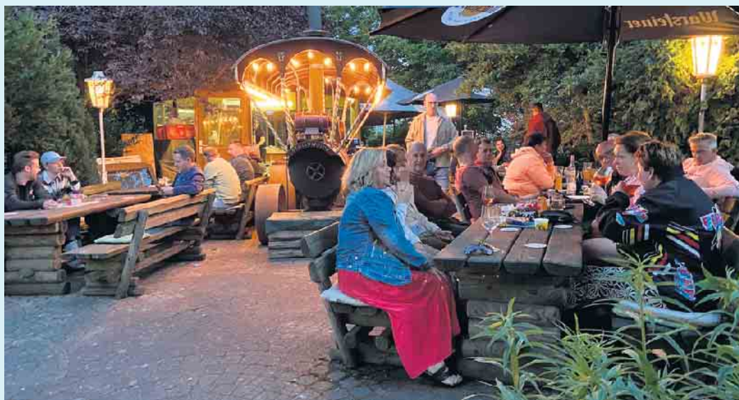
Gemütliche Atmosphäre in Biergarten des Gasthof Schöttes

Feiern und Spaß haben ist hier Programm. Kulinarische Sonderwünsche werden natürlich auch gerne umgesetzt. Viele Rennrad- und Mountainbike-Gruppen, aber auch Motorradfahrer kehren schon seit vielen Jahren hier ein und kommen immer wieder. Besonders