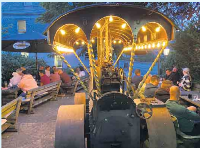
Der aussergewöhnliche BBQ-Grill im Dampflok-Style beim Gasthof Schöttes