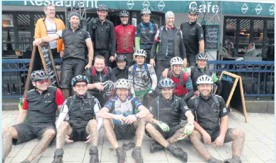
Lustige Biketruppe vor dem Bistorant Uppu in Winterberg

Natürlich sollten genauso Revier- und Waldbesitzer in den hiesigen Wäldern Verständnis dafür aufbringen, dass Mountainbiker Erholung in den Wäldern suchen und gerade Waldwege gleichermaßen nutzen dürfen. Es wäre sinnarm, als Revier- und Waldbesitzer vorhandene Wege für Biker und Wanderer zu sperren- genauso wenig wie Loipen für Langläufer im Winter. Schließlich gewöhnt sich das Wild auch ganz schnell an uns Menschen, wenn man sich ganz normal auf den vorhandenen Wegen bewegt. Wenn jeder respektvoll mit der Natur umgeht, funktioniert alles reibungslos. Der Wald steht schließlich allen zur Erholung zur Verfügung. Mensch und