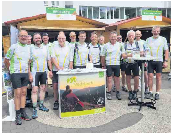
Die Hanseradler werden am Stand der Touristik begrüßt.