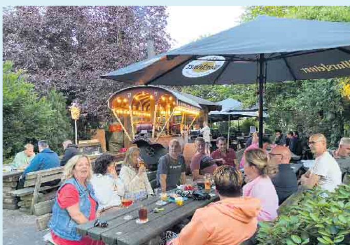
Lustige Runde im Biergarten in Wiemeringhausen

die Mountainbiker und Rennradgruppen sind hier herzlich willkommen. Nach einer langen Bike-tour kann man im Biergarten mit Rondell, unabhängig vom BBQ im Sommer, direkt neben dem Gasthof bei gutem Wetter den Tag in gemüthlicher Runde ausklingen lassen. Bei schlechtem Wetter natürlich auch in der Wirtsstube. Alle Speisen können einen Tag zuvor auf Bestellung gerne auch für zu Hause abgeholt werden. Vorbeischaun lohnt sich immer. [BL]