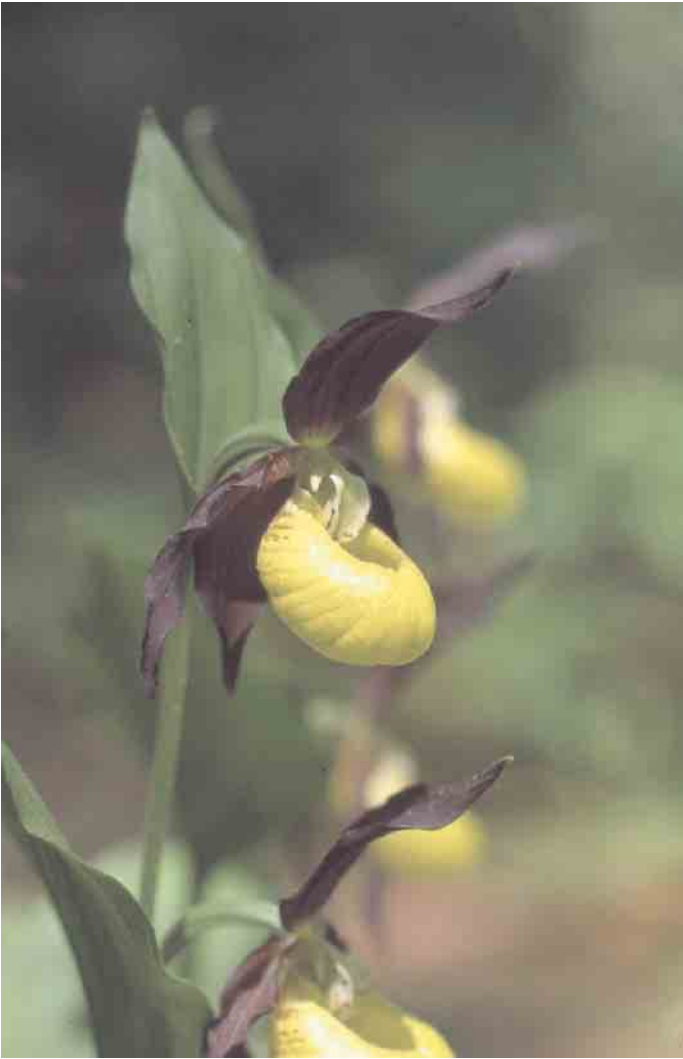
Orchidee Frauenschuh.